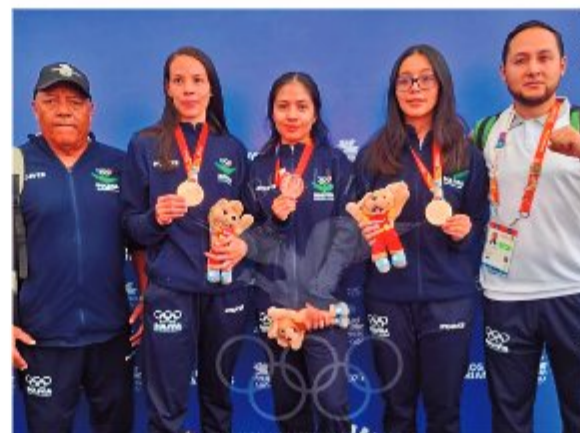
BRONCE. El equipo mixto de taekwondo logró la medalla de bronce.

“Es una satisfacción llevar medallas para Bolivia, jugamos por el oro, pero lastimosamente no se dio. Queda seguir con los entrenamientos y mejorar, me faltó seguridad para llegar al primer puesto”, dijo el medallista quien compitió por primera vez en los Juegos Bolivarianos.