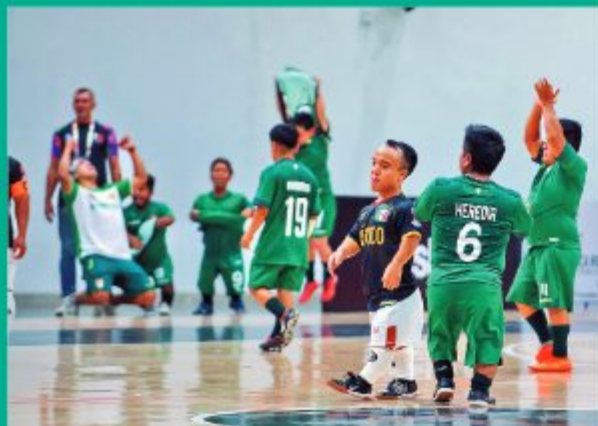
FELICES. Los nacionales festejan la clasificación al Mundial.

Después de una destacada participación en la Copa América de fútbol, la Selección Nacional de talla baja concentró su mirada en el Mundial que se realizará en Marruecos 2026; con cuya finalidad la Comisión que forma parte de la Federación Boliviana de Fútbol elaborará un plan de trabajo para cumplir una importante campaña en el campeonato internacional.