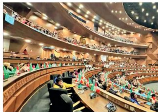
ASAMBLEA. Debe aprobar un proyecto urgente del ley.