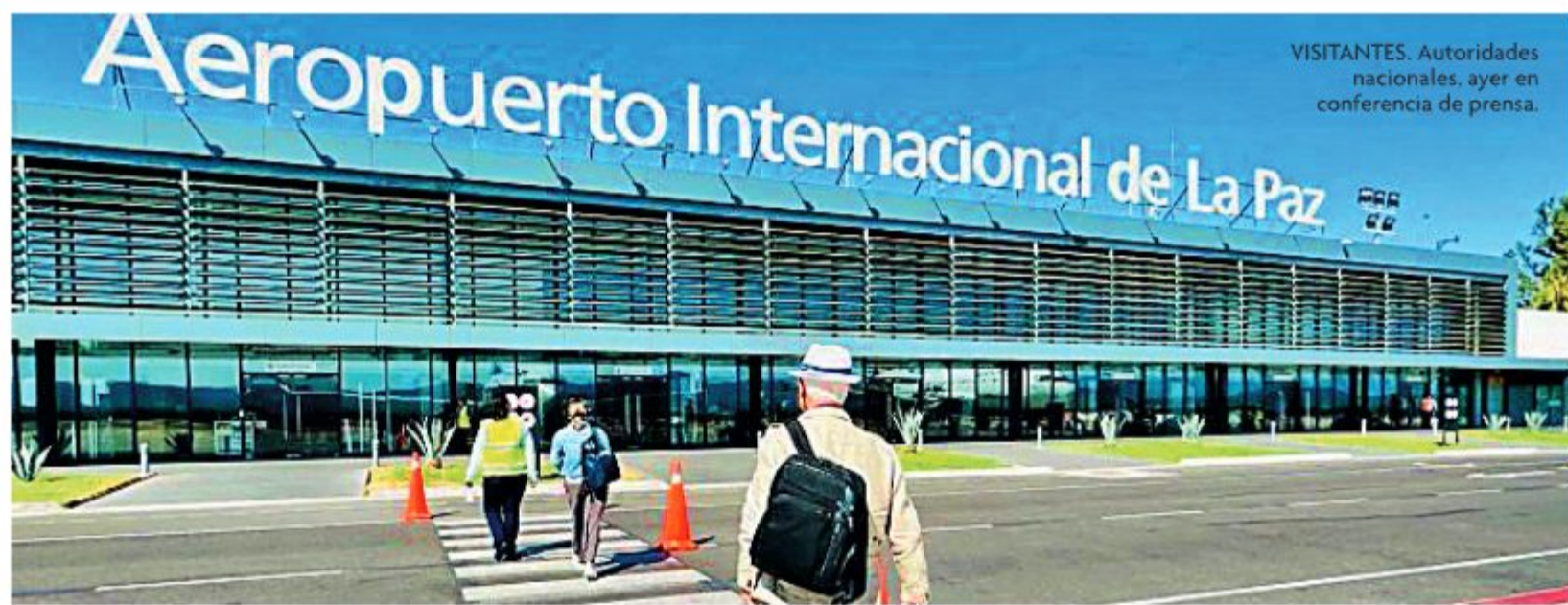
VISITANTES. Autoridades nacionales, ayer en conferencia de prensa.

SE BUSCA GENERAR DIVISAS Y FOMENTAR EL TURISMO