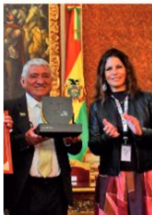
CEREMONIA. La Paz recibió ese galardón.

En la ceremonia participaron autoridades nacionales, delegaciones de 21 países miembros de la UCCI y autoridades municipales. "Este galardón reconoce su extraordinaria riqueza cultural, su compromiso con la preservación del patrimonio, su dinamismo creativo y la relevancia de que ambas ciudades tienen para la identidad no solamente de Bolivia, sino también para el espacio iberoamericano", complementó la representante de la unión de ciudades de la región.