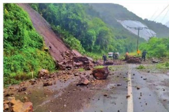
CONTROL. Algunas vías del país se encuentran intransitables.

A su turno, el Presidente de la ABC manifestó que se inicia una nueva etapa de diálogo, transparencia y trabajo conjunto y que esta nueva gestión significa un "cambio para el país y para los transportistas de Bolivia" al integrar los departamentos a través de la infraestructura vial y al transparentar la gestión de la ABC.