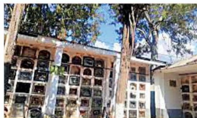
COCHABAMBA. Interior de la necrópolis de esa ciudad.

Se analizará las cámaras de seguridad para identificar a la persona que pudo haber cometido esta acción delictiva.