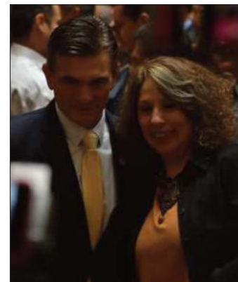
La ministra Cinthia Yáñez.

"Hay que devolverle confianza al mundo, en sentido que Bolivia es un lugar apto, seguro para poder visitar y que los bolivianos también somos gente que cuando visita otros países vamos a hacer turismo, vamos a hacer comercio respetando sus normas", remarcó.