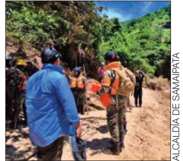
Bomberos hallan un cuerpo.

El bono se entrega a estudiantes de colegios fiscales y de convenio. Para este año, más de dos millones de niños y adolescentes de todo el país son beneficiarios de este incentivo económico, según el Ministerio de Educación.