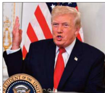
Donald Trump, presidente de EEUU.

El republicano dijo que estaba 'satisfecho' con el desempeño de Siria