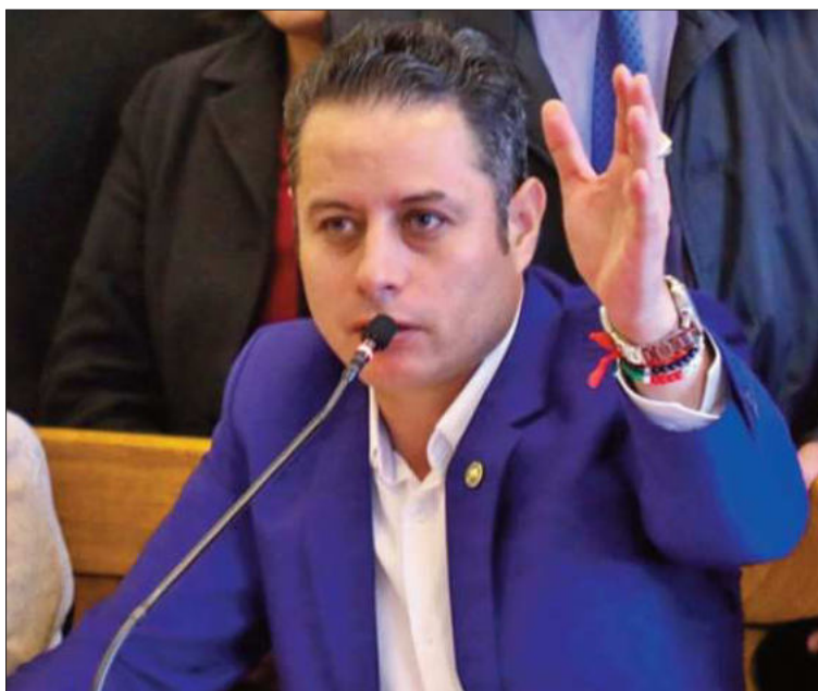
ADVERTENCIA. El vicepresidente Edmand Lara en la Asamblea, ayer.