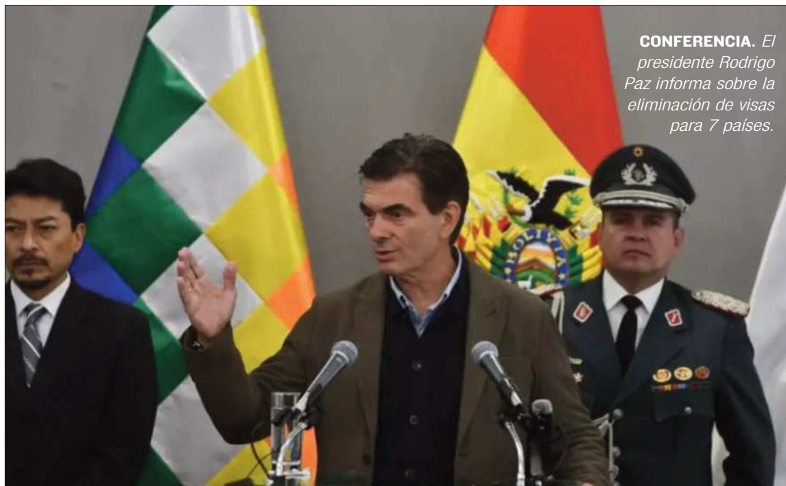
CONFERENCIA. El presidente Rodrigo Paz informa sobre la eliminación de visas para 7 países.

"Por un tema ideológico, vinculado a visas, perdimos 900 millones de dólares que deberían ser dólares que estén circulando en la economía nacional, en el turismo. Eso es hacerle daño a la patria", afirmó Paz Pereira en conferencia de prensa.