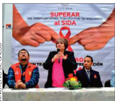
Autoridades brindan detalles.

Aproximadamente, 800 niños y niñas viven con la enfermedad en el país