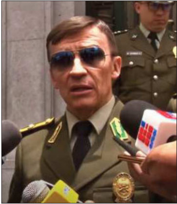
El general Mirko Sokol.

El comandante de la Policía informó sobre los casos pendientes