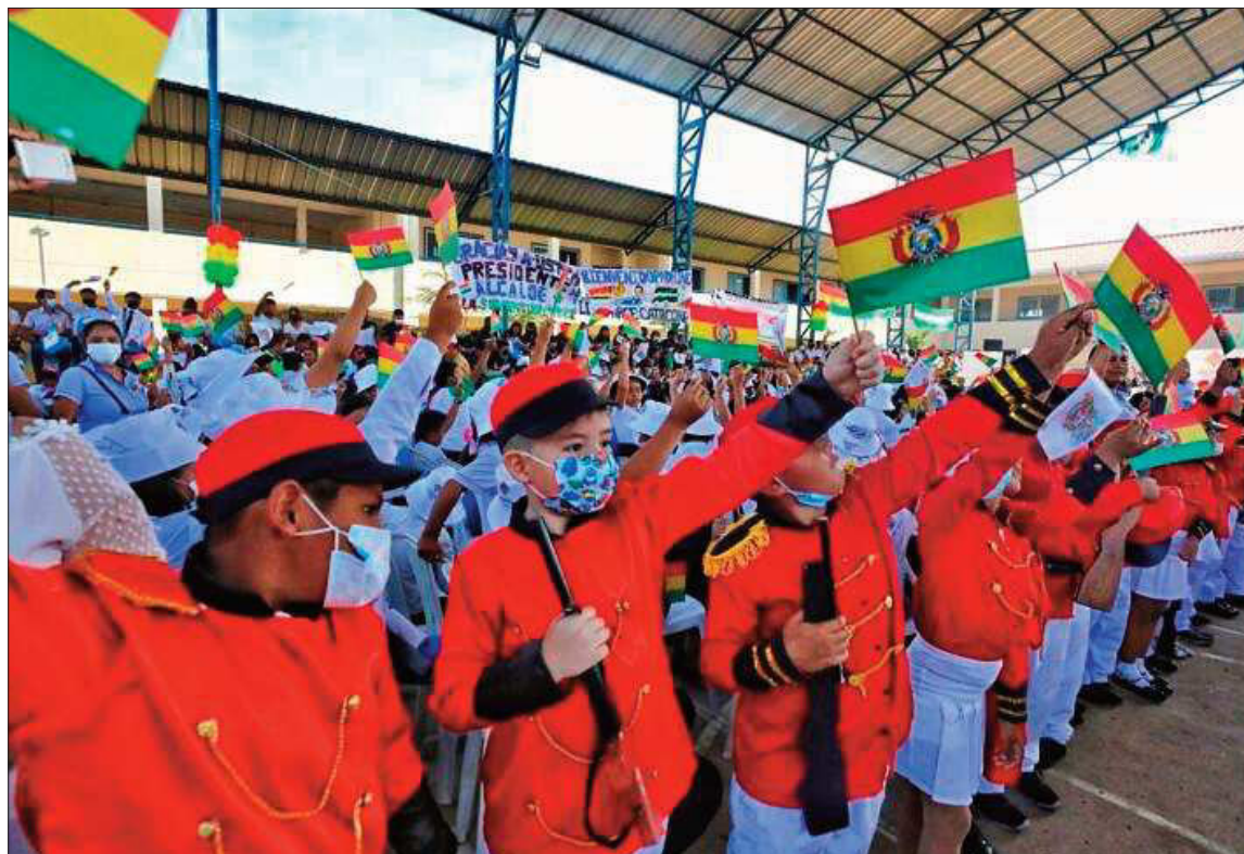
BENEFICIO. Estudiantes beneficiados con el bono. El incentivo tiene el fin de evitar la deserción escolar.

Asimismo, la cartera estatal hizo un llamado a todos los beneficiarios rezagados a que acudan