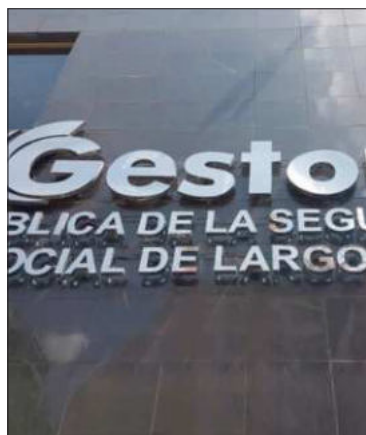
Frontis de la Gestora Pública.

El Presidente anuncia la reorganización de la entidad pública