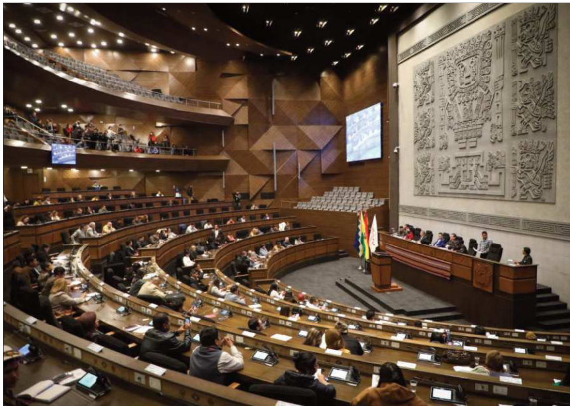
ASAMBLEA. Senadores y diputados aprobaron con dispensación de trámite la resolución legislativa.

El pleno bicameral comenzó el debate de dicho proyecto con dis-