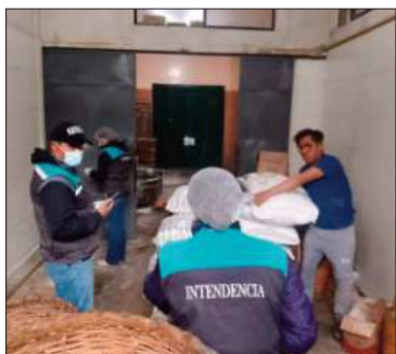
La Alcaldía interviene la panadería.

La panadería enfrenta una clausura definitiva si no mejora la inocuidad