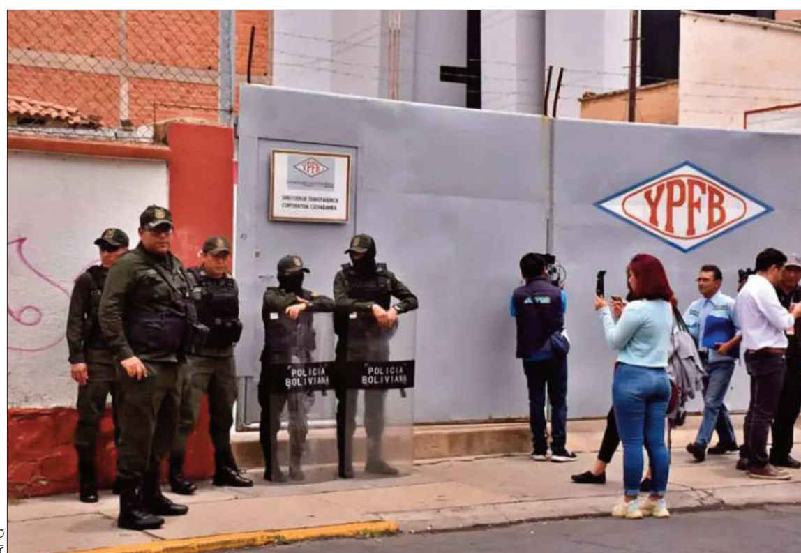
INTERVENCIONES. Efectivos policiales participaron en el allanamiento en Cochabamba y en los demás.