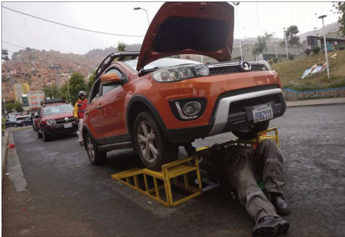
CONTROL. Hasta la fecha el 66% del parque automotor cumplió con la Inspección Técnica Vehicular.

En su criterio, la baja que se observa en los vehículos inspeccionados esta gestión se debe a la falta de combustible, que provoca que varios de los motorizados permanezcan en las filas por gasolina o diésel en las estaciones de servicio.