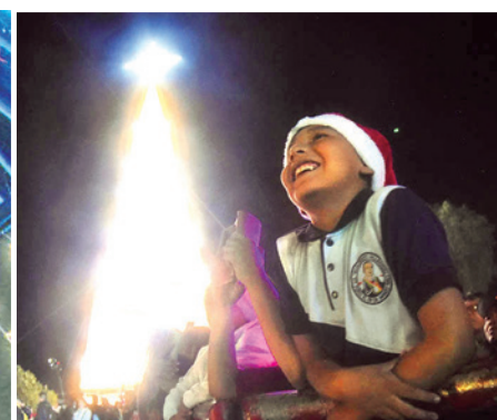
La alegría de los niños en el encendido de las luces.

El gigantesco árbol con las luces y el fondo del Cristo de la Concordia, en el cerro de San Pedro, anoche.