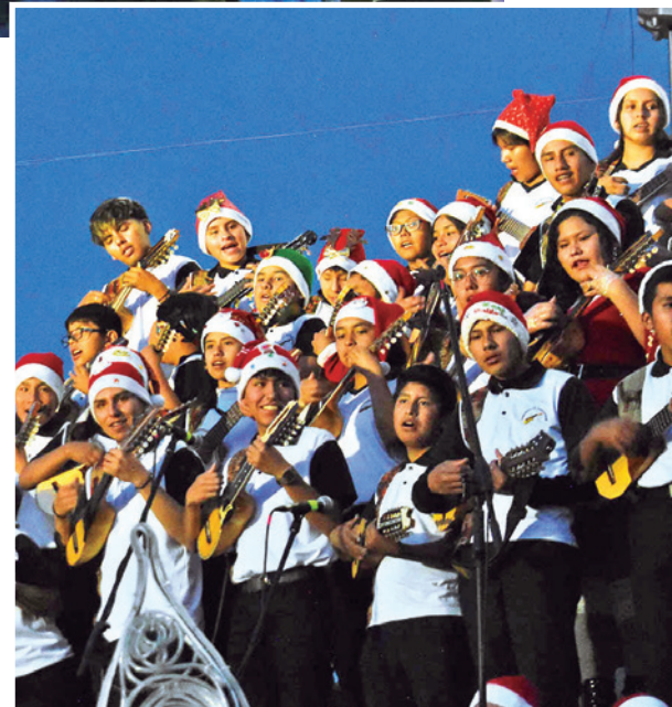
El coro de niños en el encendido de luces anoche.

Por la temporada navideña, el teleférico atenderá desde las 9:00 hasta las 23:00 durante todo diciembre.