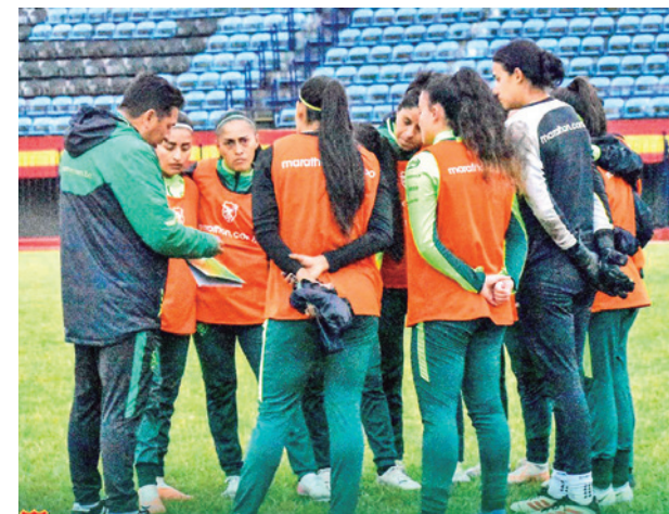
Las jugadoras de la Selección de Bolivia.