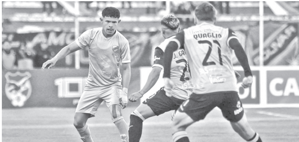
Incidencias del partido Bolívar y The Strongest. CLUB BOLIVAR

Es segundo, en la tabla de posiciones, The Strongest con 58 puntos, está a cuatro de Always Ready. Tienen dos partidos de visitante, frente a FC Universitario y Real Tomayapo; mientras, de local se enfrentarán a