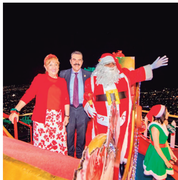
Manfred Reyes Villa inaugura el decorado navideño.