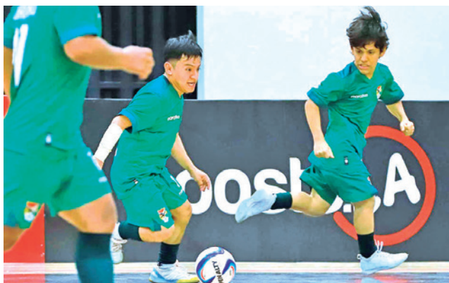
La selección nacional de talla baja. COPA AMERICA TB