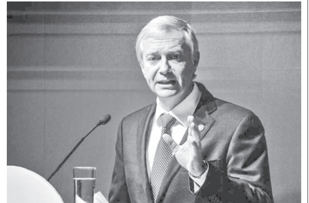
El candidato José Antonio Kast.

Trump afirmó que las operaciones marítimas ya habían destruido más de 20 buques y causado más de 80 muertes desde el 1 de septiembre, afirmando que Estados Unidos había detenido el 85% del flujo marítimo.