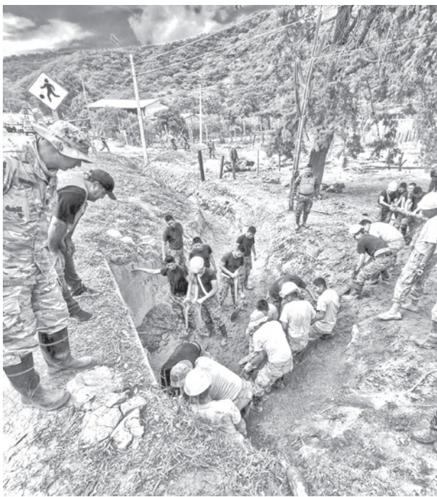
Trabajos de limpieza en Achira, en Samaipata. GADSC

Troche informó que el Gobierno trabaja bajo dos pilares: la entrega de ayuda hu-