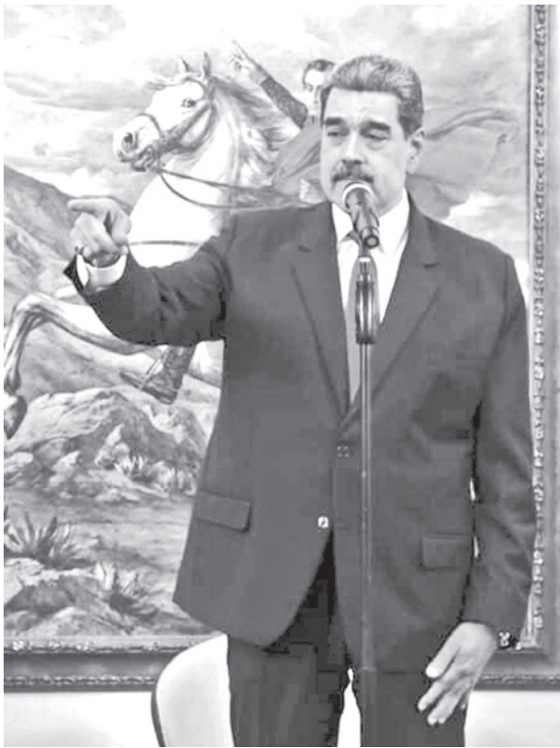
Nicolás Maduro, presidente de Venezuela.

El presidente Trump anunció que las acciones militares estadounidenses, hasta ahora centradas en el hundimiento de lanchas rápidas sospechosas de transportar drogas en el Caribe, pronto se extenderían a territorio vene-