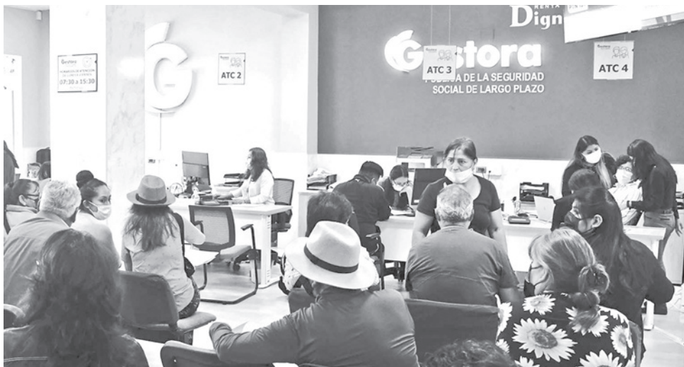
Instalaciones de la Gestora Pública en Cochabamba.