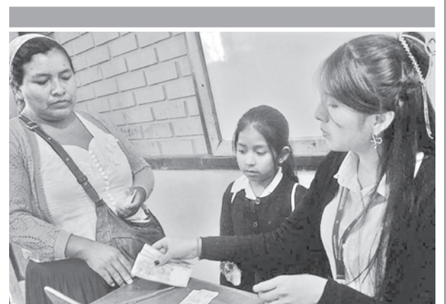
Pago del Bono Juancito Pinto. DANIEL JAMES

Esta primera medida estará acompañada de otras adicionales para garantizar que la información migratoria y el flujo de frontera genere seguridad.