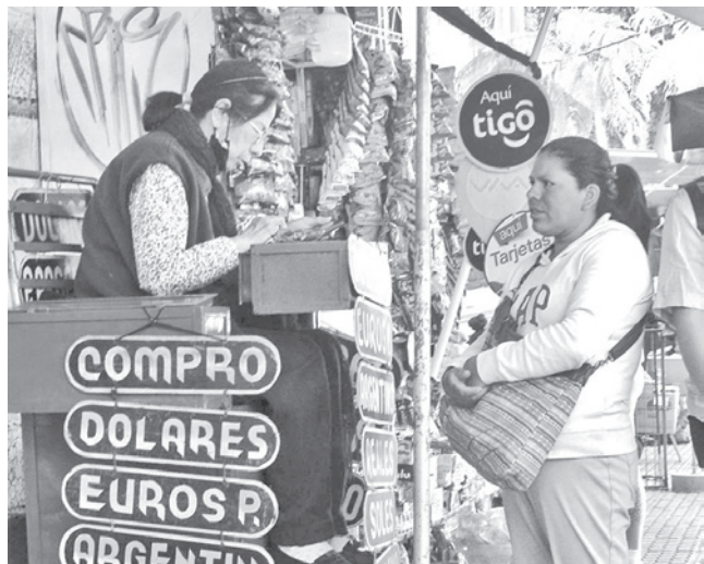
Venta de dólares en el mercado paralelo de Cochabamba. DANIEL JAMES

Oficial. No se trata de una devaluación, el precio oficial de la moneda extranjera sigue en 6,86 para compra y 6,96 para la venta.