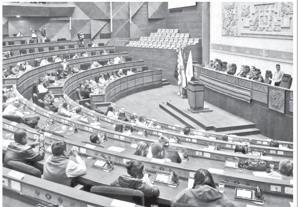
El pleno de la Cámara de Diputados en sesión, ayer.