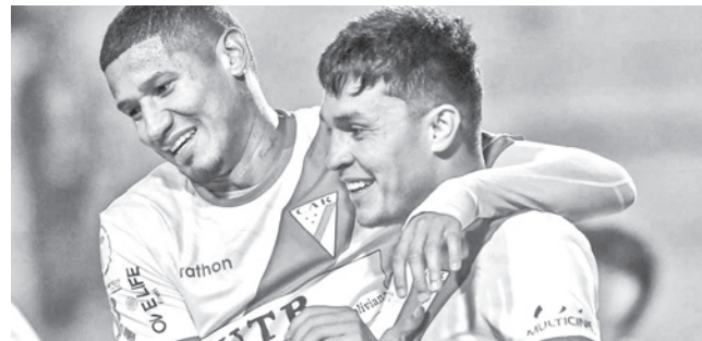
El parido entre Always Ready y ABB. ALWAYS READY

Bolívar debe jugar de local ante Nacional Potosí y San Antonio, y de visitante frente