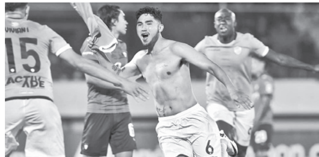
El clásico entre Aurora y Wilstermann. DANIEL JAMES

Recurso. El Equipo del Pueblo espera que la sanción que lo dejó con menos puntos pueda revertirse y evitar el descenso