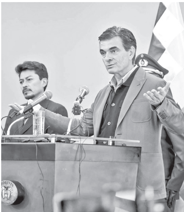
El presidente Rodrigo Paz, en conferencia, ayer.

El Salar de Uyuni, uno de los mayores desiertos salinos del planeta, el Titicaca, que es