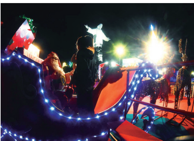
El trineo de Papa Noel, parte de los atractivos.

Cochabamba se ganó el título de “Ciudad de la Navidad” al ser el primer municipio de Bolivia en iluminar