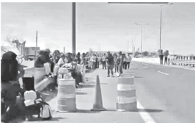
Migrantes en la frontera Chile-Perú.

Un grupo de 30 miembros de las Fuerzas Armadas se encuentran en constante vigilancia fronteriza. Pertenecen al batallón de la Tercera Brigada de Caballería de Tacna. También se obser-