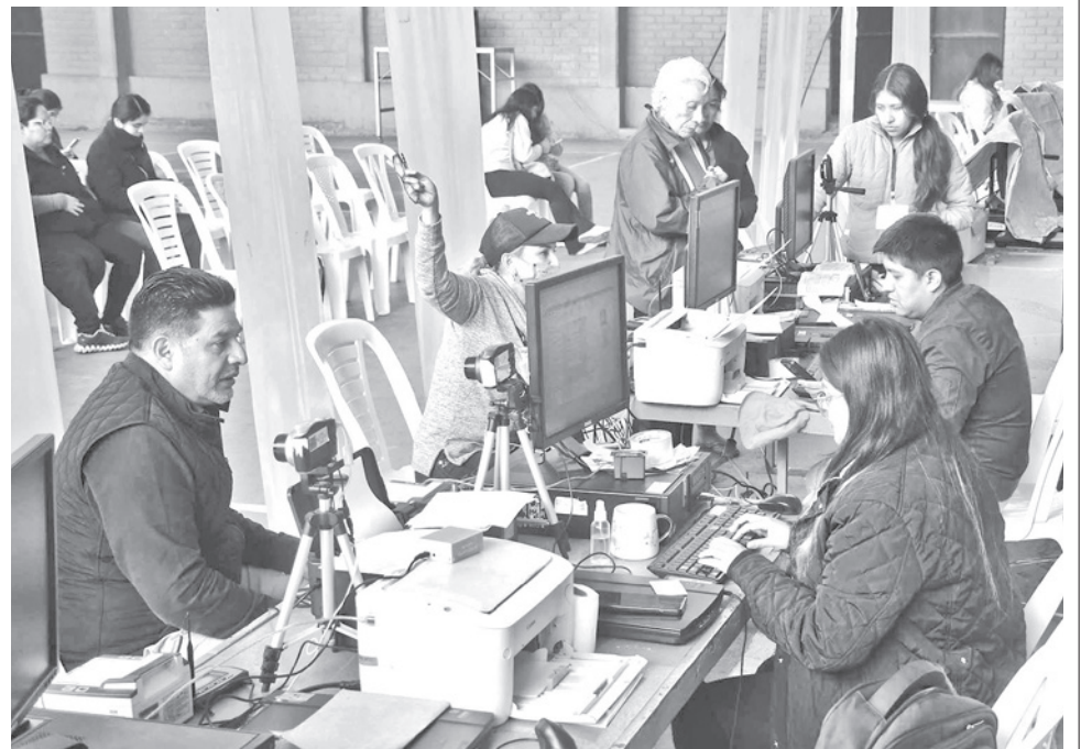
Ciudadanos se empadronan para las elecciones generales. CARLOS LÓPEZ

El registro está dirigido a nuevos votantes que cumplan años antes del día de la elección, a ciudadanos que