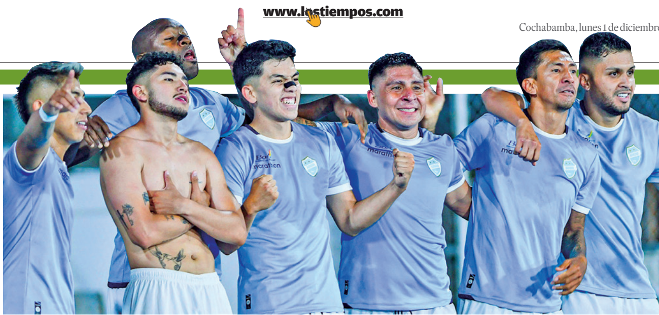
Aurora venció a Wilstermann, en el clásico.

Ya el partido estaba sentenciado, porque Wilstermann no encontró el camino ante una zaga aurorista que estaba bien plantada atrás con Alonso Sánchez.