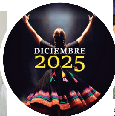
EDWIN FERNÁNDEZ ROJAS Los Tiempos