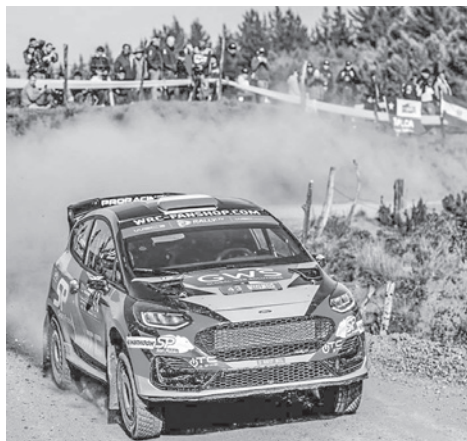
Una de las carreras del destacado piloto boliviano. ADECRUZ