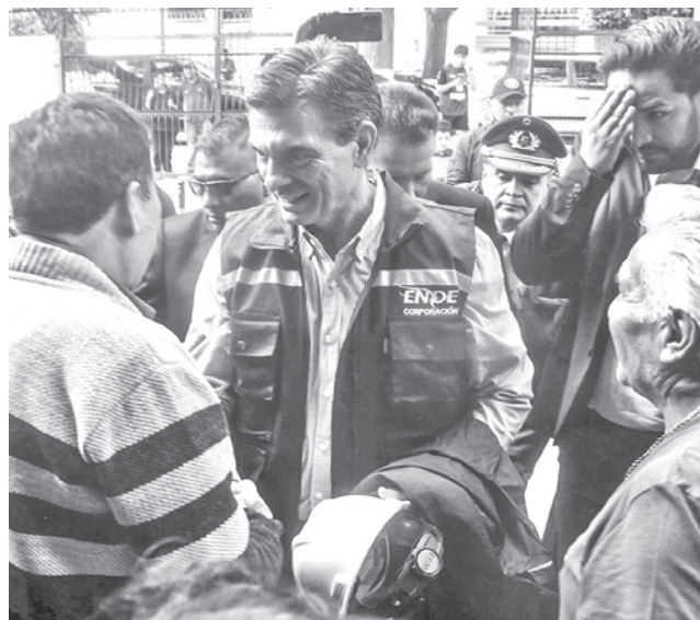
Paz en la reunión con ENDE Corporación.