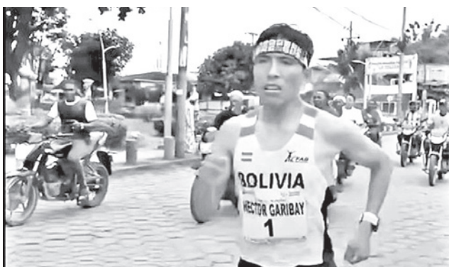
El atleta boliviano Héctor Garibay.

do a destacadas figuras del atletismo nacional e internacional. Con un clima exigente, humedad alta y un recorrido rápido pero técnico, los fondistas ofrecieron un espectáculo vibrante que confirmó el nivel de esta tradicional prueba de 15 kilómetros.