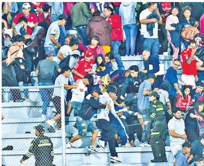
Disturbios de los hinchas en las graderías.