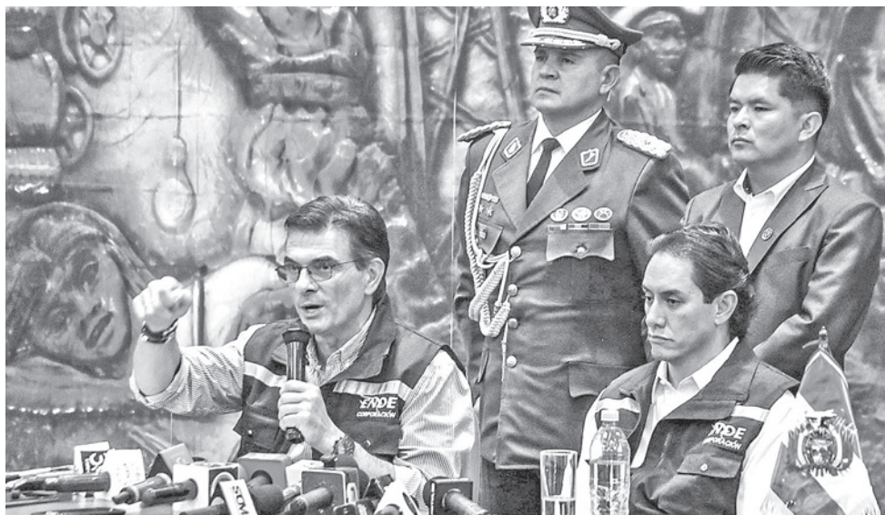
El presidente Rodrigo Paz en ENDE Corporación en Cochabamba.