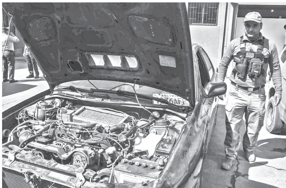
Un operativo policial para el control de motorizados. JOSE ROCHA

“Se va a hacer el seguimiento estricto hasta saber en qué ha derivado y en qué ha terminado este caso. Si se le ha aplicado alguna sanción pe-