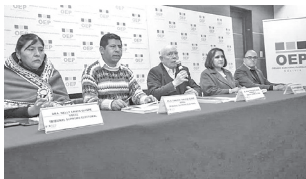
El Tribunal Electoral publicó el calendario. TSE

Después del paro de 72 horas que cumplieron los panificadores federados e independientes por el fin de la harina subvencionada y el pedido de subir el precio del producto, se prevé que a partir de este lunes de normalice la oferta,