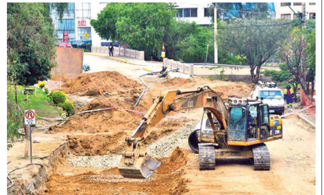
La conexión con un acceso al distribuidor.