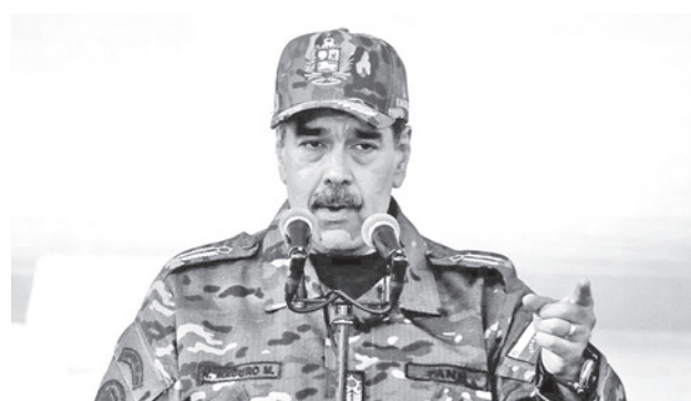
El presidente de Venezuela, Nicolás Maduro.