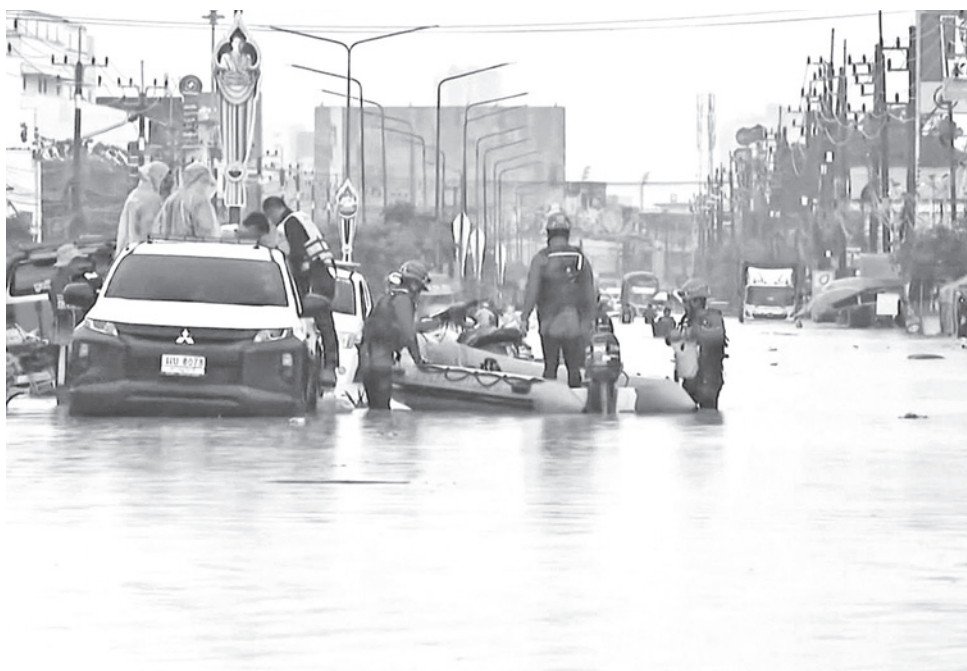
Las inundaciones mortales en Asia, consideradas las peores de los últimos años. CNN

Por su parte, el Centro de Gestión de Catástrofes de Sri Lanka indicó que al menos 212 personas han muerto tras una semana de fuertes lluvias provocadas por el ciclón Ditwah,