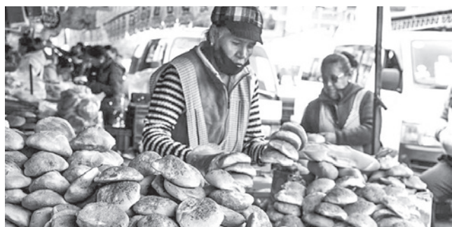
La venta del pan de batalla en Cochabamba. JOSE ROCHA

Oferta. Se prevé que hoy se normalice la venta de este producto de primera necesidad, pero a un precio mayor