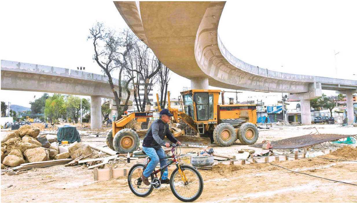
El nivel aéreo del desnivel de las avenidas Perú y Blanco Galindo.