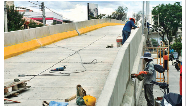
Trabajos en los muros de la obra.