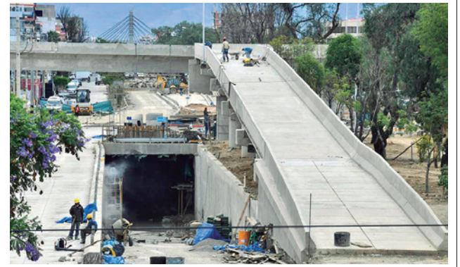
Los tres niveles del distribuidor vehicular.