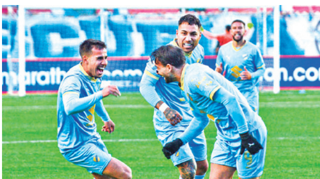
El partido entre Bolívar y The Strongest.

Siles, de La Paz, donde el escenario deportivo albergó a 25 mil personas aproximadamente, quienes no se cansaron de alentar a sus equipos. El cotejo fue válido para la fecha 26 del torneo de todos contra todos.