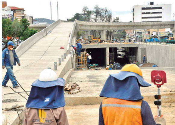
Los tres niveles del distribuidor vehicular.