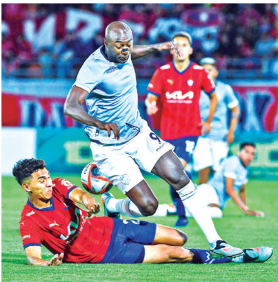
Incidencias del partido, ayer. ADFA

Dominio. El Equipo del Pueblo no tuvo problemas para vencer al Rojo en el clásico 163 jugado en el estadio Félix Capriles y ahora espera sólo el fallo del TAS para zafar del descenso directo