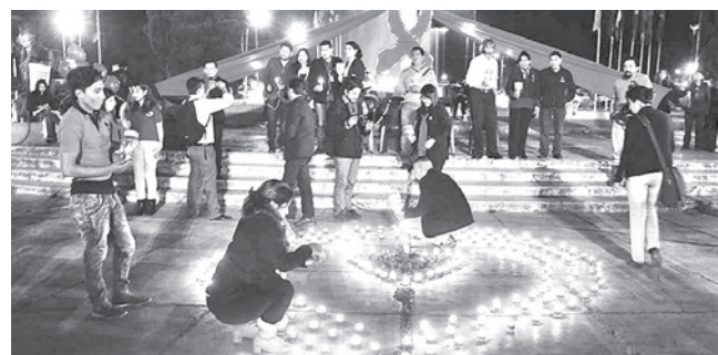
Recuerdan a las víctimas del VIH/sida. HERNAN ANDIA

Salud. La Organización de Naciones Unidas remarca que la falta de recursos deja a los pacientes sin servicios ni anteción