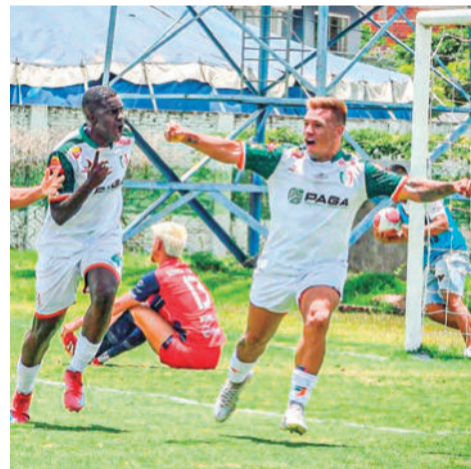
Jugadores de San Juan.