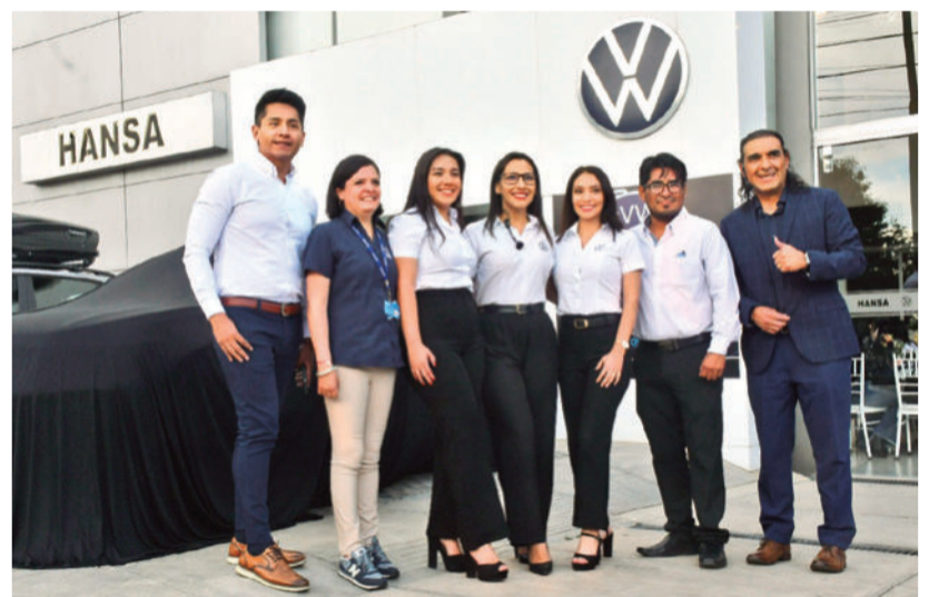
Grupo. El equipo Hansa Cochabamba.

Con esta presentación, Cochabamba se suma a Santa Cruz y La Paz como parte del recorrido de lanzamiento del nuevo Tera, un vehículo que llega para posicionarse como referencia dentro del portafolio SUVW en Bolivia. La marca continuará acercando el modelo a más consumidores del país, en el marco del inicio de una nueva era para Volkswagen y para los usuarios que buscan diseño, conectividad, eficiencia y seguridad en un solo SUV.