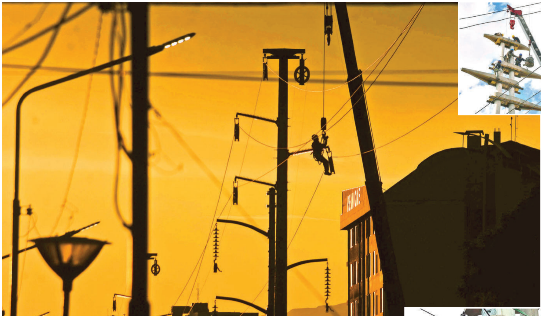
Dos grúas y trabajadores en lo trabajos de la av. Uyuni.