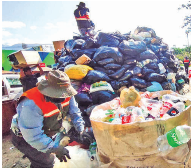
El manejo de los residuos en los puntos de acopio.