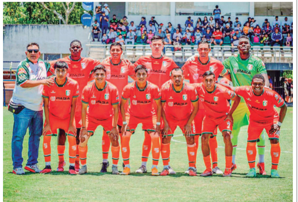
El plantel del Club San Juan de Warnes, el equipo “sorpresa”.