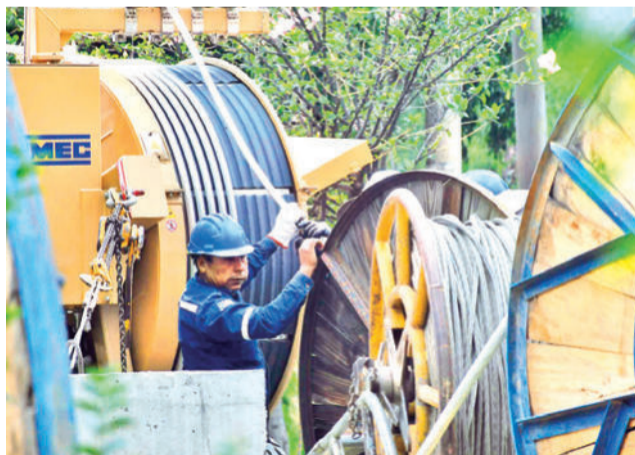
Los rollos de cables que se utilizan en la instalación.

Los trabajadores —según explican algunos de ellos— tienen que cumplir con al menos tres medidas de seguridad. La primera es el uso del arnés, que es el sistema de seguridad que sujeta su cuerpo y los conecta a una línea de vida o anclaje, previniendo caídas. Luego, el aislamiento con un equipo de protección personal (EPP), que evitan un posible choque eléctrico. También usan herramientas y guantes especiales para trabajar con el cableado.