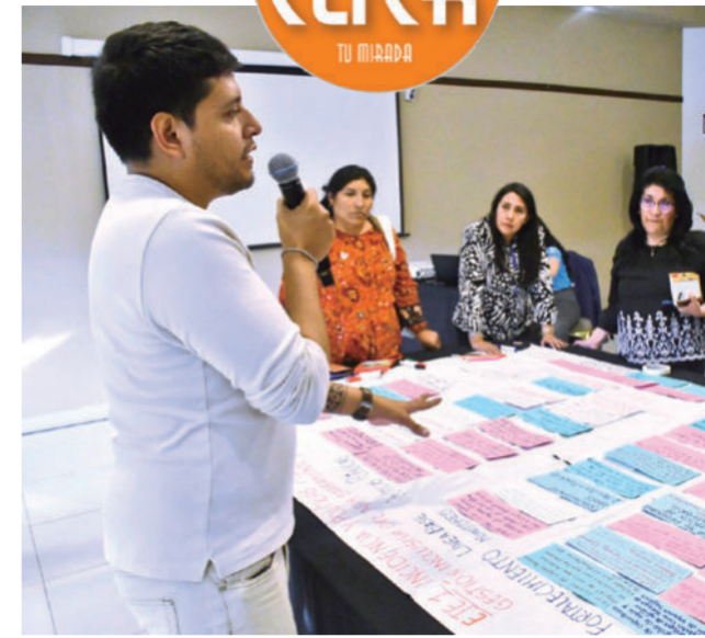
Atención. Mesa de trabajo No 3. Infraestructuras innovadoras, cambio climático y resiliencia comunitaria.