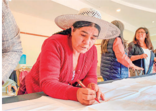
Construcción colectiva. Mujeres trabajaron en tres ejes estratégicos aportando sus ideas, propuestas y percepciones.