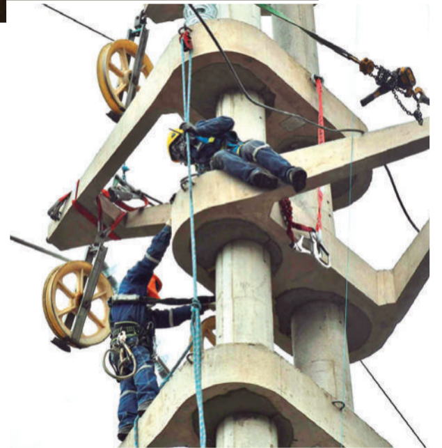
Los 'Spide-Man' bolivianos en un poste con su EPP.

de la Empresa de Luz y Fuerza Eléctrica de Cochabamba (Elfec), Huáscar Medrano, indicó que la empresa cuenta con una licencia ambiental para realizar la instalación de cables de alta tensión de la avenida Uyuni y que el trabajo se coordinó con los vecinos del área de influencia del trabajo.