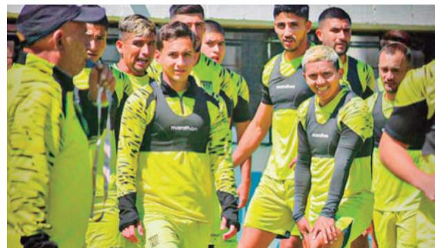
El Tigre se prepara para el clásico. CLUB THE STRONGEST

Con el empate en La Paz, la Selección sumó su primer punto en la tabla del torneo, en tanto que Colombia se mantiene como líder con siete puntos. "Para enfrentar a Bolivia, la Selección Argentina llegará descansada... Vamos a ver los cambios", dijo.