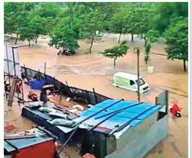
Bajo Llojeta cubierto de lodo, en noviembre de 2024.

des repentinos que destruyen comunidades enteras.