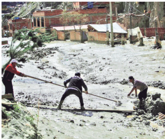
Granizada cubre calles de Bermejo. MANUEL CLAURE