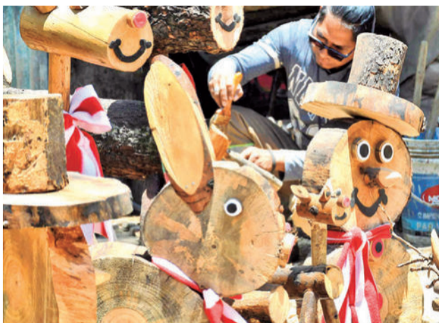
Troncos transformados en conejos, renos y muñecos de nieve.

Según el gerente cada pieza es hecha "con mucho amor y