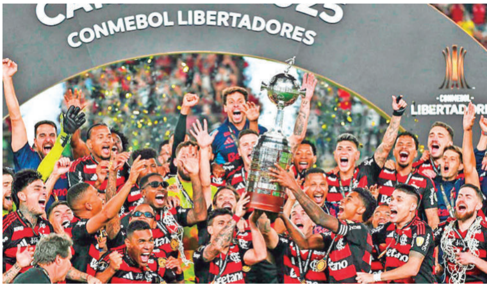
El partido de Flamengo contra Palmeiras, en Lima, ayer.