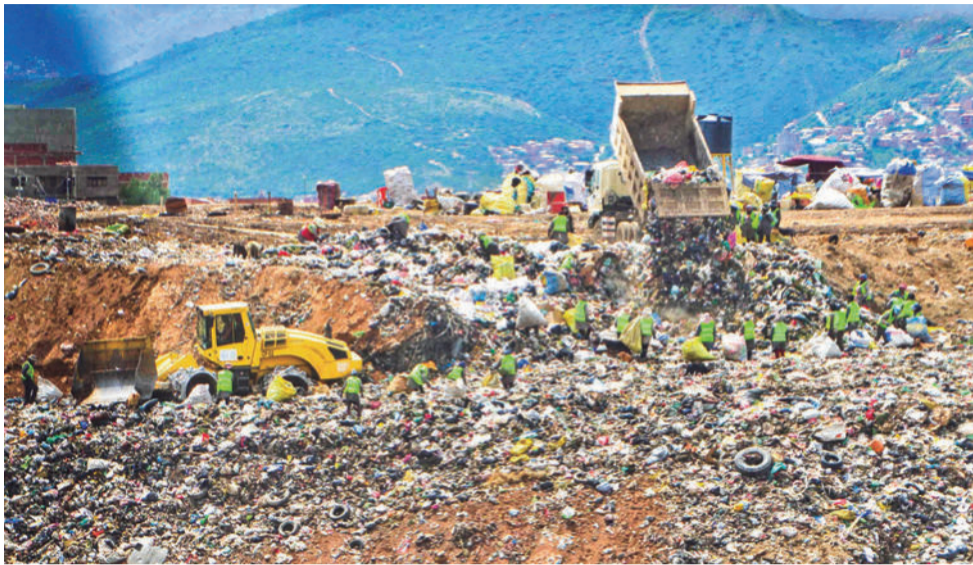
El botadero de K'ara K'ara, ubicado en el extremo sur de la ciudad.