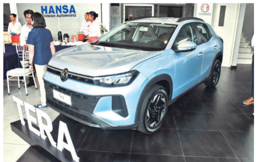
Innovación. El nuevo Volkswagen Tera.