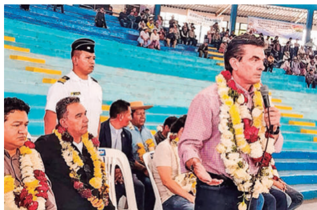
El presidente Rodrigo Paz, ayer.

Desde que asumió el mando del país, dijo que su posición no es por cuestiones polí-