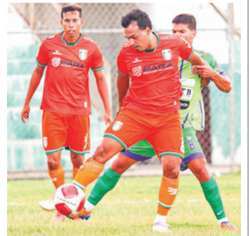
El equipo revelación del torneo.