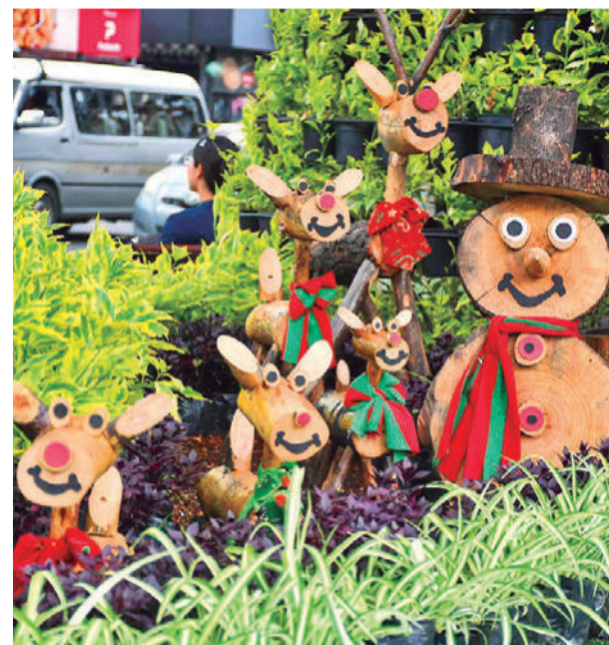
Un pesebre con renos que anuncia la Navidad.

personas interesadas deben ingresar a la página de Facebook de Emavra y en la publicación del concurso deben escribir un mensaje que incluya la frase "ciudad jardín". El comentario con más likes será el ganador de cinco adornos navideños. El plazo vence el 10 de diciembre.