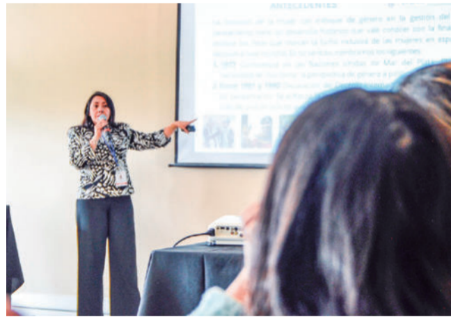
Exposición. La Senadora Wanda Medrano diserta en el encuentro estratégico de mujeres.