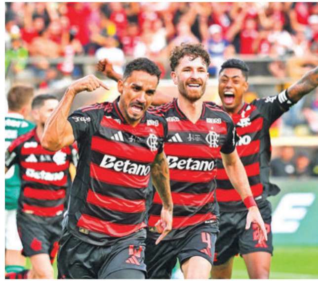
El Flamengo se coronó campeón. CONMEBOL LIBERTADORES