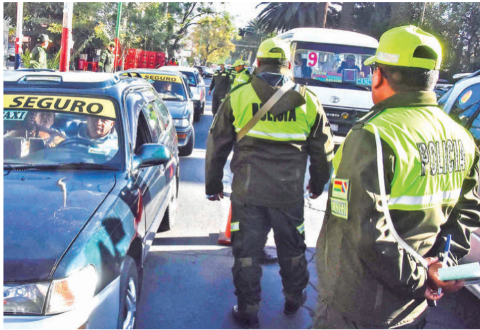
El personal policial durante un servicio rutinario. HERNAN ANDIA

permanecerán activas las Divisiones Departamentales de Comisarías de Tránsito. Asimismo, se implementará una Oficina de Plataforma de Atención