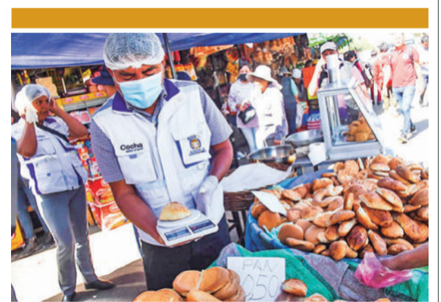
Un control de la venta de pan de batalla.