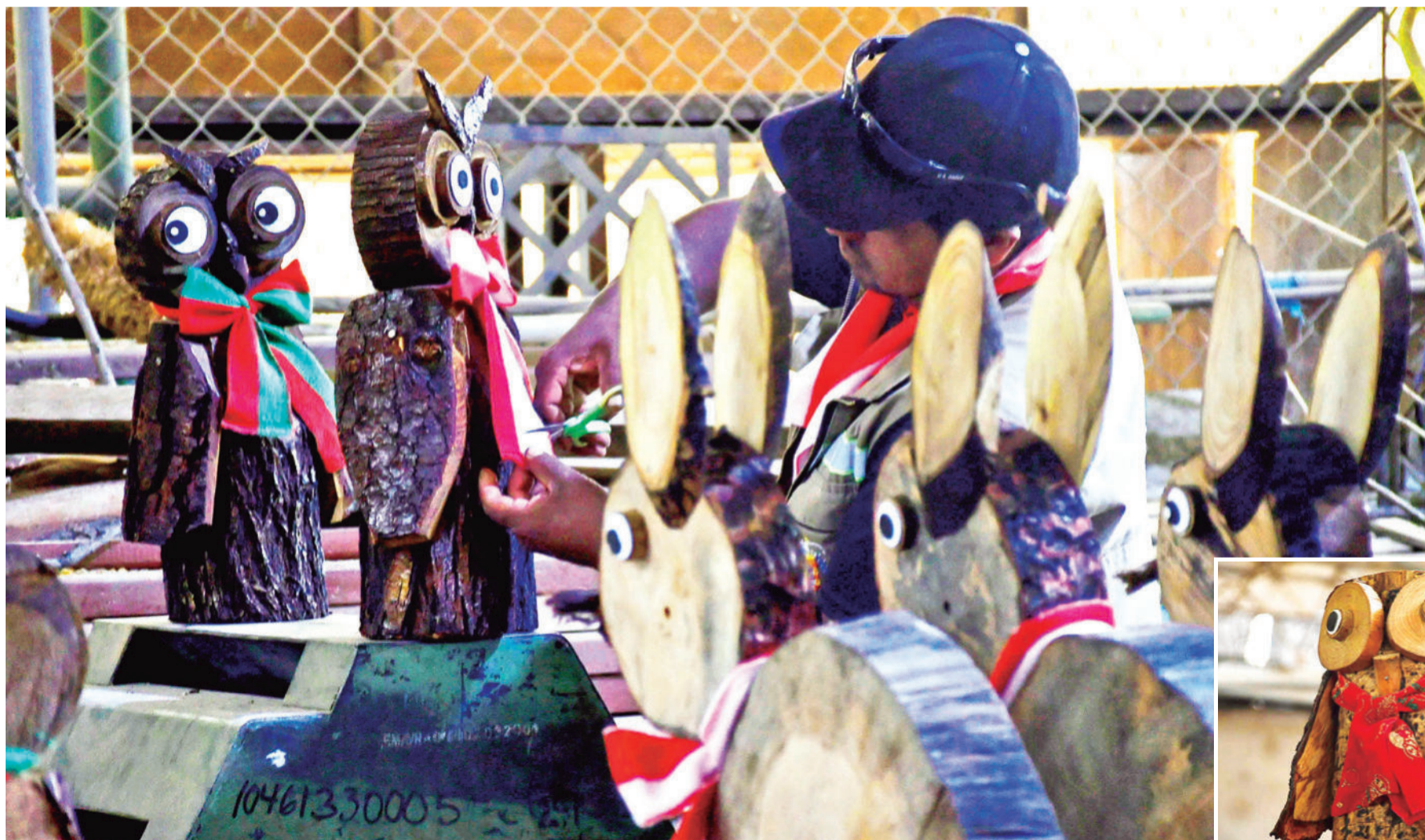
Un búho navideño luce una pañoleta roja.

Los búhos navideños de Emavra, hechos con ramas y troncos reciclados durante el año.