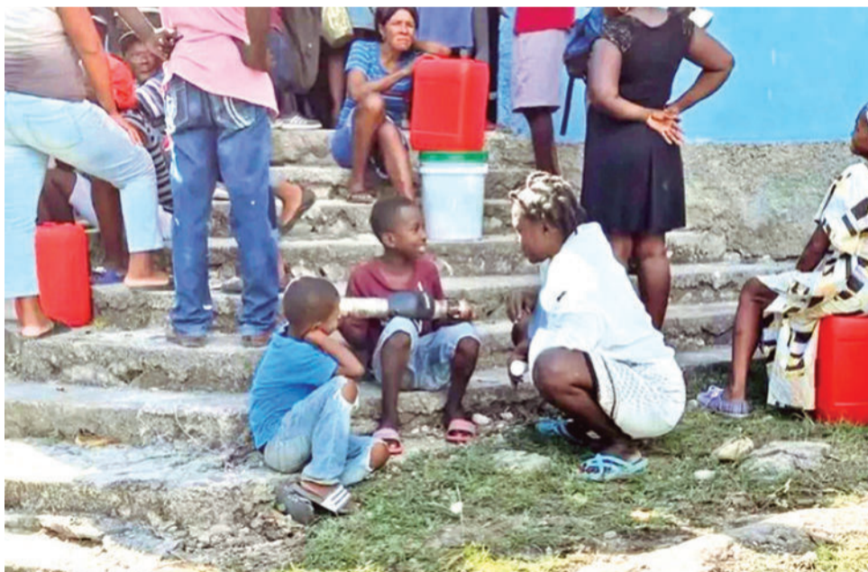
Unos niños esperan por agua, en Haití.

La pobreza socava la salud, el desarrollo y el aprendizaje en la infancia, una situación que reduce las perspectivas laborales y la esperanza de vida, al mismo tiempo que aumenta las tasas de depresión y ansiedad. El informe destaca que los niños y niñas más pequeños, los que tienen discapacidades y los que viven en situaciones de crisis son especialmente vulnerables.