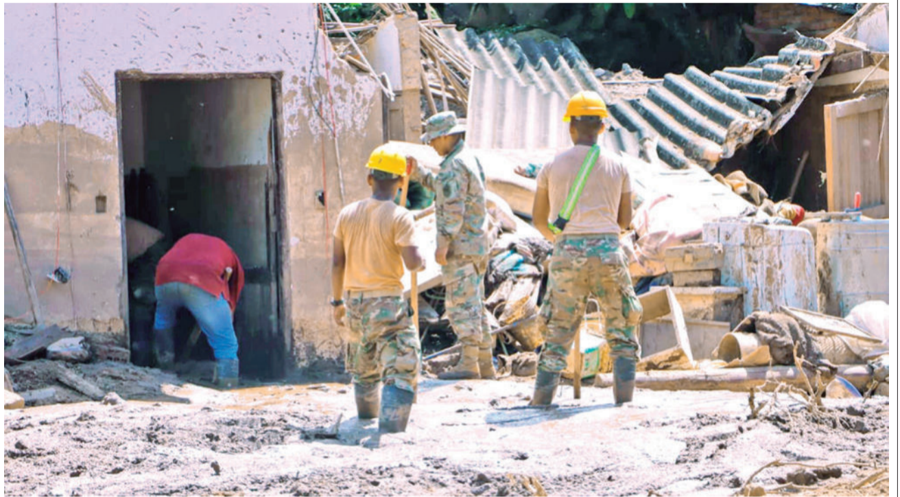
Casas destruidas y llenas de lodo en Achira, en Samaipata.

Zeballos remarcó que Bolivia es uno de los países sudamericanos con mayores índices de pérdida de bosques en los últimos años, impulsada principalmente por la agricultura extensiva y los incendios forestales. La desaparición de cobertura vegetal disminuye la capacidad natural del terreno de infiltrar el agua, aumenta la erosión y favorece desbor-