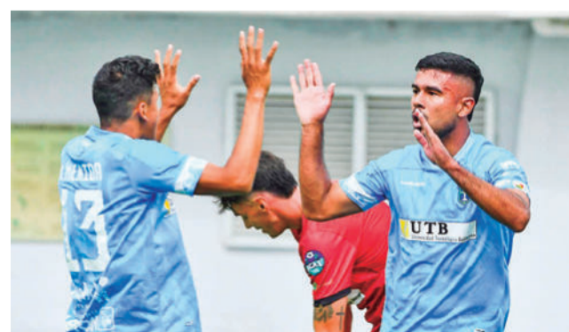
El partido entre San Antonio y FC Universitario. DANIEL JAMES

San Antonio acumuló 37 puntos que le permitió es-