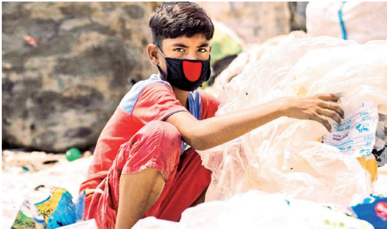
Un niño de 12 años en Dhaka, la capital de Bangladesh, clasifica desechos plásticos.

Sin embargo, hay muchas posibilidades de avanzar hacia la eliminación de la pobreza infantil. Por ejemplo, en Tanzania se logró una reducción de 46 puntos porcentuales en la pobreza infantil multidimen-