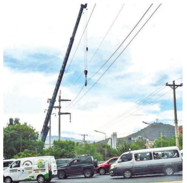
Las grúas para elevar los postes y el material pesado.