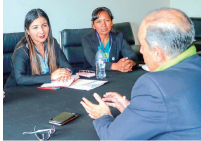
Incidencia. Viviana Mariscal, Viceministra de Recursos Hídricos, Riego, Agua Potable y Saneamiento Básico en reunión estratégica con el equipo de Water For People Bolivia.