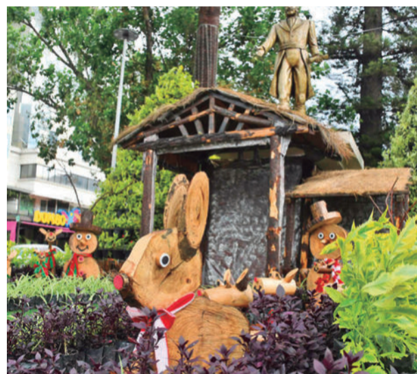
Un decorado de Navidad en El Prado de Cochabamba