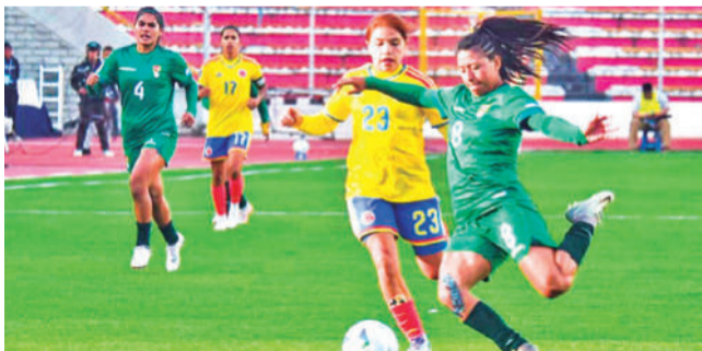
La Selección femenina de fútbol. OP

Victoria. El equipo está bastante motivado tras el empate frente a Colombia, que es favorita para la clasificación del Mundial en 2026