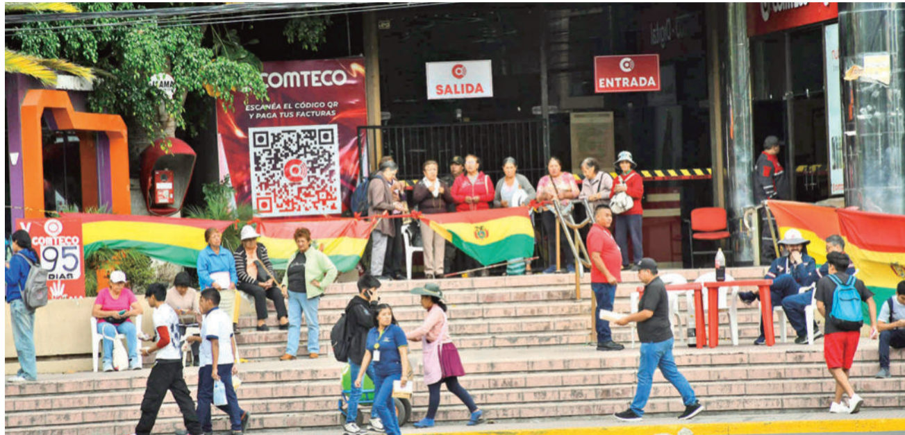
El conflicto en la cooperativa Comteco continúa en Cochabamba.

Torrico, por su parte, negó haber desviado fondos. Asegurando que el retiro de dinero se hizo conforme a los protocolos y que el efectivo se destinó a pagos legítimos: sueldos, impuestos y obligaciones pendientes con proveedores. Incluso, de acuerdo a una entrevista realizada por este diario, dijo contar con actas notariales que respaldaban el saldo existente