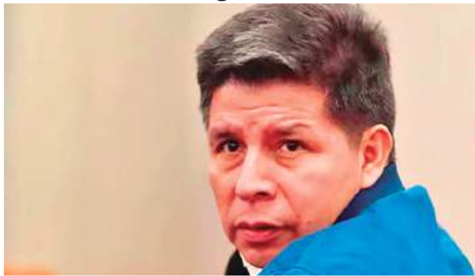
EXMANDATARIO. Pedro Castillo, otro expresidente peruano, que va a la cárcel.

La Sala Penal Especial de la Corte Suprema de Perú condenó al expresidente Pedro Castillo por el delito de conspiración para la rebelión y le impuso 11 años, cinco meses y 15 días de prisión por el golpe de Estado. El tribunal supremo aplicó la misma pena para la expremier Betssy Chávez y el exministro del Interior Willy Huerta.