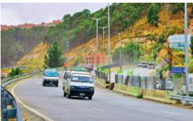
RUTA. Se recomendó transitar con precaución por el sector.

La ABC informó que los trabajos demandaron una inversión aproximada de Bs 2,7 millones e incluyeron la instalación de alcantarillas de hormigón para mejorar el drenaje pluvial, en ese sector de la autopista.