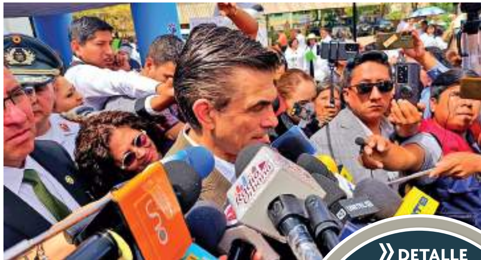
AUTORIDAD. El Primer Mandatario visitó la Llaïta.

“Hay que renovar a las autoridades”, señaló en un contacto con los medios. Destacó que está convenci-