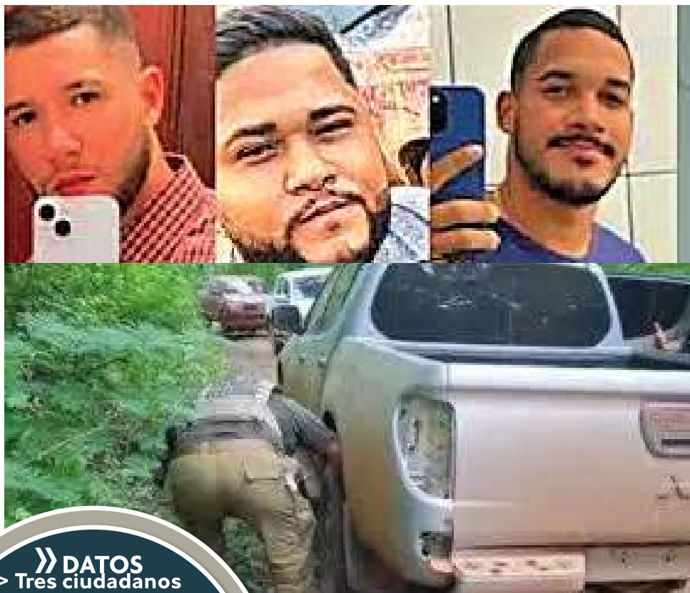
VIOLENCIA. El motorizado en el que viajaron los brasileños y que presumiblemente querían vender.

El vehículo, que iba a ser vendido, era una camioneta de marca Mitsubishi Triton L200, que, según los familiares de las víctimas, no era robada, era legal.