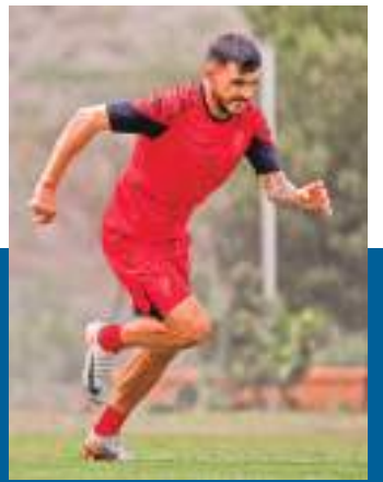
ABB-ALWAYS READY, UN CHOQUE DE OPUESTOS EN EL ALTO

Para finalizar, mencionó públicamente que “quiero informarles que no todo está mal, vamos a aprobar los estatutos, trabajamos en eso, somos seres humanos, nos equivocamos, pero convocamos a la unidad. Estamos cinco meses, no cinco años, tomamos decisiones, hay obras que se hacen y una planificación que se realiza, porque se ha iniciado procesos a quienes se lo tenía que hacer”.