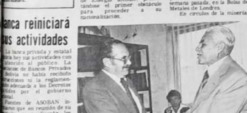
Nuevas autoridades del LAB