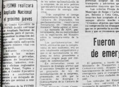
Vecinos de la zona sud piden servicio de transporte

Los dirigentes analizarán las últimas disposiciones adoptadas por el gobierno y harán conocer su posición. Los dirigentes analizarán las últimas disposiciones adoptadas por el gobierno y harán conocer su posición.