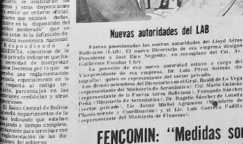
Nuevas autoridades del LAB