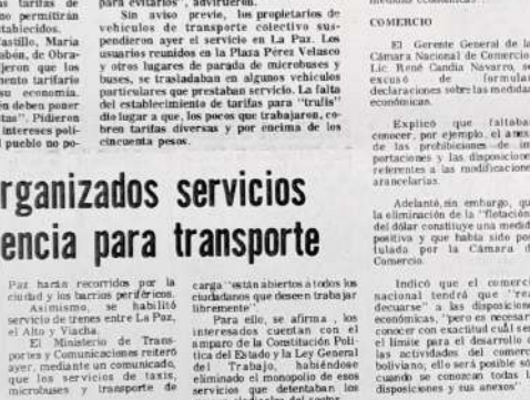
Vecinos de la zona sud piden servicio de transporte