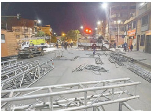
Concierto fue trasladado al Monumento al J'acha Flores

Tras una reunión, se firmó un acuerdo entre los dirigentes de la Morenada Central Cocani y la junta de vecinos para que se tomen los recaudos en cuanto al sonido, la limpieza, seguridad, entre otros aspectos.