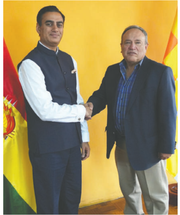
El embajador Rohit Vadhwa (i) junto al ministro de Minería Marco Calderón de la Barca

Se amplió el memorándum de entendimiento en geología y recursos minerales, lo que puede facilitar una mayor colaboración entre ambos países. La agenda incluye aspectos relacionados con inversión y transferencia tecnológica, así como el fortalecimiento del marco normativo para atraer inversiones extranjeras al sector minero boliviano.