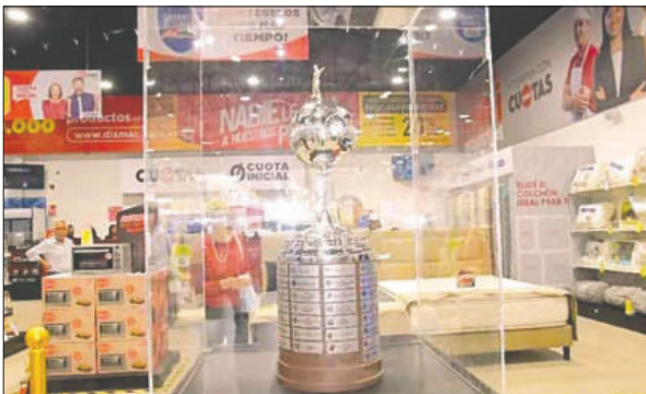
Los bolivianos pudieron observar de cerca el Trofeo de Copa Libertadores

Mientras, Bolívar tuvo mejor fortuna, porque venció a Palestino (Chile), con un acumulado de 6-0, superó a Cienciano (Perú) con un global 4-0 y su techo futbolístico ocurrió cuando estuvo frente a Atlético Mineiro (Brasil) en los octavos de final, donde fue eliminado con un 2-3 en el marcador global. De esta manera finalizó la presencia boliviana en el escenario internacional.