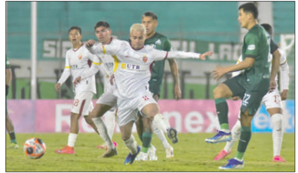
En la ida venció Real Tomayapo en Tarija 3-2 el 20 de junio

rias y la combinación de otros resultados podrá aspirar a un cupo internacional. Por su parte, el cuadro tarijeño llega en mejor situación, instalado en el puesto 11 con 29 puntos, lo que le otorga cierta ventaja en la previa.