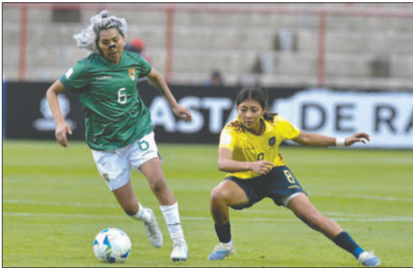
El cuadro boliviano pretende reivindicarse en el torneo internacional

Bolivia será local en el estadio Hernando Siles, contra Ecuador (0-4) jugó en El Alto y con esta modificación, el elenco verde espera un mejor rendimiento, acompañado de una victoria para salir del fondo de la tabla de posiciones y comenzar a pedir la palabra en la pelea por uno de los dos boletos directos o dos de los indirectos para la Copa Mundial Brasil 2027.