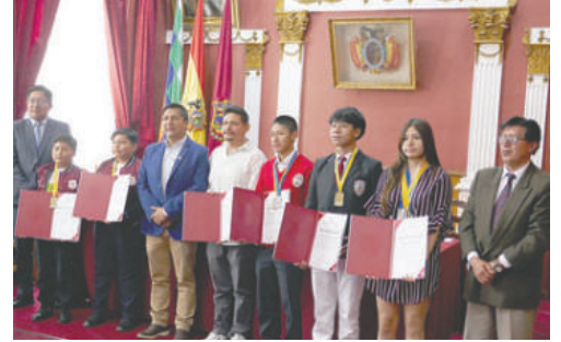
Estudiantes orureños brillaron en la Robomatrix Continental Junior 2025

“Hoy no estamos aquí como una sola persona, estamos como un equipo. Somos cinco jóvenes que, con disciplina, esfuerzo y muchas horas de trabajo