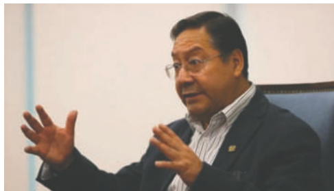
La Fiscalía recibe proposiciones acusatorias que podrían iniciar un juicio de responsabilidades al expresidente y otros exfuncionarios

“Han llegado proposiciones acusatorias para exgobernantes, como también para el expresidente del Estado (Luis Arce) y se van a remitir a la Asamblea Legislativa”, indicó