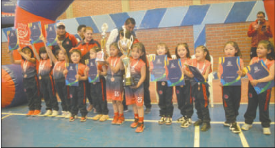
12 de Abril el mejor en baloncesto

También se premió a los jugadores más destacados en cada disciplina, cerrando esta importante competencia infantil.