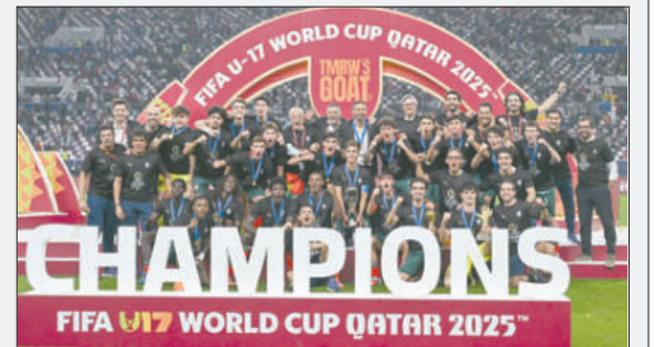
Jugadores de Portugal celebran el título con el trofeo en alto

Cabral, con su gol, lo impidió y coronó a su selección, que hasta el jueves tenía como mayor éxito un tercer puesto en la edición que se disputó en Escocia en 1989.