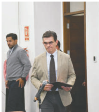
Paz anunció que se reunirá con gremiales, transportistas y otros sectores para explicar la situación económica de Bolivia

El mandatario subrayó que estas reuniones no serán solo informativas,