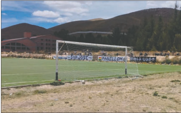
El partido entre San José y AFIZ se reprogramó para la última fecha

"santo" por motivos personales y un viaje urgente a su país. La dirigencia confirmó que ya se cuenta con un nuevo estratega para dirigir al plantel hasta el final de la temporada, aunque no se reveló su nombre. Hinchas y socios de San José, anunciaron además una kermes para este domingo, destinada a recaudar fondos en favor de los jugadores. Se pondrán a la venta más de 300 platos en las calles Montesinos y Backovic desde las 10:00 hasta las 12:00 horas, un esfuerzo comunitario por respaldar al equipo en su lucha por mantener la categoría.