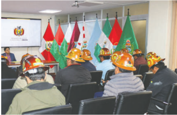
Reunión entre el director de Senarecom y Fencomin para tratar temas mineros