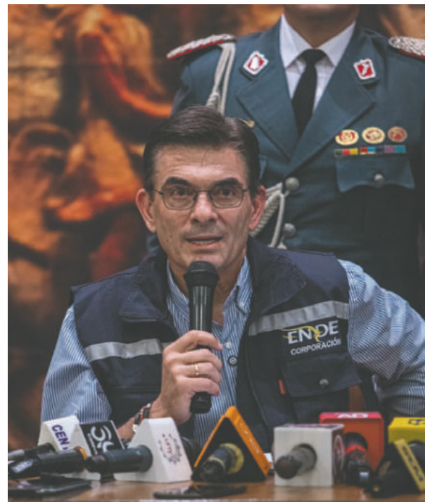
El Presidente de Bolivia, Rodrigo Paz

Durante su intervención, el Presidente Paz valoró el trabajo profesional de los técnicos y trabajadores de ENDE, reconociendo su aporte al funcionamiento de la empresa. Dijo que a partir de la meritocracia y el respeto se sacará adelante a la empresa, no solamente a la matriz, sino también a las diez filiales que tiene.