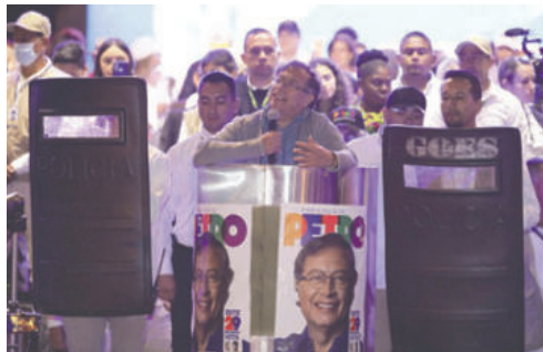
Fotografía de archivo del entonces candidato a la Presidencia de Colombia Gustavo Petro hablando durante el cierre de campaña, en Bogotá (Colombia)

El CNE impuso multas al gerente de campaña Ri-