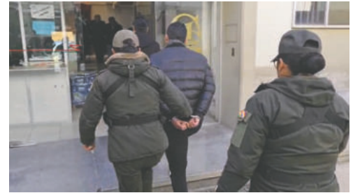
El uniformado fue enviado al penal de San Pedro

Gutiérrez explicó que el sargento investigado, de 35 años, facilitó la cuenta bancaria donde se realizaron los depósitos. Una vez que los afectados enviaban imágenes de los comprobantes, el uniformado verificaba la recepción del dinero y posteriormente transfería los montos a otra persona vinculada con la