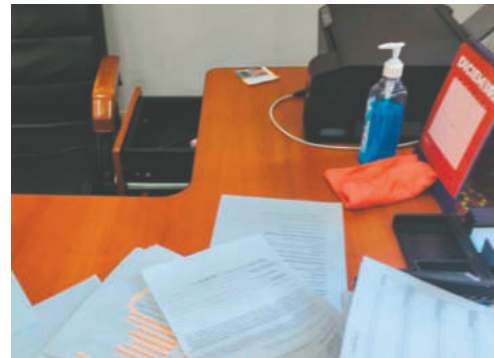
La oficina donde se registró el hurto

El diputado explicó que los documentos hurtados incluían solicitudes de auditoría, información administrativa y antecedentes de fiscalización