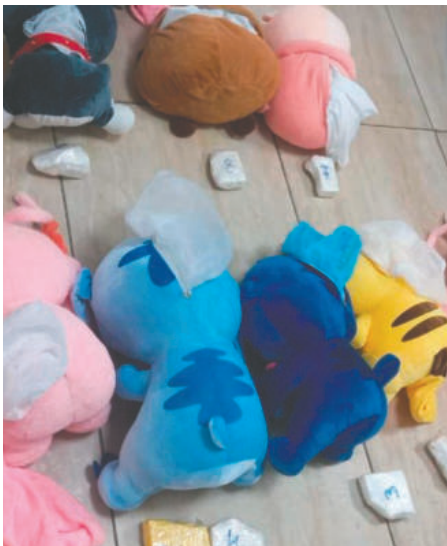
Dentro de los peluches hallaron paquetes con estupefacientes

El peso final de la sustancia incautada fue de 2 kilos y 850 gramos. El Juzgado Federal N.º 1 de Tucumán ordenó de inmediato la detención de la mujer boliviana y dispuso el secuestro de la droga, junto con todos los elementos vinculados a la causa de narcotráfico.