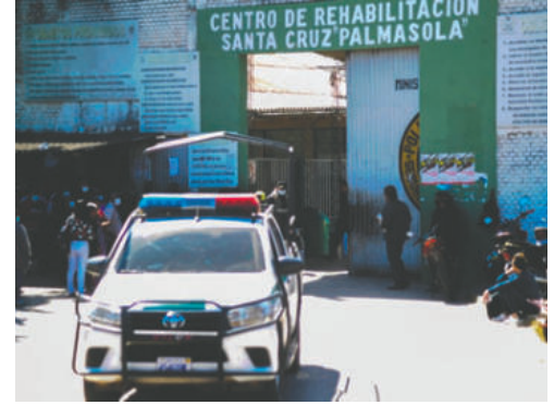
El penal de Palmasola en Santa Cruz

una investigación interna para determinar cómo fue posible que un arma de fuego ingresara al recinto carcelario de máxima seguridad.