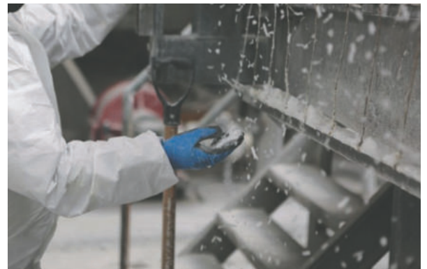
Analizan posibles modificaciones al proyecto de ley del litio presentado hace cuatro años al parlamento /LB

La norma debe establecer con claridad la sede de las empresas e instituciones del litio, los porcentajes de regalías para el departamento y los municipios productores, así como el aporte que debe dejar al país. Este análisis será minucioso y definirá qué suerte debe correr la mencionada norma.