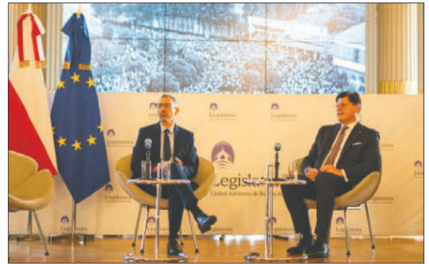
El Foro Económico reunió a representantes de más de treinta empresas polacas interesadas en invertir en Argentina

Respecto al contexto económico actual de Argentina, Pudlowski percibe señales positivas y un impulso de reformas con intención de