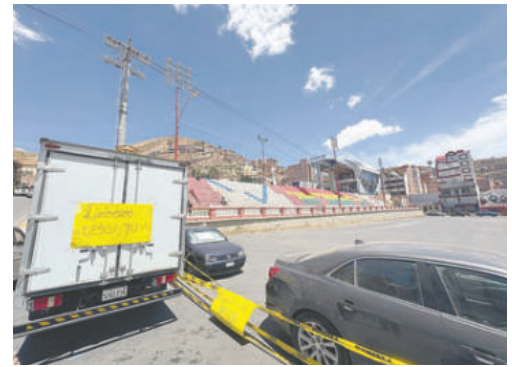
Vecinos bloquearon la Avenida Cívica

Cepeda aseguró que la administración municipal será "la primera en proteger" la nueva categoría de Basílica Menor y que la regulación del espacio es urgente y anunció que se elaborará una normativa específica y que en ese proceso serán convocados