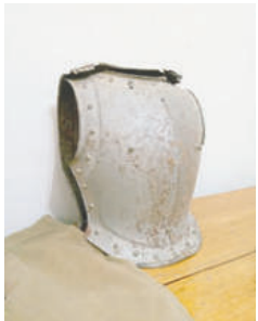
La coraza, una pieza posiblemente española

uniformes y medallas de cartón de la Guerra del Chaco), será puesto a disposición del público.