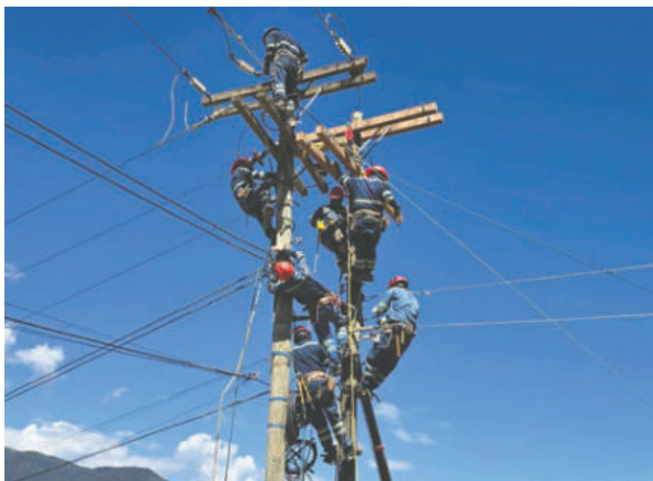
El primer mandatario se reunió con el presidente ejecutivo de ENDE para analizar la situación actual de dicha empresa

Paz subrayó que Bolivia "debe abrirse al mundo" para captar inversiones que permitan forta-