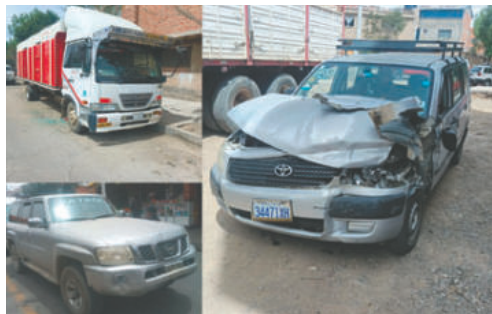
Los motorizados afectados por el accidente vial

Según el informe preliminar del subteniente Roger Colque Mamani, los vehículos involucrados fueron una vagoneta marca Nissan plateada de uso particular, con placa 2992-YEC, conducida por Gregorio M.; un automóvil Toyota plateado con placa 3447-IYH, conduci-