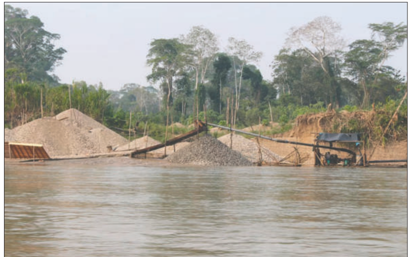
Pese a las advertencias de diferentes sectores empresariales, el Congreso debatirá la aprobación de una nueva ampliación del Reinfo /BAR

Bajo estas condiciones, la minería ilegal ha dejado de ser únicamente un problema ambiental o de orden público para convertirse en una distorsión económica que desafía directamente la sostenibilidad fiscal del Estado y compite con los sectores productivos legalmente constituidos.