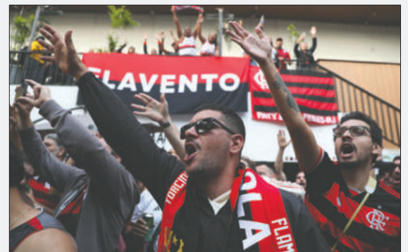
Hinchas del Flamengo en las calles de Lima

En las calles de Lima la presencia de la hinchada rojinegra ya se ha hecho sentir en una ciudad donde afirman sentirse en casa, como ya demostraron con la concentración para recibir al equipo dirigido por Filipe Luís en el hotel de concentración, y también en los puntos más concurridos de la ciudad.