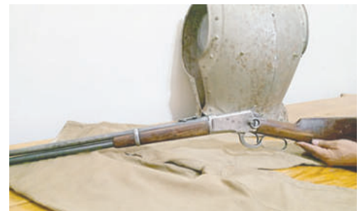
La Carabina de 1892. Un fusil que combatió en la Guerra del Chaco

El material rescatado, más las donaciones de la ciudadanía (incluyendo