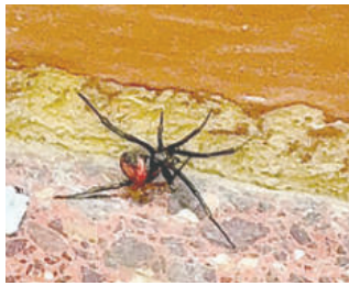
La araña viuda negra que fue hallada en el hall de la Gobernación

Rocha indicó que la presencia de viudas negras en domicilios suele estar relacionada con materiales de construcción o escombros traídos desde espacios baldíos. Ante un ha-