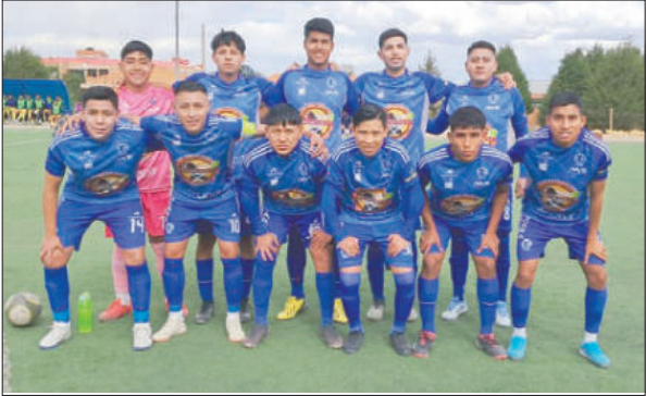
Deportivo Escara va sumando puntos y subiendo en la tabla