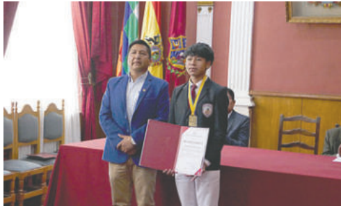
Alcaldía otorgó reconocimientos a estudiantes que destacaron en la competencia mundial de robótica