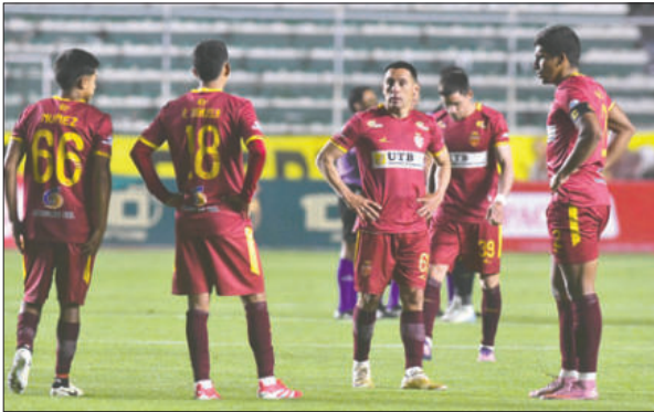
Jugadores de CDT Real Oruro pretenden recuperarse ganando este partido

El panorama no es alentador para el conjunto orureño, que ocupa la casilla 13 en la tabla con 25 unidades. La necesidad de sumar es imperiosa, pues solo con victo-