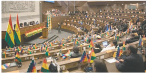
Pleno de la Asamblea Legislativa Plurinacional

El comunicado explicó que la imposibilidad de instalar la sesión llevó a la Presidencia a tomar la determinación. La nueva