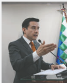
Viceministro de Comercio y Logística Interna Gustavo Serrano