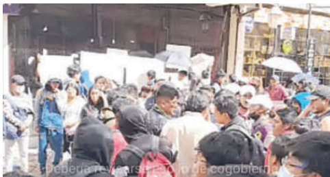
Momentos en el que se retiran los letreros de los vidrios tras el enfrentamiento