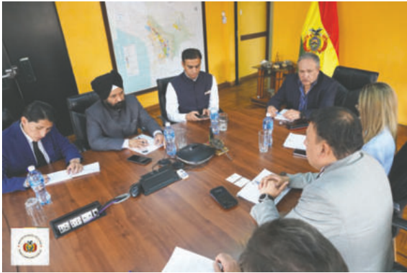
Retoman agenda bilateral enfocada en el sector minero /MMYM