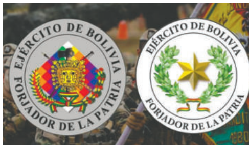
En la izquierda de la imagen la insignia adoptada en 2010, en la derecha la insignia retomada en 2025

El cambio implica la eliminación de la Wiphala, las flores nacionales kantuta y patujú, y las referencias a las armas originarias (hacha incaica, arco y flecha guaraní), que fueron incorporadas a la insignia