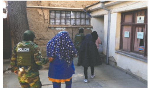
Las tres mujeres aprehendidas

Las tres mujeres fueron trasladadas hasta la instancia jurisdiccional