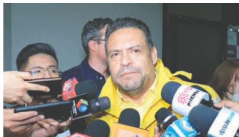
El exalcalde de La Paz llegó al país con su familia y se declara inocente de las acusaciones que enfrenta

Revilla expresó que fue víctima de injusticia, mentiras, odio y maldad, ya que los casos en su contra fueron para dañarlo; sin embargo, dichas acciones hicieron que ahora estén “más unidos” y que a