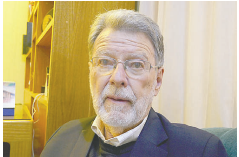
Jaime Villalobos, geólogo y exministro de Minería

Aclaró que no se está en contra de las cooperativas, pero preocupa la forma como trabajan; por ello, a través del libro se plantea una propuesta de una ley de minería, un nuevo código de minería que genere seguridad jurídica, estado de derecho, competitividad y que pueda atraer inversiones extranjeras de buena calidad para desarrollar los yacimientos.