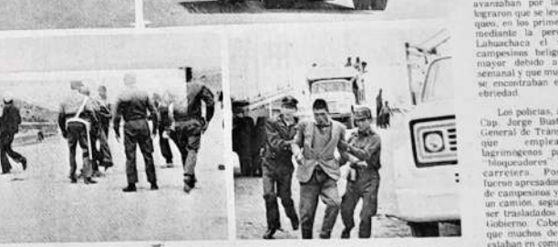
HECHO EN DESPEJADO. La composición gráfica muestra cuatro aspectos del bloqueo y despeje en la carretera La Paz-Oruro. Arriba, a la izquierda, las piedras colocadas por los campesinos. A la derecha, efectivos trasladados a la zona del bloqueo. Abajo, a la izquierda los mismos campesinos rebeldes las piedras que habían colocado en la carretera y, a la derecha, uno de los campesinos que fue detenido por la Policía.

Una fuerza policial de aproximadamente 30 miembros rompió ayer el bloqueo que efectuaron grupos de campesinos en tres diferentes puntos de la carretera La Paz a Oruro. Según datos proporcionados por autoridades policiales campesinos de doce comunidades, desde las primeras horas de la mañana, colocaron piedras a lo ancho de la carretera. Lo hicieron primero en las cercanías de Ayo Ayo, posteriormente en Chijimi y finalmente en Machaca, distante a 131 kilómetros de La Paz.