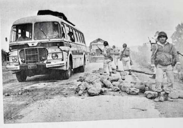
CAMINO EXPEDITO. Patrullas militares observan el paso de vehículos que estuvieron detenidos desde el pasado viernes. Una sección combinada del Ejército y la Fuerza Aérea despejó todos los bloqueos efectuados por campesinos en las carreteras que conducen a Cochabamba.

Policía despejó bloqueo en camino La Paz-Oruro