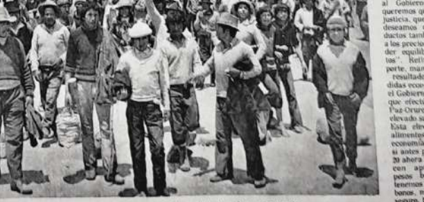
TRANSITO REANUDADO. Dos aspectos de la reanudación de tránsito en las carreteras que confluyen a Cochabamba. A la izquierda, vehículos que retienen su viaje después de cinco días de interrupción. A la derecha, pasajeros que se confunden con campesinos y curiosos al levantarse el bloqueo.

PRESENCIA , en conversación con los campesinos pudo establecer que ellos habían adoptado esta extrema medida como protesta por las recientes medidas económicas dictadas por el Gobierno y el alza del costo de transporte. Se preguntaban por qué solamente tenían que subir de precio los alimentos, que los alimentos que ellos producen, a nosotros se nos cargaba a vender nuestra producción al precio antiguo, pero se nos vende a los nuevos precios" decían.