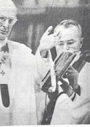
CANIZADA. Vaticano, 27 (AP). La monja española Teresa de Jesús Jorner e Ivars, fundadora de "Las Hermanitas de los Asocialos desamparados", fue canonizada hoy en la Basílica de San Pedro. La presencia de personalidades españolas hizo de la canonización.

BUENOS AIRES, 27 (AP). El Presidente Juan D. Perón... reanuda personalmente con los gobernadores de todas las provincias para impartirles instrucciones precisas acerca de una campaña nacional destinada a "desterrar" a los terroristas, según se informó en una conferencia oficial. Mientras tanto la ola de violencia en el país no tiende a cesar. Ayer estallaron 22 bombas en distintos puntos y una persona resultó herida de gravedad. Las autoridades investigaban las amenazas de atentados perpetrados principalmente contra locales de la radicalizada juventud peronista. El movimiento "botánico" que se reproduce los puntos de vista de la juventud socialista, seriamente afectado por las renuncias de ocho diputados de su sector, destituyó a los autores de los atentados al exigir penalización. En uno de los atentados, según informó la policía, fue arrojado una granada antidive contra el local del sindicato de empleados de gas destrozado. La explosión causó importantes destrucciones. El Presidente Perón, y los ministros militares, han formulado serias advertencias contra los terroristas, pidiendo que cesen de sus actividades. "Ejército Revolucionario del Pueblo" (ERP), que hace una semana