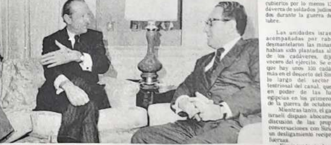
DELEGADO. Nueva York 27 (AP). El Secretario de Estado, Henry Kissinger, derecha, durante una entrevista con el Secretario General de las Naciones Unidas, Kurt Waldheim, centro, en la suite que ocupa el embajador norteamericano ante el organismo mundial. Kissinger dijo con autoridad a la reunión que estaba "moderadamente optimista" acerca de la posibilidad de que Israel y Siria conversaran para la separación de sus fuerzas.

meridional de esa vía acuática. Tanto la ciudad de Suez como el tercer ejército egipcio, estacionado en la margen oriental, estaban asediados desde que la guerra terminó hace tres meses. Un vocero militar dijo que la totalidad de las fuerzas de ocupación israelíes deben desalojar la zona de Suez antes de mañana a mediodía. El repliegue de Israel significa el retorno a la normalidad por los 15.000 civiles de Suez y la posibilidad de evacuar a hospitales castrados a unos 300 árabes heridos. Las tropas de Israel comenzaron también a retirarse de sus líneas frente al tercer ejército. El mando militar dijo que el retiro, 13 kilómetros hacia el este, de sus posiciones en el Sinaí, debía comenzar dentro de varios días. Pero fue adelantado cuando el tercer ejército se negó a reducir sus fuerzas a menos que los israelíes ingresaran otro tanto.