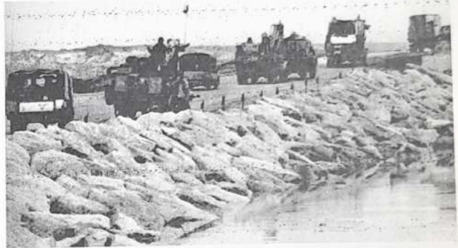
RETIRO. Tal Aviz 27 (AP). Vehículos militares israelíes atraviesan un puente sobre el Canal de Suez, al retirarse de la margen occidental.