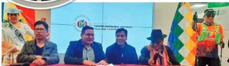
CONFERENCIA. Dirigentes y autoridades de Sorata en la presentación oficial de la prueba.