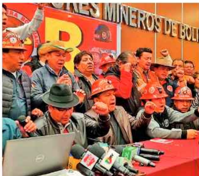
CONFERENCIA: LA COB realizó un ampliado en La Paz.