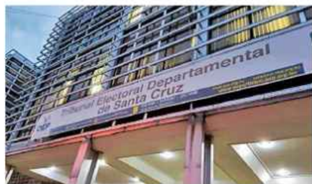
DATO: La Sala Plena se reunió ayer en la capital cruceña.

El Tribunal Supremo Electoral (TSE), reunido en Sala Plena en Santa Cruz de la Sierra, aprobó ayer el calendario electoral de las elecciones subnacionales, que se realizarán el 22 de marzo de 2026.