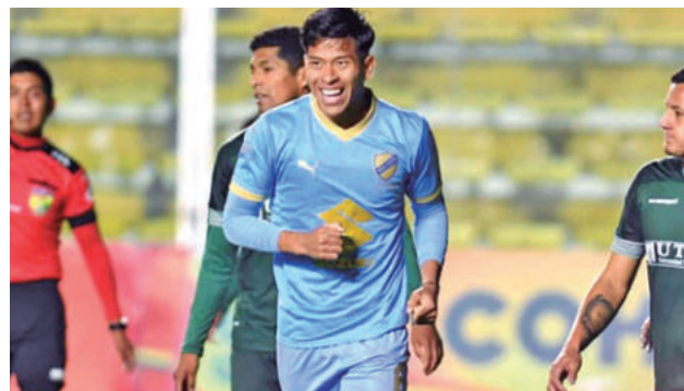
El festejo de Bolívar al vencer a San Antonio.

El equipo nacional ha destacado en anteriores presentaciones internacionales, es uno de los representativos que más triunfos logró en el exterior. Consiguió el cuarto lugar en la II Copa América de 2022 en Lima, Perú, donde logró victorias importantes ante Perú, Estados Unidos, Canadá y Marruecos.