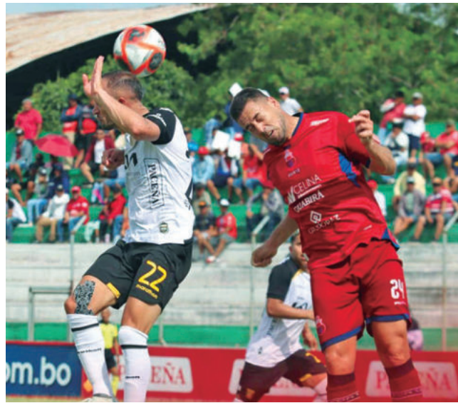
El duelo entre los equipos para clasificar.

Remontada. Guabirá le ganó a The Strongest en los 90 minutos por 3-2, por lo que igualó el marcador global (4-4) y se tuvieron que ir a la definición en los penales