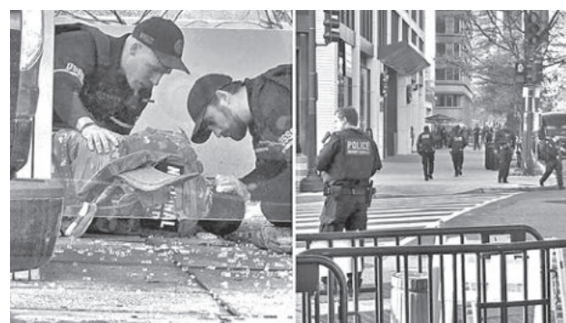
Imágenes de la balacera cerca de la Casa Blanca, en Washington, Estados Unidos.

De momento se desconoce la causa del fuego.