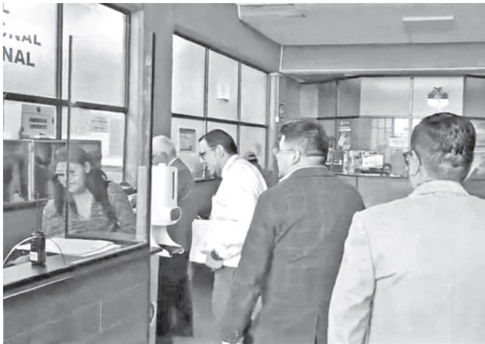
Fiscalía allana las instalaciones del TCP, en Sucre, ayer.

reestructurar el TCP, adelantó que habrá auditorías internas para conocer el estado real del TCP y habrá transparencia en el sorteo de causas que llegan al máximo tribunal, que volverá a ser público.