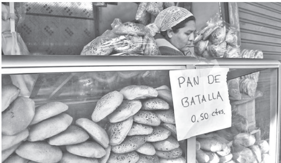
La oferta del pan de batalla en los mercados de Cochabamba. CARLOS LÓPEZ

Criticó la actitud del nuevo Gobierno de no dar soluciones a este tema y, por el contrario, reunirse con otros dirigentes que considera ilegítimos. El nuevo precio implica un incremento significativo respecto a los 50 centavos que valía el pan subvencionado. Ríos aseveró que los 80 centa-