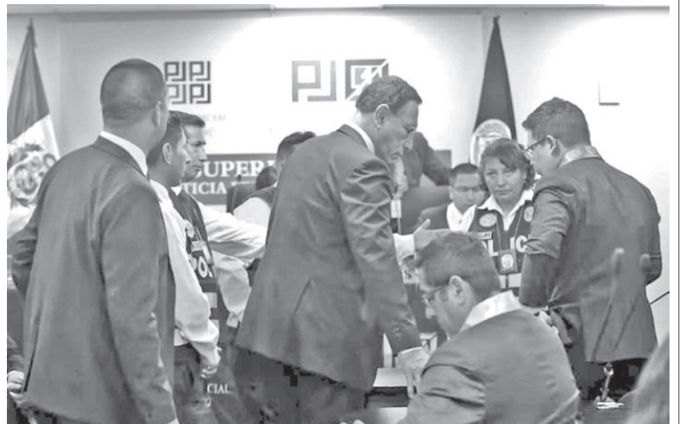
Momento exacto en el que Martín Vizcarra es detenido por la policial para ser llevado al penal a fin de cumplir su condena.

El Poder Judicial condenó a Martín Vizcarra por dos casos. El primero es denominado Lomas de Ilo, el cual inició el 16 de octubre del 2020,