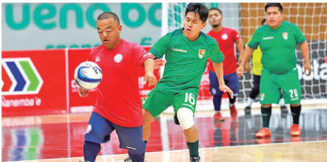
Una incidencia del partido jugado ayer. COPA AMERICA TB

Dato. El equipo nacional ha destacado en anteriores presentaciones y ha dejado en alto el nombre del país