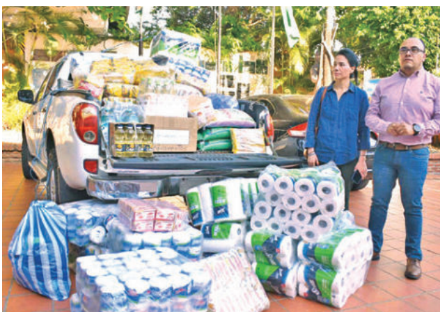
Unicef entrega material a niños en Achira.