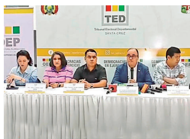
Sala plena del Tribunal Supremo Electoral. TSE

En las elecciones subnacionales del 22 de marzo