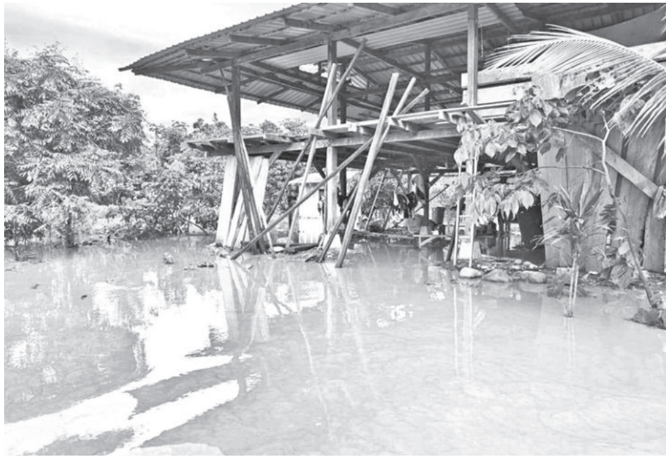
Casas inundadas en el municipio de Chimore, en el trópico. GAMCH

Agregó que las intensas lluvias que se registraron, durante los últimos diez días, afectaron principalmente a la zona del trópico de Cochabamba donde el gobernador Humberto Sánchez inspec-