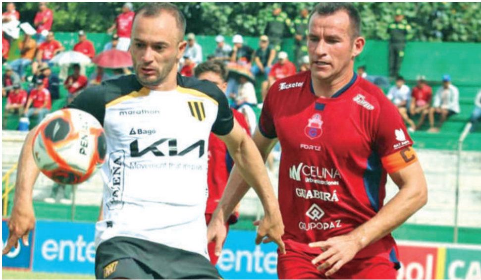
Incidencias del partido entre El Tigre y Guabirá.