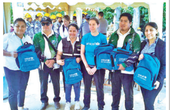
Vocales del TSE dejan ayuda para Achira.