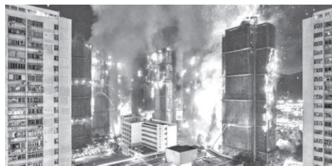
El incendio en el complejo residencial en Hong Kong.

Tragedia. El complejo consta de ocho bloques con casi 2.000 apartamentos que albergaban a unas 4.600 personas.