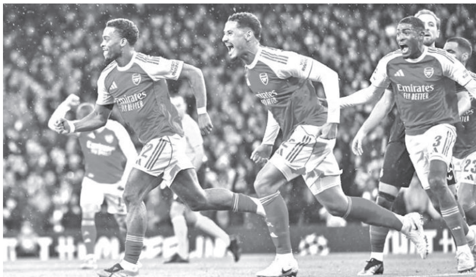
Jugadores del Arsenal uno de los tantos anotados ante el Bayern Múnich, ayer.

Con una prodigiosa segunda parte y un triplete del portugués Vitorino, el PSG se impuso por 5-3 al Tottenham este miércoles en el Parque de los Príncipes en la quinta jornada de la Liga de Campeones de Europa. Los goles fueron de Vitorino (2), Fabián Ruiz y Willian Pacho. Por los ingleses Randal Kolo Muani marcó doblete y Richarlison hizo otro. La victoria permite al campeón defensor sumar 12 puntos y ascender a la se-