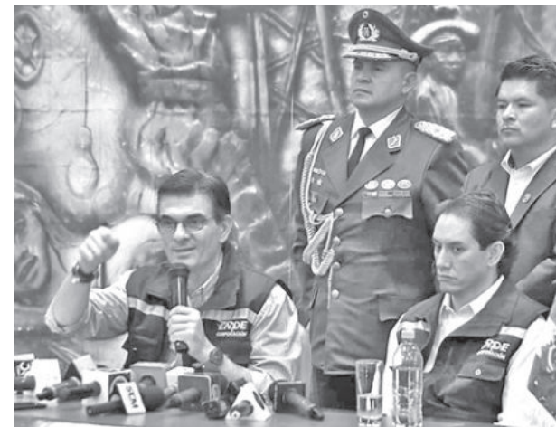
El presidente Rodrigo Paz. JOSE ROCHA

El Impuesto a las Grandes Fortunas fue creado en el Gobierno de Luis Arce, para cobrar alcótuas de entre 1,4% y 2,4% a quienes tengan más de 30 millones de bolivianos.