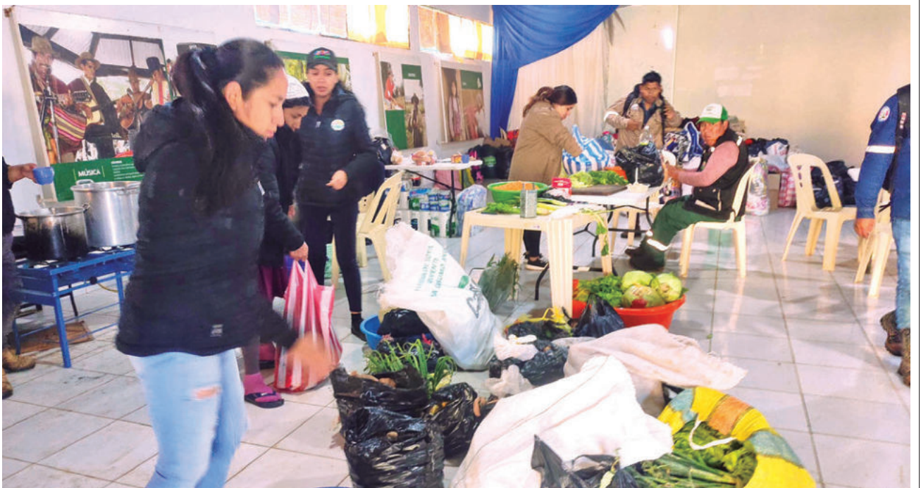
Entregan víveres para la olla común instalada en Achira. GAMC

El Senamhi emitió una alerta naranja por lluvias y posibles desbordes en La Paz, Cochabamba, Santa Cruz, Beni y Pando.