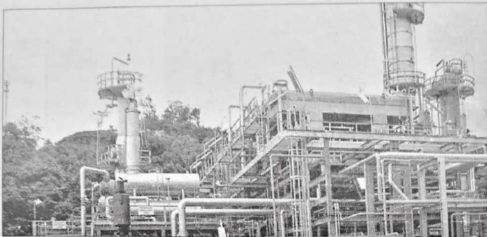
GASODUCTO: Bolivia transporta a Brasil 26 millones de metros cúbicos de gas por día

■ El Gobierno pretende incrementar los precios de venta de gas a Brasil y Argentina, y para ello, en las negociaciones, usará como precio de referencia los siete dólares por millar de BTU (unidad térmica británica) con que Chile se abastecerá de LNG (gas natural líquido) de la empresa British Gas.