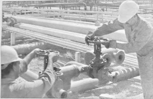
Actividad hidrocarburífera: ductos que transportan el gas natural de Villamontes