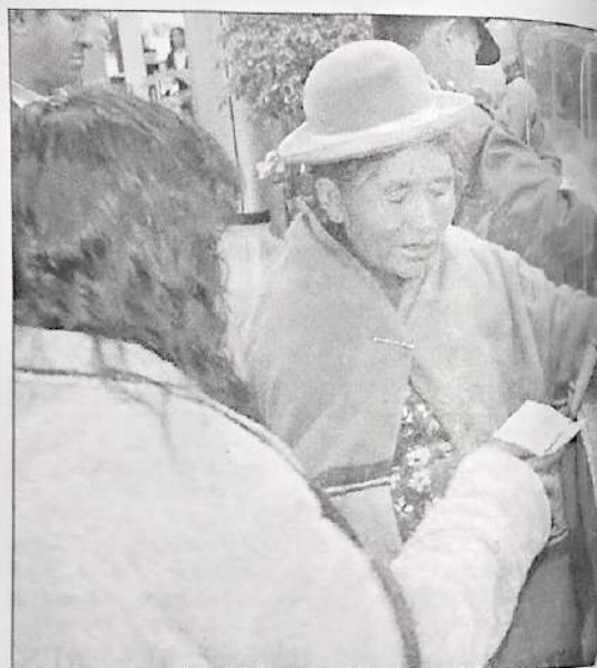
Bonosol: el Presidente garantizó el pago de este beneficio

La nueva norma, en su artículo 6, establece que: "En aplicación a lo dispuesto por el Artículo 6 de la Ley de Hidrocarburos, se transfieren en propiedad a YPFB, a título gratuito, las acciones de los ciudadanos bolivianos que formaban parte del Fondo de Capitalización Colectiva (FCC) en las empresas petroleras capitalizadas Chaco SA, Andina SA y Transredes SA".