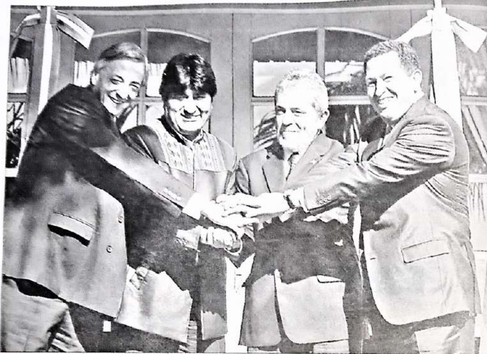
EN PUERTO IGUAZÚ • Kirchner, Morales, Da Silva y Chávez posan para la foto en la localidad argentina.

"La discusión sobre los precios del gas debe darse en un marco racional y equitativo que viabilice los emprendimientos", dice la Declaración de los presidentes. Luego, en una conferencia de prensa conjunta, Da Silva afirmó que "los nuevos precios serán discutidos de la forma más democrática posible. Reconocemos la situación difícil de Bolivia y del presidente Evo Morales. Reconocemos la soberanía de Bolivia sobre sus recursos".