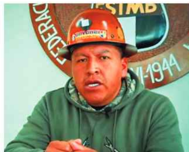
DATO. Mario Argollo, principal dirigente sindical del país.

los trabajadores advierten de que la medida implicaría la pérdida de beneficios sociales, la restricción del derecho a la sindicalización y el debilitamiento de las estructuras sindicales en los sectores energético y petrolero. "No vamos a permitir esa migración, porque se convierte en un atentado contra la estabilidad laboral de los compañeros", dijo Argollo en contacto con los medios.