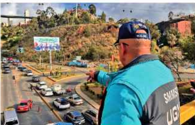
CONSTRUCCIÓN. Trabajos en la avenida La Paz se iniciaron.