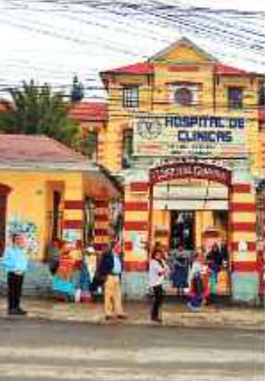
FILAS. Pacientes esperan por una ficha.

Pacientes señalaron que la situación es contradictoria. "En lugar de disminuir el personal, el Hospital de Clínicas requiere aumentar el número de especialistas en neurología para cubrir la demanda y mejorar la calidad del servicio".