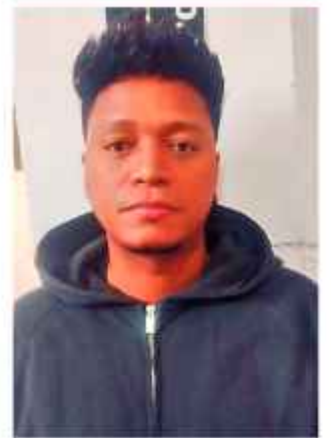
CANTANTE. El artista no cumplió un contrato.

“Se investiga aún la cantidad de dinero robado”, prosiguió la autoridad.