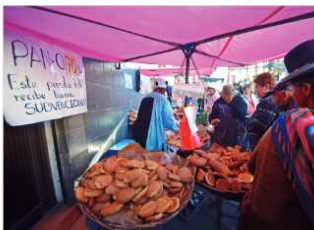
COMERCIO. Venta a pan a Bs 0,70, según un anuncio.

Una de las primeras acciones del Ministerio de Desarrollo Productivo fue intervenir la empresa estatal Emapa, debido a serios indicios de corrupción.