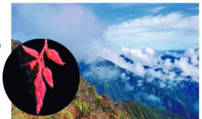
ÚNICA. La draconanthes bicentenaria es un tesoro vivo.

El hallazgo es un estímulo a la ciencia nacional, ya que coloca a Bolivia en el mapa de la investigación mundial, y reafirma que el país tiene científicos competentes y que su vasto territorio es un laboratorio natural invaluable.