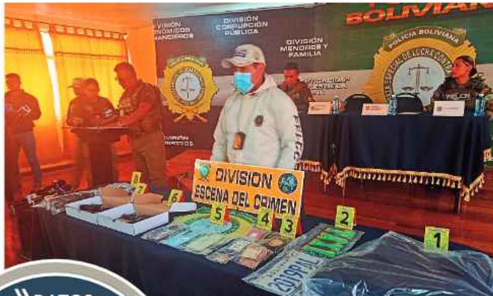
POLICÍA. La FELCC muestra lo secuestrado y que estaba dentro del motorizado, ayer, en conferencia de prensa.

El viernes 21, dos mineros llegaron a la ciudad de La Paz para vender oro. Luego de recibir su dinero, los policías los interceptaron. Según informaron los tres a sus superiores, los mineros iban a ser trasladados a la oficina de la Fuerza Especial de Lucha Contra el Crimen (FELCC) por ser sospechosos de portación de