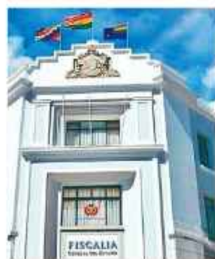
FACHADA. Fiscalía de Sucre.

La Fiscalía de Sucre solicitó ayer a la Dirección General de Migración activar alertas migratorias en contra de los cinco magistrados autoprorrogados del Tribunal Constitucional Plurinacional, quienes aprobaron una resolución que permitió la continuidad "inconstitucional" de sus mandatos.