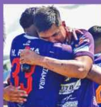
CLASIFICACIÓN. Los jugadores "lilas" celebran.

El representante de San Juan FC se clasificó a la final después de dejar en el camino a Universitario, de Sucre, plantel que perdió la categoría en 2022, el cuadro cruceño le ganó en los choques de ida y vuelta por 3-1 y 2-3. Mientras que Real Potosí logró su pase tras ganarle a Primero de Mayo, de Beni con un marcador global de 3-2, pues ganó 2-0 en la Villa Imperial y perdió 2-1 en Trinidad.