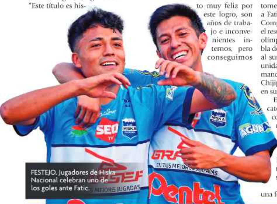
FESTEJO. Jugadores de Hiska Nacional celebran uno de los goles ante Fatic.

> A Hiska Nacional se lo denomina equipo de los lustrabotas porque fue reconocido por tener sus orígenes y estar ligado a este gremio de trabajadores.