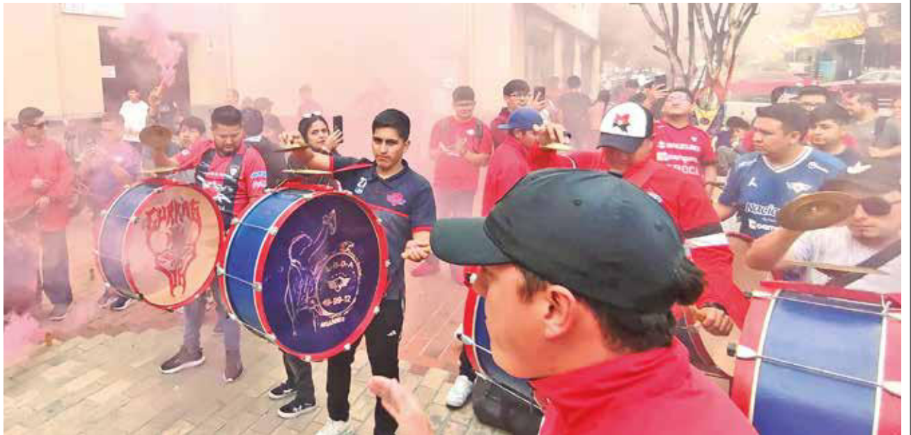
La hinchada del Rojo celebra el 76 aniversario, ayer. DANIEL JAMES

Estaba emocionado, repartió sonrisas y abrazos por doquier. “Wilstermann no está muerto, les va a salir el tiro por la culata a quienes deseaban eso, ya estamos pasando lo peor, de a poco, el club no se merece estar en esta situación, por culpa de algunos señores”, señaló con el rostro serio.