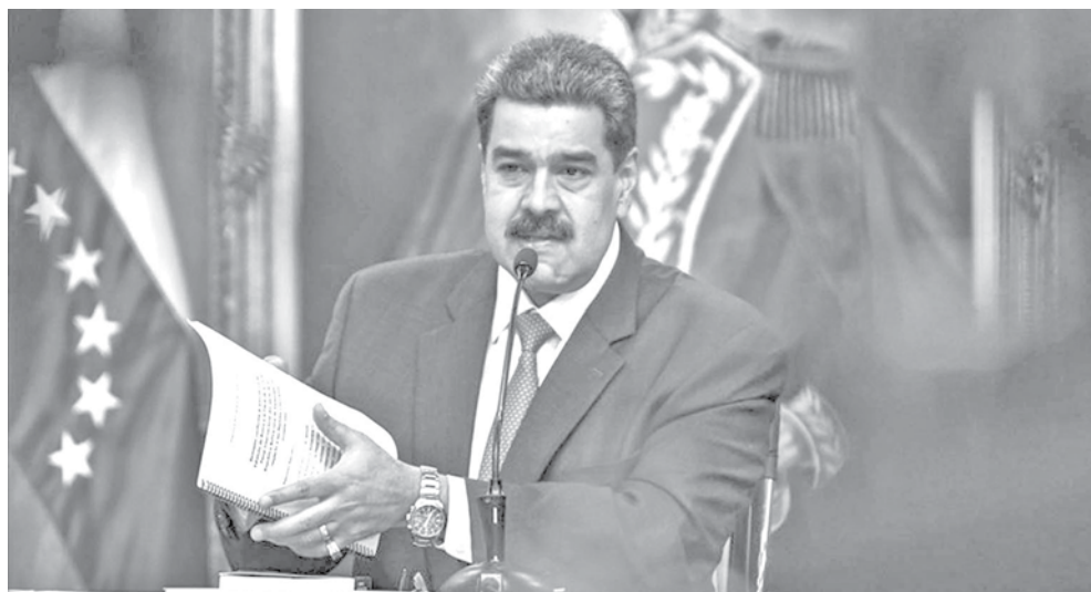
Nicolás Maduro, presidente de Venezuela. AA