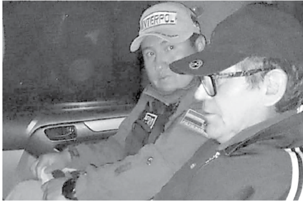
El exjefe de la Felcn, Maximiliano Dávila.

El exjefe policial, actualmente condenado en una corte estadounidense, sostuvo en una entrevista con el programa Fama, Poder y Ganas que esta supuesta presión formaba parte de un “montaje” construido por su defensa pública designada por el Estado norteamericano.