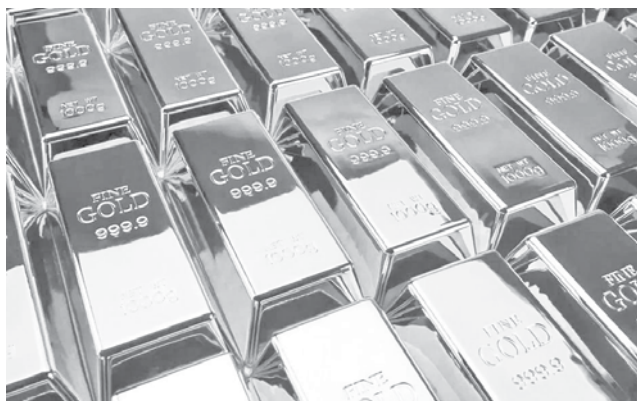
Las barras de oro.

En declaraciones al medio Bloomberg, el ministro de Economía, Gabriel Espinoza, explicó que se mantendrá la