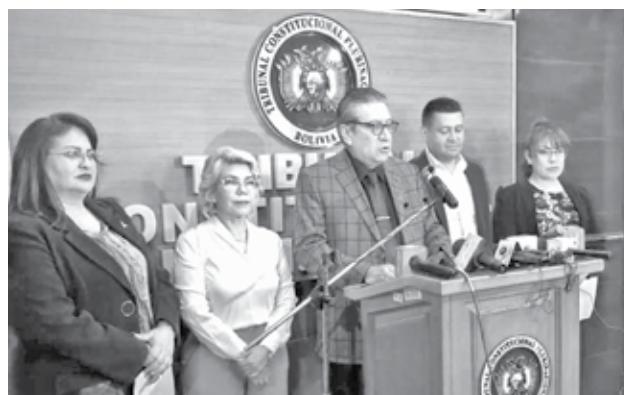
Magistrados autoprorrogados del TCP.