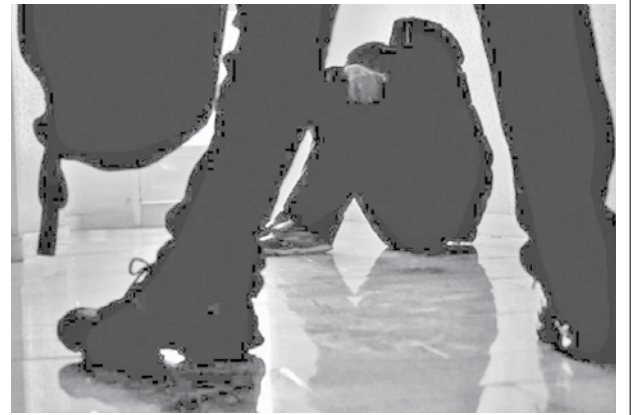
Violencia contra los niños (imagen ilustrativa). RRSS

El presidente de la Cadex, Antonio Flores, señaló que en el caso de robo de ingenios se evidenció que los autores tienen conocimiento sobre qué robar puesto que se dirigen al material más caro y eso les llama la atención, según un reporte de el periódico El Potosí.