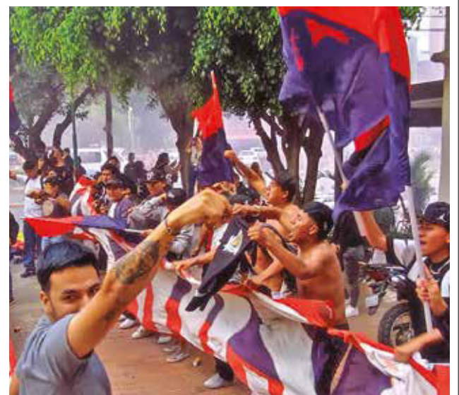
Felices, la barra de Wilstermann.