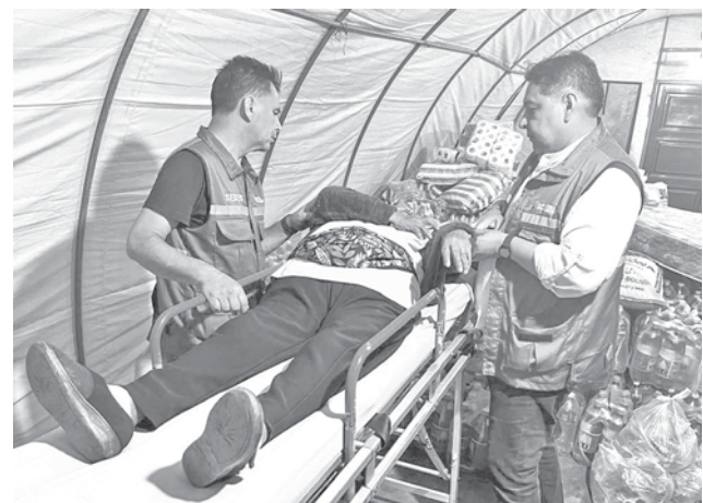
Brigadas médicas asisten en Achira. GADSC