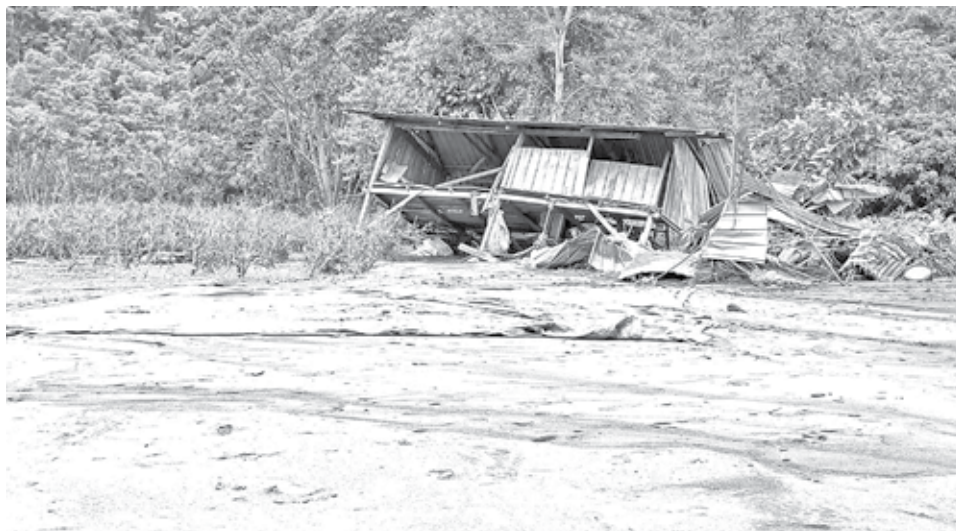
La afectación por las inundaciones en la región del trópico. RADIO KAWSACHUN COCA

del Senamhi, Erick Sossa, informó el pronóstico desde este lunes 24 hasta el jueves 27. Explicó que en la zona andina se prevé un clima frío, con temperaturas mínimas entre 6 y 8 grados y máximas de 15 a 19, además de lluvias suaves.