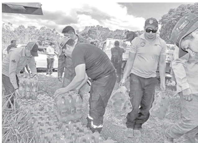
Entregan a damnificados en Yapacaní. GADSC