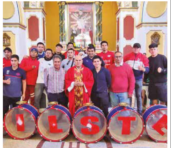
Los directivos y los hinchas en la misa, ayer. DANIEL JAMES