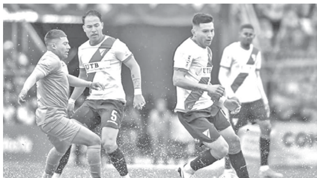
El partido Bolívar y Always Ready, en La Paz. CLUB ALWAYS READY

La anterior semana, en Santa Cruz, los jugadores del equipo celeste cruceño tuvieron que luchar bastante para dar la vuelta al marcador y vencer por el estrecho 2-1 a los orureños.