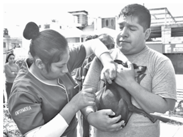
La vacunación contra la rabia. CARLOS LÓPEZ

Castillo destacó que “el municipio de Sipe Sipe ha sido el que más ha respondido”, tras un caso positivo de la semana anterior, lo que activó un trabajo de control.