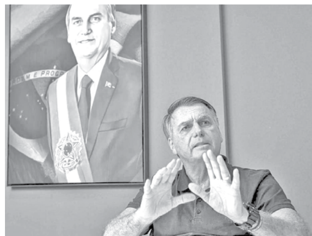
Jair Bolsonaro, ex presidente de Brasil.

A su vez, los jueces Cristiano Zanin y Carmen Lúcia votaron en acompañamiento del relator, sin presentar un voto propio.