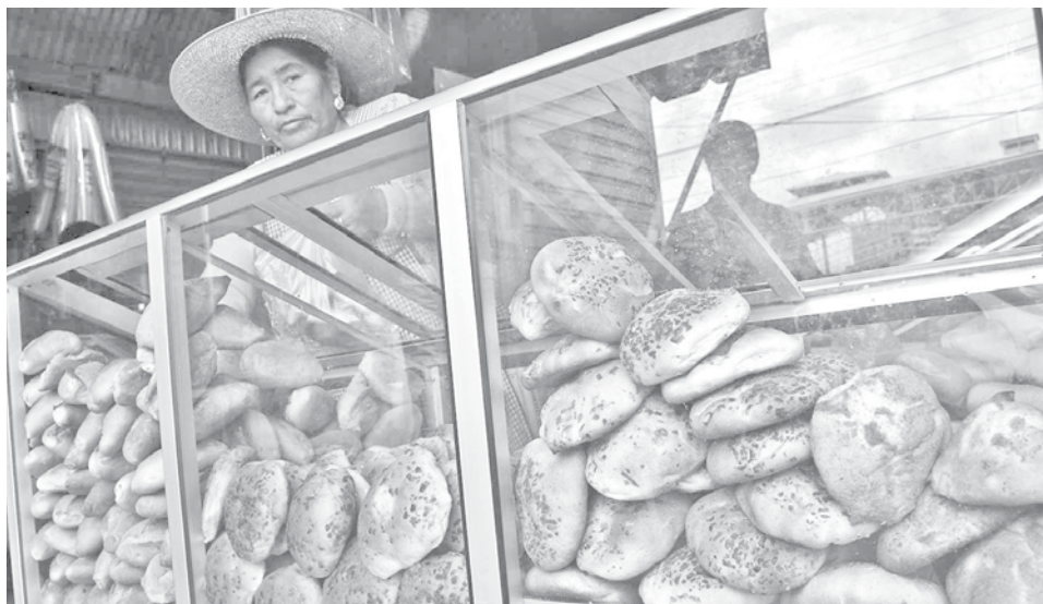
La venta de pan los mercados de Cochabamba. JOSE ROCHA

Mientras tanto, La Paz y El Alto solo cuentan con pan surtido, muchas veces de calidad inferior, ante la inacción de las alcaldías y del Viceministerio de Defensa del Consumidor, que no han retomado los controles sobre el peso y la calidad del pan.