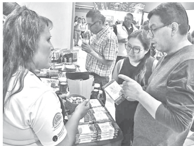
La realización de la Fexco Café & Cacao. HERNAN ANDIA

Una actividad central fue el Campeonato Nacional de Latte Art, denominado Lla-jta Arena 2025, organizada por Cafibol, que contó con la presencia del juez internacional Rafael Stein Valle y donde concursantes de diferentes lugares del país, demostraron su talento en el arte del Barismo.