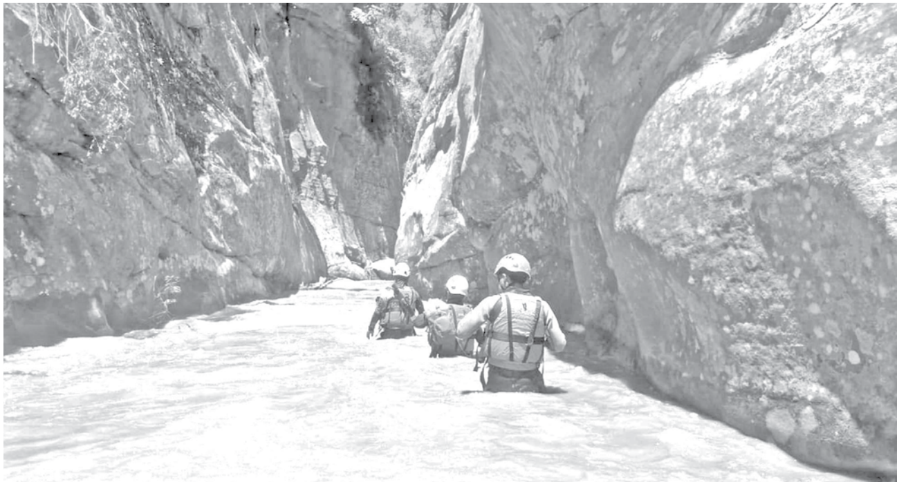
Rescatistas continúan la búsqueda de desaparecidos en Achira, en Samaipata. GADSC

En Apolo, el camino principal quedó totalmente intransitable por el lodo y los derrumbes, dejando vehículos varados.