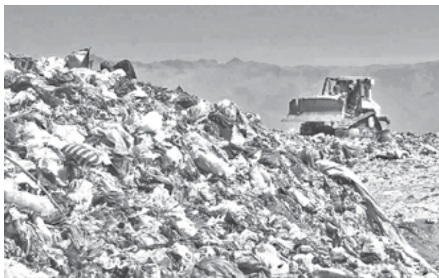
El botadero de K'ara K'ara, en el sur. CARLOS LÓPEZ

Los vecinos señalaron que a partir del 8 de diciembre se