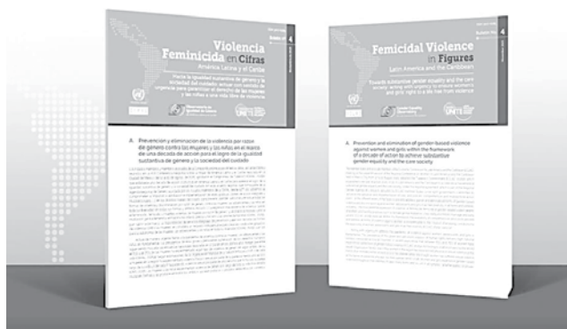
El informe de la Cepal. CEPAL

Esto representa, por lo menos, 11 muertes violentas de