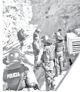
Reportan más robos a las minas. EL POTOSÍ