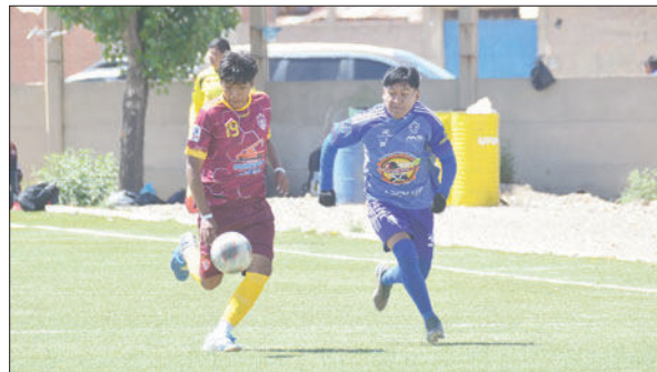
Deportivo Escara le ganó la pulseta a Deportivo Euqueño