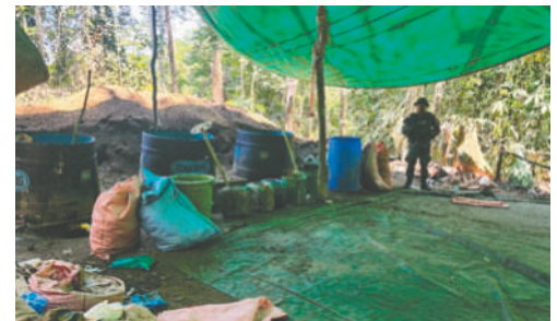
Una fábrica de cocaína destruida

Muy por debajo de los principales focos de producción de cocaína, departamentos como Chuquisaca, Pando, Potosí, Oruro, Tarija y Beni han registrado una presencia mínima