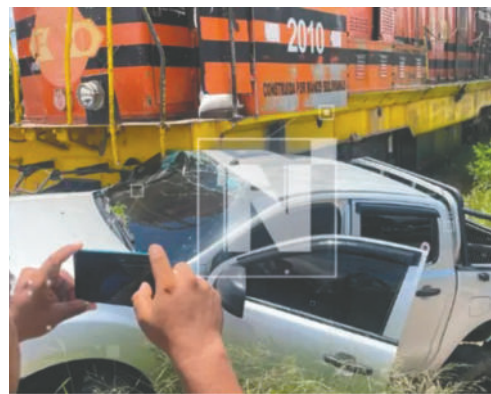
El accidente conmocionó a los vecinos

Este hecho obstruyó la vía que va del cuarto al quinto anillo de la Tres Pasos al Frente, por lo que tuvieron que intervenir efectivos de tránsito de la Estación Policial Integral (EPI) 5 de la Villa Primero de Mayo para restablecer el tráfico vehicular.