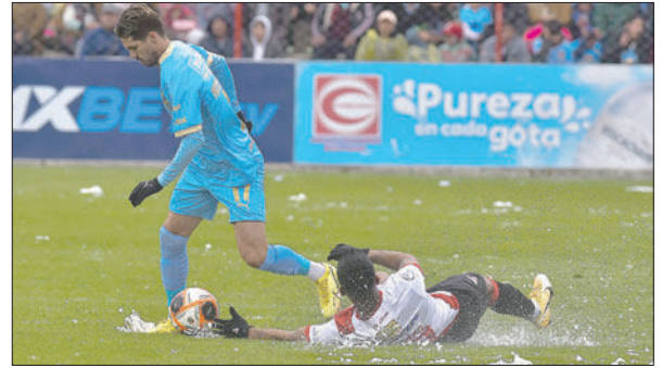
El granizo que cayó dejó anegado algunos lugares del campo de juego

En el primer tiempo, a los ocho minutos, una mano dentro del área fue sancionada en principio por el árbitro Dilio Rodríguez (Sucre), que en una revisión VAR cambió la determinación. Próximo a la media hora, llegó la jugada polémica del juego cuando un gol de los boliveristas fue anulado por una supuesta