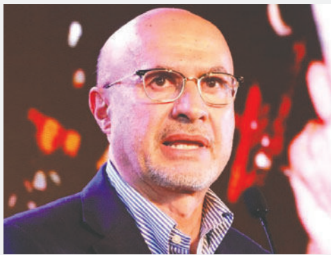
José Luis Lupo, ministro de la Presidencia /REFERENCIAL

El Censo de Población y Vivienda 2024 mostró que el 30% de la población boliviana vivía en pobreza. Sin embargo, Lupo advirtió que la inflación acumulada ha ampliado este sector. Con un Índice de Precios al Consumidor (IPC) que alcanzó el 19,22% a octubre, estima que la pobreza podría haberse expandido “hasta alrededor del 50%” de los bolivianos.