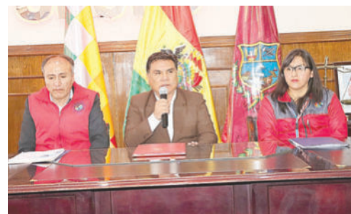
Desde hace 8 años, el departamento no cuenta con crecimiento vegetativo, informó el gobernador Johnny Vedia

Desde la autoridad departamental se espera que esta unificación ayude a "ordenar la estructura" y mejore la atención en salud a la población. Por su parte, el Sedes presentó un informe técnico donde se especifica el déficit por niveles de atención. El primer nivel requiere 786 trabajadores entre personal médico, enfermería, técnicos y administrativos.