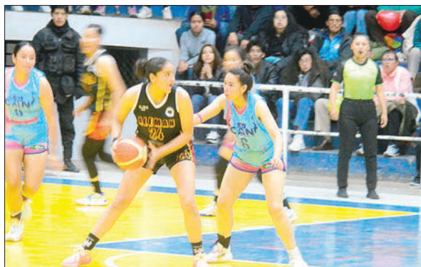
El partido se puso intenso en el último cuarto, CAN no pudo revertir