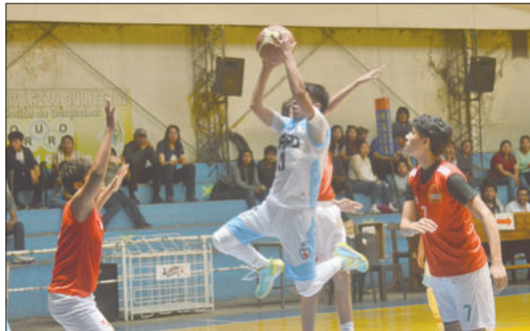
El talento orureño se puso de manifiesto en el torneo

La selección de Oruro cerró una participación impecable coronándose campeón de la Copa Bolivia Nivel "B" categoría U-16 rama masculina, evento que se desarrolló entre el 20 y 23 de noviembre en el coliseo "Luis Lazzo Quinteros". En la última fecha, el cuadro anfitrión, derrotó a Montero por 94 a 51, terminó invicto y ascendiendo al Nivel "A".