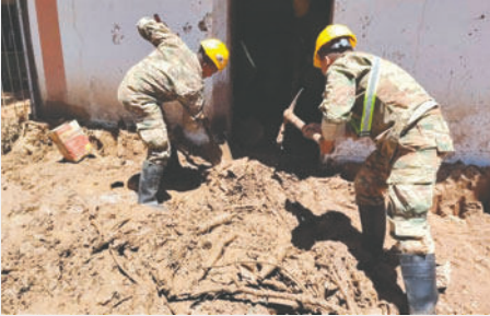
Las labores continúan para encontrar a las dos personas desaparecidas