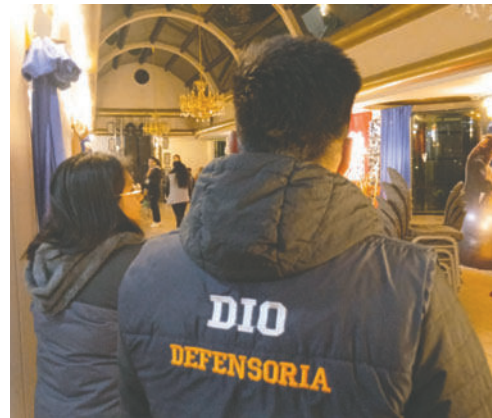
DIO intensifica controles nocturnos /DIO

explicó que estos operativos buscan prevenir situaciones de riesgo para menores, especialmente el consumo de alcohol, la exposición a entornos inseguros y posibles vulneraciones de derechos.