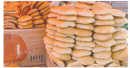
La demanda de Oruro según la Fedepanor supera 32.000 quintales de harina para el pan

Autoridades nacionales intervinieron Emapa y esa situación causó incertidumbre, sin embargo, la Fedepanor decidió mantener el precio del pan en 0,40 bolivianos aun cuando la harina ar-