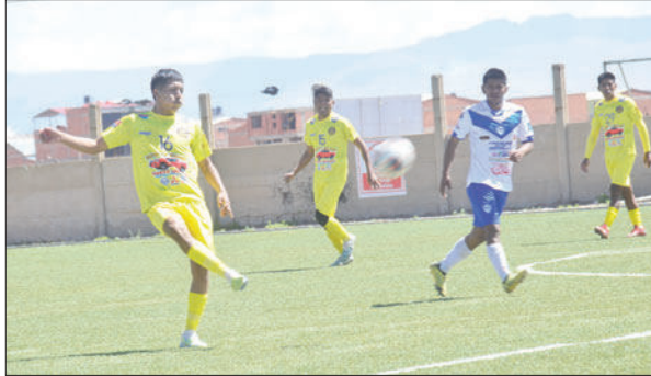
Deportivo Shalon tuvo que esforzarse para superar a San José

El otro equipo comprometido con el descenso es Aurora, que deberá jugar con los siguientes planteles para completar la fecha: Deportivo Shalon, AFIZ, Deportivo Escara, FC VHSR Oruro, Corque FC y EM Huanuni.