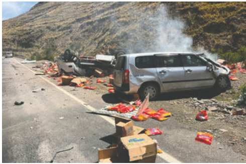
Cada vez son más los heridos y muertos en carreteras / NOTICIAS DE LLALLAGUA - NORTE POTOSÍ Y EL MUNDO

En los últimos años, Bolivia ha registrado un incremento sostenido en el número de víctimas de accidentes de tránsito, tanto heridos como fallecidos, a pesar de los esfuerzos desplegados por el Gobierno nacional y la Dirección de Tránsito para reducir la siniestralidad vial. Las cifras oficiales muestran que, lejos de disminuir, el problema ha ido en aumento, especialmente en los últimos años proyectados.