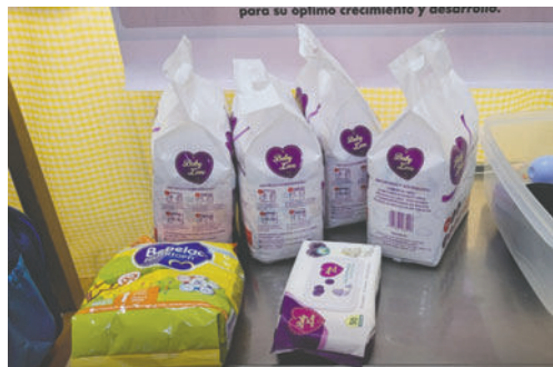
El gobernador Johnny Vedia realizó la entrega de insumos y alimentación para el recién nacido

Durante la jornada del domingo se entregaron pañales, ropita y leche al menor como parte del apoyo brindado por las autoridades locales. El bebé continuará bajo resguardo hasta que se determine su situación legal y familiar.