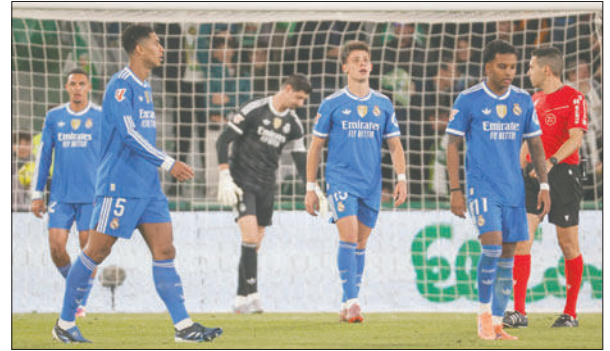
Jugadores del Real Madrid se lamentan por no poder ganar al Elche

Este empate también alimenta el sueño de escalada del Atlético de Madrid, que sigue cuarto y ya tan solo a cuatro puntos de su eterno rival y a uno del tercero, el Villarreal. Ganó (1-0) en Getafe, donde el año pasado comenzó su viacrucis. Lo hizo también sin jugar bien, pero tuvo seriedad atrás y alcan-