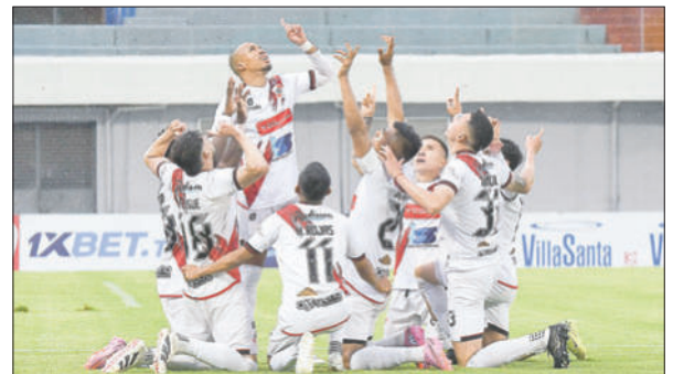
Jugadores de Nacional Potosí celebran el empate logrado en Cochabamba