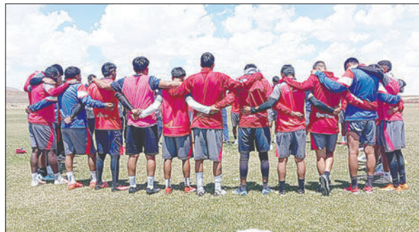
El cuadro orureño confía en lograr la clasificación a semifinales