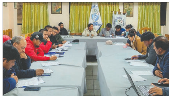
La decisión de cancelar el torneo fue asumida en reunión de Consejo Central de la AFO

Sin embargo, esta propuesta, que en principio tenía aceptación, fue rechazada a través de un documento emanado por los clubes de la Segunda de Ascenso. Además, esto repercutió en críticas de representantes de otros clubes, señalando