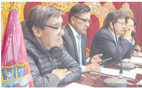
Nuevo presidente asume el reto de agilizar la atención y reforzar la independencia judicial