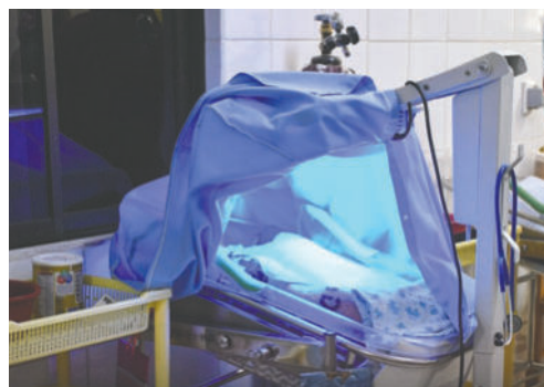
Bebé recibe atención en el Servicio de Neonatología

El centro de acogida Gota de Leche ya se encuentra preparado para recibir al recién nacido. "Se ha hecho llegar todo lo que necesita el niño en relación a insumos y alimentación. Administrativamente, Gota de Leche está en