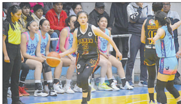
Alemán fue dominador de las acciones en los tres primeros cuartos

En el segundo cuarto, CAN se afianzó en zona ofensiva, pero en la contra el plantel "germano" supo manejar el ritmo para seguir marcando la diferencia y quedarse con la ventaja de 17-16, cerrando la primera mitad con el marcador global a su favor por 44 a 36.