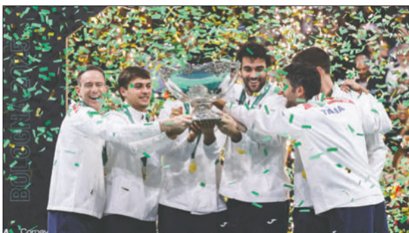
El equipo italiano de tenis celebra el título de la Copa Davis

Con su saque, Berrettini no perdonó la gran oportunidad. En volandas con un público incansable, se hizo gigante. Juego en blanco e Italia comenzó a ilusionarse de verdad con la victoria que poco a poco se fue haciendo efectiva, al final se registró el 2 a 0, con el cual Italia se coronó campeón.