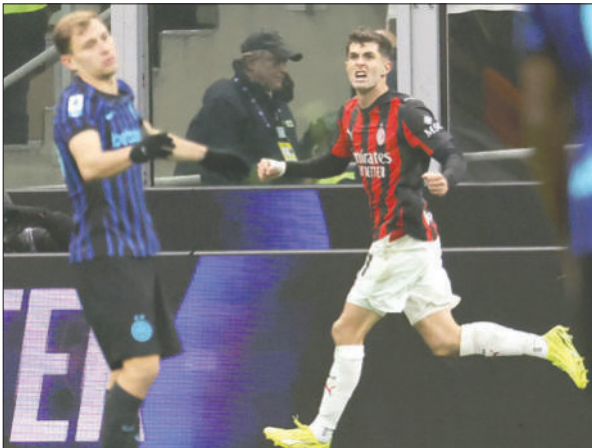
Christian Pulisic anotó el gol que le dio el triunfo al Milan

Resultados fecha 12: Cagliari 3-3 Genoa, Udinese 0-3 Bologna, Fiorentina 1-1 Juventus, Napoli 3-1 Atalanta, Hellas Verona 1-2 Parma, Cremonese 1-3 Roma, Lazio 2-0 Lecce, Inter 0-1 Milan; lunes: Torino-Como y Sassuolo-Pisa.