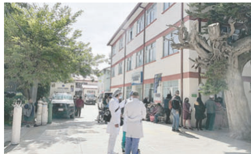
Oruro necesita 1.132 médicos, enfermeras y administrativos

Este proceso debe incluir a las organizaciones representativas del sector salud, como la Federación de Trabajadores en Salud, el Sindicato de Ramas Médicas y la Federación Departamental de Profesionales en Salud.