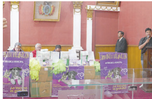
Oruro se prepara para la Campaña de Vacunación Antirrábica

Carrasco recordó que Oruro acumula más de diez años sin casos confirmados, pero advirtió que la continuidad de esa tendencia depende de que la ciudadanía lleve a sus mascotas a los puntos habilitados.