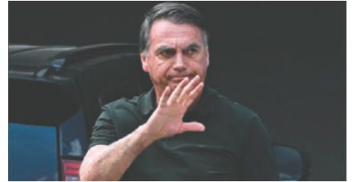
El expresidente de Brasil Jair Bolsonaro saluda a la llegada a su casa este domingo en Brasilia (Brasil)

Los dos fármacos citados son pregabalina (antiepiléptico) y sertralina (antidepresivo). Bolsonaro alegó también que no duerme bien y que estaba "alucinado" porque creía que en el interior de la tobillera había un sistema de escucha. Relató