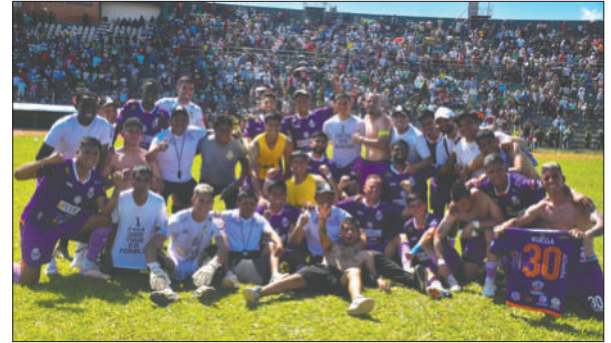
Jugadores del "rancho guitarra" celebran la clasificación en Trinidad