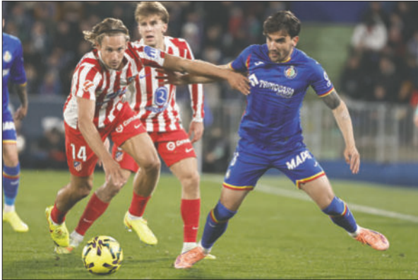
Atlético de Madrid derrotó de visita al Getafe por la mínima diferencia

El Real Madrid confirmó su mal momento, cuajó de nuevo un pésimo encuentro en el "Martínez Valero" ante un animoso y atrevido Elche que estuvo a punto de endosarle la segunda derrota del curso liguero pero que le arañó un empate (2-2) de gran mérito, resultado que ratifica los problemas del cuadro blanco, aún líder, pero con tan solo un punto de ventaja sobre el Barcelona.