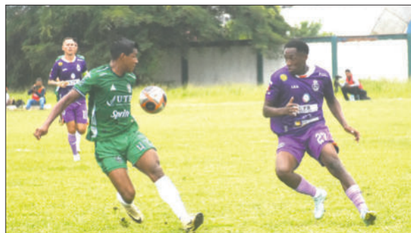
El equipo trinitario no pudo romper la cerrada defensa de Real Potosí

En la ida jugado en la Villa Imperial, el "rancho guitarra" venció 2-0 y en la vuelta en Trinidad, perdió por 2-1. Con un marcador global de 3-2, Real Potosí enganchó la clasificación a la final del torneo de ascenso, haciendo realidad este objetivo con el triunfo obtenido en la ida y defendiendo la diferencia en la visita a la capital beniana.