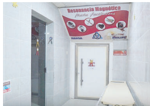
Resonador magnético no está en funcionamiento /CMO

La concejal insistió en que el problema ya se arrastra desde gestiones anteriores y que las fallas detectadas reflejan una cadena de retrasos admi-