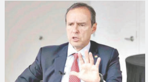
El expresidente de Bolivia, Jorge Tuto Quiroga