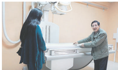
Rayos X lleva casi tres meses fuera de servicio por falta de mantenimiento técnico

Entretanto, cientos de pacientes continúan esperando soluciones mientras la infraestructura tecnológica permanece acumulando fallas y retrasos.