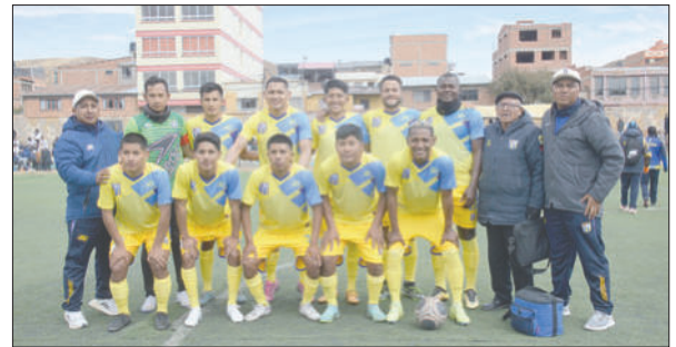
El equipo de EM Huanuni marcha líder en el campeonato y es el favorito