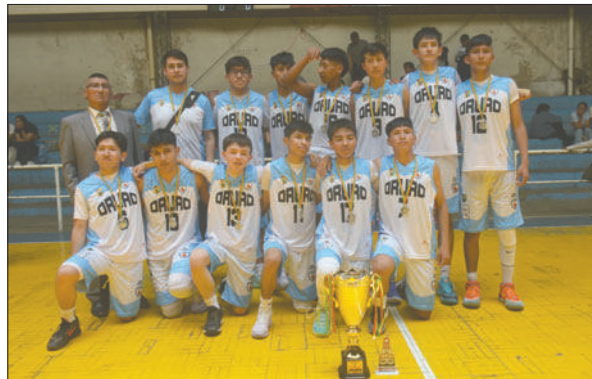
La selección de Oruro que logró el título de la Copa Bolivia U-16