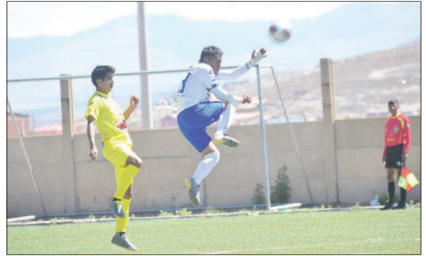
El cuadro "santo" dio batalla a pesar de las adversidades / LA PATRIA

La próxima fecha el cuadro de San José tendrá como rival a AFIZ, partido en el que se buscará sumar unidades para seguir con vida en el torneo. Luego se verá las caras con Deportivo Escara, otro encuentro complicado, mientras que en la fecha 23 rivalizará con FC VHSR Oruro, otro de los cuadros que trata de salir de la zona baja.