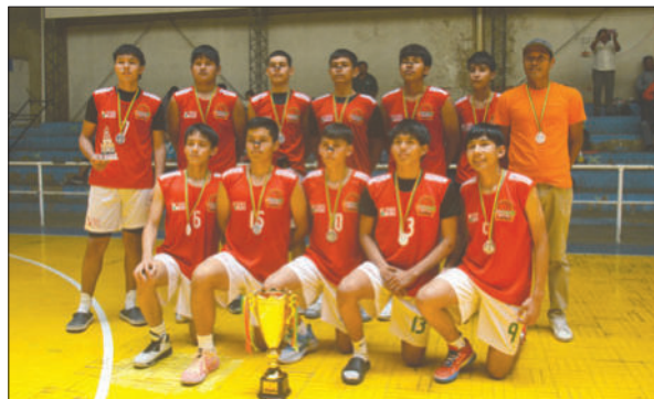
Montero dio batalla en el torneo, finalizó en la segunda casilla

tero; este cuarto finalizó 22-15 en favor del cuadro orureño.