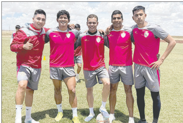
Los jugadores realistas se muestran optimistas para el partido del martes

domingo, pensando en lograr la clasificación a las semifinales del torneo seriado de la División Profesional, encuentro programado para este martes 25 de noviembre