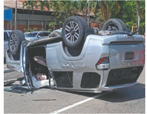
Santa Cruz es el departamento con más personas afectadas por accidentes de tránsito

Por otro lado, la Administradora Boliviana de Carreteras (ABC) y el Ministerio de Obras Públicas han trabajado en la mejora