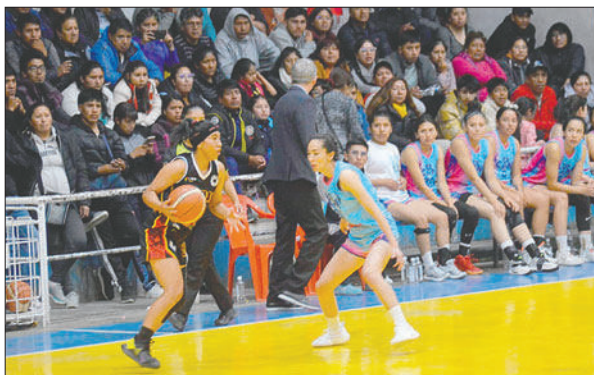
Buena cantidad de público en el desarrollo del partido

La victoria permite al cuadro "germano" sumar siete unidades y ubicarse en el segundo lugar de la tabla de posiciones, mientras que CAN queda tercero con seis puntos.