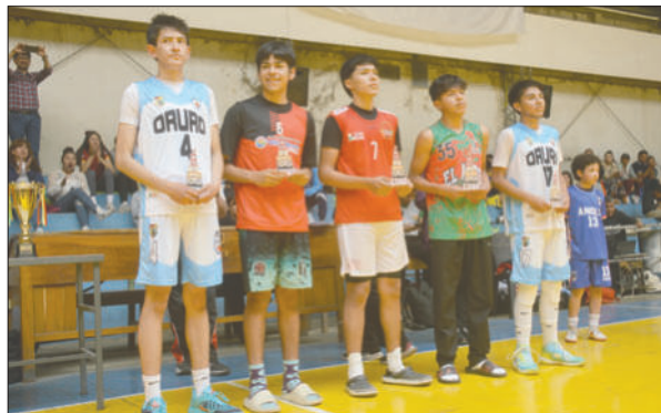
El quinteto ideal del certamen realizado en Oruro

Fueron tres días de intensa actividad en la cancha oficial de básquetbol, donde una regular cantidad de aficionados se dio cita en cada jornada. La mañana del domingo, se disputaron los tres últimos encuentros para definir las posiciones; el partido más resaltante fue el que protagonizaron Oruro y Montero en busca del primer lugar.