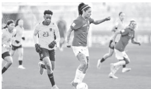
La Selección de Fútbol femenina.

cha de la Liga de Naciones, torneo inédito en el que la Verde se estrenó en el estadio Municipal de El Alto con una derrota ante Ecuador (0-4). “Vamos a jugar en el Siles, esto ya está planificado, el tema logístico lo ma-