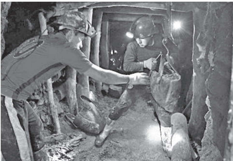
La extracción de minerales en Bolivia. GADC

(INE), en septiembre las exportaciones alcanzaron los 840,4 millones de dólares, lo que representa una leve disminución de 0,1 por ciento en comparación con agosto. Sin embargo, se destaca el crecimiento en las ventas externas de las actividades de extracción de minerales en 14,1 por ciento, agricultura, ganadería, caza, silvicultura y pesca en 5,8 por ciento y la industria manufacturera en 0,3 por ciento. Si se desglosan las actividades, se observa que la exportación de plata creció en un 21 por ciento y la de zinc en 16,7 por ciento, incentivada por el aumento de sus cotizaciones. Pero si vemos las cifras observamos un récord en las ventas de plata de 155,2 millones de dólares, algo que no se observó en las dos gestiones