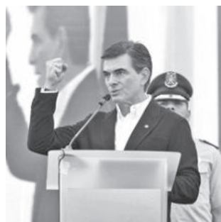
Rodrigo Paz Pereira.

El presidente Rodrigo Paz anunció que, además de la Comisión de la Verdad de los Hidrocarburos –en la que participa el Órgano Judicial– se instalarán otras investigaciones destinadas a esclarecer presuntos casos de corrupción en diversos sectores del país.