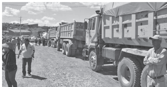
El inicio de obras en la avenida Caico. GADC

Dato. El proyecto abarcará 5.017 metros con un ancho de calzada de 8 mil meros en la avenida, ubicada en la zona sur