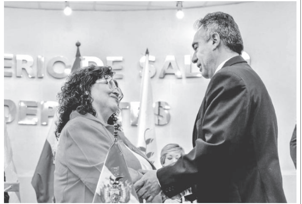
El nuevo viceministro de Deportes, Roberto Bustamante.

“Las instituciones existen, pero de nombre y no cumplen con el requisito básico que es tener su certificado de nacimiento... Las personerías jurídicas son importantes, tenemos que sentarnos y hacer que en los próximos años todo el sistema deportivo esté legalizado”, dijo.