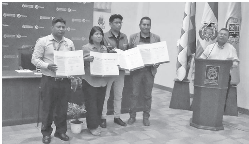
La firma del convenio entre la Gobernación y los alcaldes.