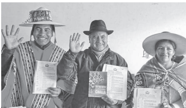
La celebración de autonomía plena en Challa.

Sánchez llegó ayer esa población ubicada a 140 kilómetros al oeste de la ciudad de Cochabamba, sede ahora del nuevo Gobierno Autónomo Originario Campesino de Challa, que el 7 de noviembre, mediante la promulgación de una Ley Nacional, consolidó su autonomía territorial plena.