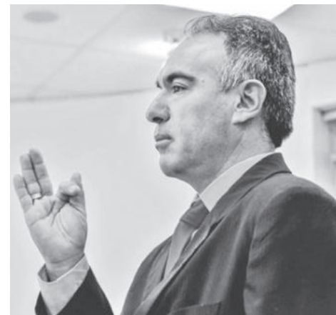
La autoridad se comprometió a trabajar por el sector y a escharlo. MINISTERIO DE SALUD