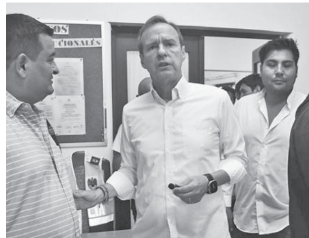
Jorge Tuto Quiroga, expresidente y líder de Libre.

El municipio confirmó cuatro casos de rabia canina en las últimas semanas, dos importados y dos autóctonos, estos últimos registrados en Lacma y Valle Hermoso.