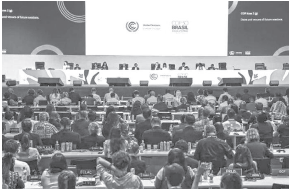
La sesión plenaria de clausura de la COP30 en la ciudad de Belém, Brasil.