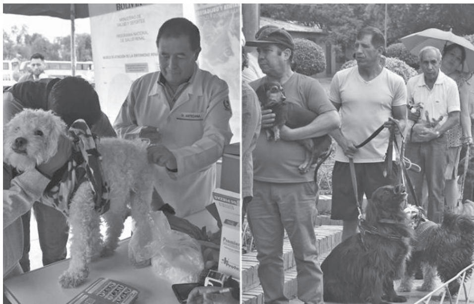
Immunización de una mascota en un barrio de la ciudad de Cochabamba, ayer. C. LÓPEZ

Prudencio advirtió que los propietarios que no vacunen a sus animales podrán ser sancionados con una multa de 500 bolivianos, en cumplimiento