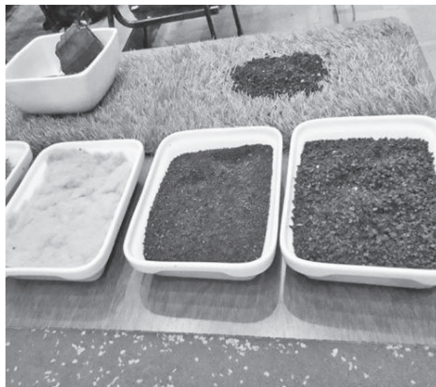
El material que se obtiene de los neumáticos.

Medio ambiente. La Gobernación ponderó la predisposición de los alcaldes para avanzar en la implementación de un sistema de reciclaje de residuos en sus municipios