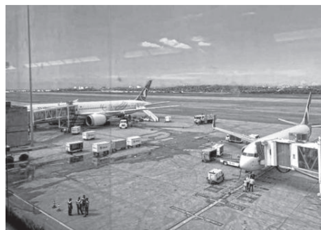
El Aeropuerto Internacional de Maiquetía. AEROFORME

Las otras seis aerolíneas que han suspendido sus vuelos son Iberia (España), TAP