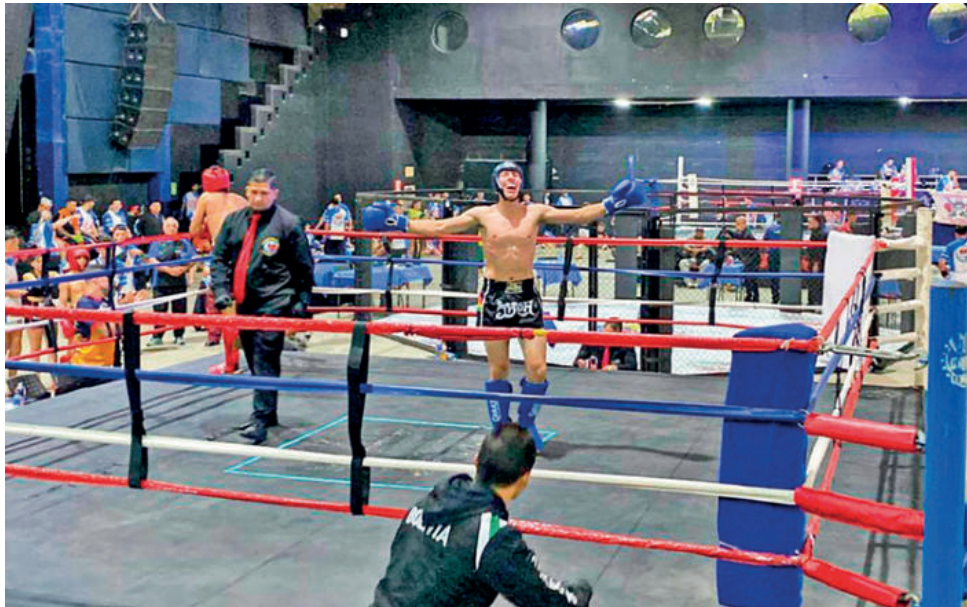
El peleador cochabambino en pleno cuadrilátero.

“Una bonita experiencia, increíble, todo lo que pude conocer, hasta la organización, realmente hay mucho nivel allá, nosotros al ser una delegación pequeña demostramos