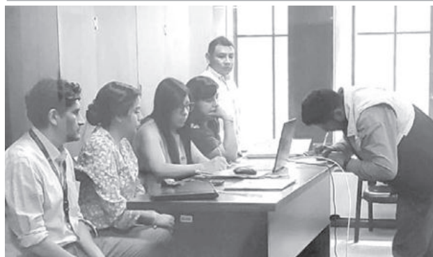
La apertura de sobres para la contratación.