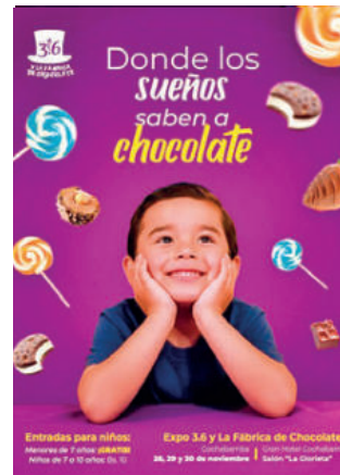
EDWIN FERNÁNDEZ ROJAS Los Tiempos

ESTÁ CERCA 2D DOBLADA: 20:30/22:45 NO ALIMENTES A LOS NIÑOS 2D DOBLADA: 15:30/17:45/20:00/22:15 TERROR EN SHELBY OAKS 2D DOBLADA: 16:00/18:15/20:30/22:45 WICKED POR SIEMPRE 2D SUBTITULADA: 21:30 4D E-MOTION 3D DOBLADA: 19:30 2D CXC DOBLADA: 10:00/13:00/16:00 3D CXC DOBLADA: 19:00/22:00 HARRY POTTER Y EL CÁDIZ DE FUEGO 2D ATMOS DOBLADA: 10:00/13:20/16:40 4D E-MOTION 2D DOBLADA: 14:00 LA REENCARNACIÓN DEL DIABLO 2D DOBLADA: 23:40 MONARCAS: EL GRAN VIAJE MÁGICO 2D DOBLADA: 10:20/12:30/16:45 NADA ES LO QUE PARECE 3 2D DOBLADA: 14:40/17:15/19:50/22:25 VOLVER AL FUTURO 2D DOBLADA: 10:10/12:50 4D E-MOTION 2D DOBLADA: 11:20 DEPREDADOR: TIERRAS SALVAJES 2D DOBLADA: 10:00/10:30/12:30/13:00/15:00/15:30/17:30/18:00/20:00/22:40 4D E-MOTION 3D DOBLADA: 22:50 ZOOPOCALIPSIS 2D DOBLADA: 10:00/11:30/12:15/13:45/14:30