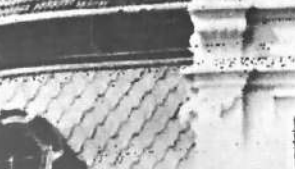
MONTAÑO GUARDIA. Soldados armados monon guardia en los techos del ametrallador de regimiento "Tacna" este mañana en Santiago, después de haberse acercado a la zona. (Santiago de Chile, 21,)

-BONN, 21 (AFP).- El Primer Canciller socialista de la República Federal de Alemania, Willy Brandt, recibió hoy su investidura del Parlamento Federal, cuando alcanzó una mayoría de votos superior a la prevista. "El nuevo gobierno federal de