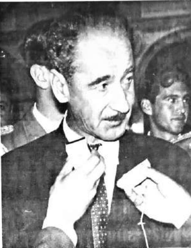
El Presidente Ovando calificó de "verdadera agresión al pueblo boliviano" la maniobra realizada ayer por "intereses anti-nacionalistas", que educieron más de dos millones de dólares, en busca, según el Jefe de Estado, de debilitar la economía boliviana y perturbar la estabilidad política del régimen revolucionario.

Gobierno revolucionario adopta medidas para hacer frente a la "agresión económica". - Feriado bancario. - Hacer ordeno la suspensión de embarques de materiales para el gasoducto.