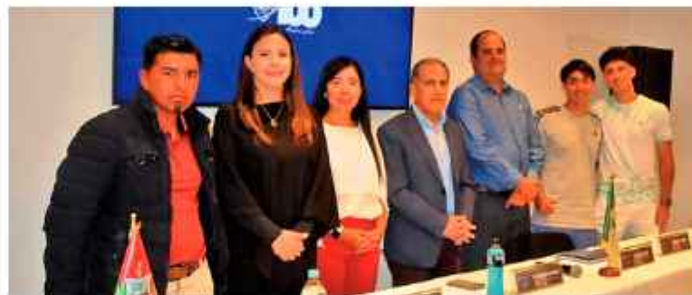
CONFERENCIA: Arbitros, dirigentes, autoridades y jugadores en la conferencia de prensa de ayer.

peramos que nos confirmen su presencia más tenistas. Competirán jugadores que ya están dentro del ranking de la ATP y que otros buscan sumar puntos, además les abre las puertas para el circuito de la ATP", dijo.