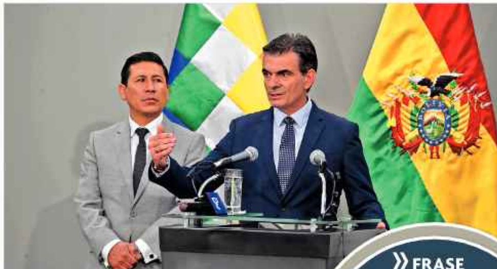
CONFERENCIA. El Presidente Paz explicó al país su decisión.

"El Ministerio de Justicia era una repartición de venta de sentencias, que generaba