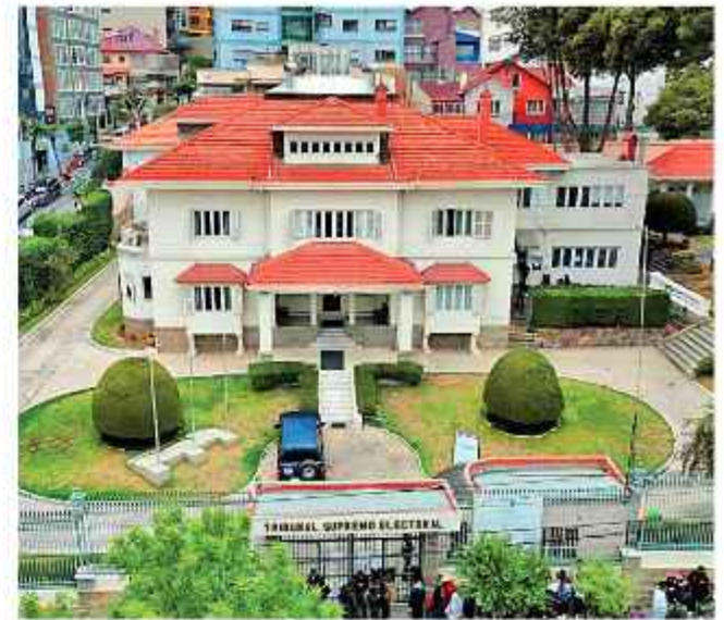
TSE: La tarea de los vocales es agilizar procesos electorales.

El vocal electoral, además, explicó que "se estima que por esta situación podrían verse perjudicadas al menos 50 agrupaciones políticas nuevas. Entre ellos Libre, cuya personería está en trámite; así como Ciudad Humana, entre otras".