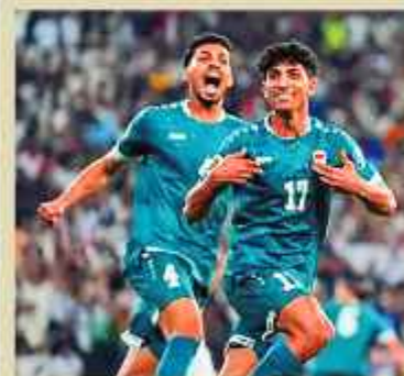
ALEGRÍA. Los jugadores de Irak celebran tras vencer a Emiratos.