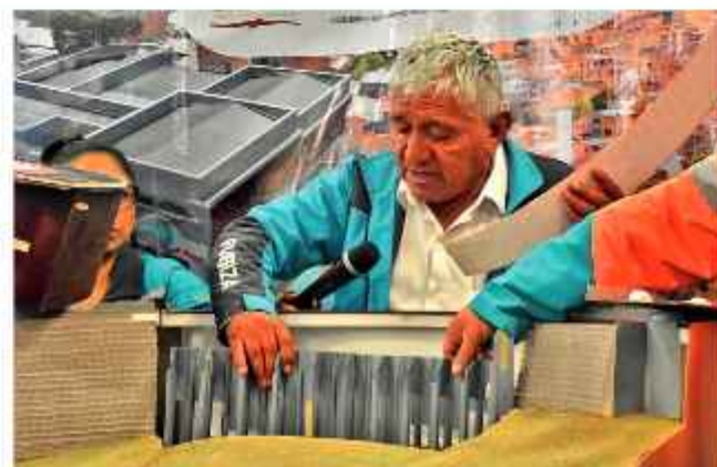
OBRA. El Alcalde muestra la maqueta de la estabilización.

La autoridad reconoció que el costo de la obra fue elevado, pero eso se debe a las características del diseño que se ha orientado a dar seguridad a los vecinos. "Es una obra naturalmente costosa, es una obra que ha tomado su tiempo construir, pero tengan la seguridad que se va a convertir un referente de la ingeniería en Bolivia", apuntó.