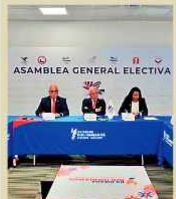
ASAMBLEA: Miembros de la Odebo en la reunión.