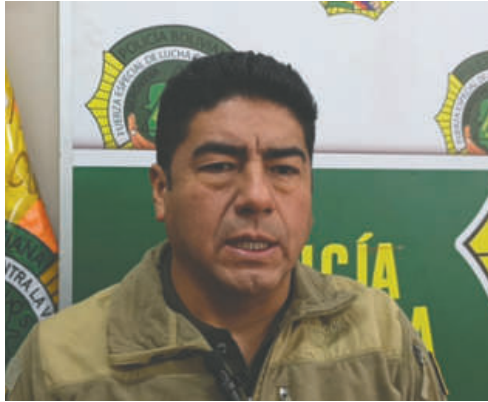
El coronel Gómez precisó que la víctima padece de 12 días de impedimento

A dos semanas del hecho, el militar se presentó a declarar ante despacho