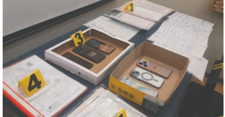
Indicios colectados por la Fiscalía y la Felcc