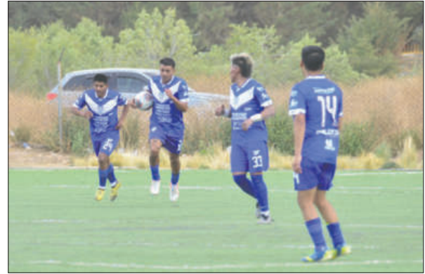
San José después de anotar el segundo estuvo a punto de empatar