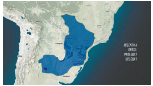
El acuífero guaraní, la reserva de agua subterránea más grande del mundo

El desplazamiento indica un desajuste global, una señal de que el planeta redistribuye masas de agua a gran escala, coincidiendo con el deterioro de acuíferos estratégicos para la alimentación y la biodiversi-