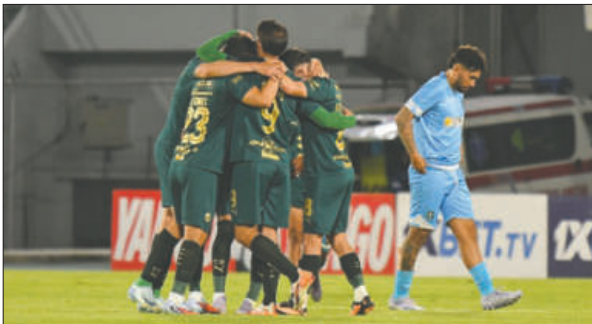
Jugadores de Bolívar celebran el triunfo logrado en Cochabamba