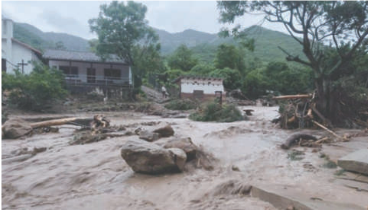
Samaipata inundada después de desborde de río

YPFB Transporte confirmó que el cierre de la