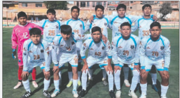
Futuro FC pugnará por el segundo lugar del certamen

En contrapartida, Futuro FC se aferraba a la esperanza de hacerle frente a los líderes del torneo, pero el traspí del fin de semana le aleja de dicha opción. El encuentro terminó 1 por 1, con lo que Futuro FC se queda en la tercera casilla con