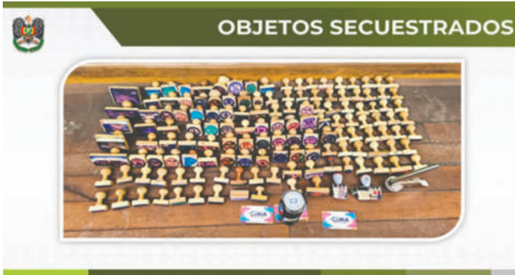
Se incautó 140 sellos falsos de distintas instituciones