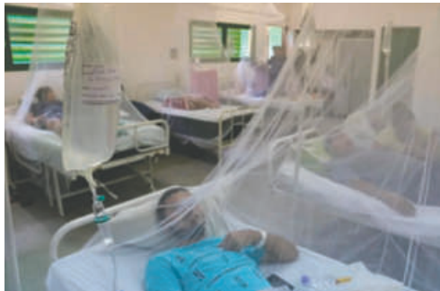
Pacientes con dengue que reciben atención en un hospital

El director nacional de Epidemiología del Ministerio de Salud Pública, Francisco Durán, afirmó en la televisión estatal que, solamente el martes, el sistema sanitario registró 1.706 nuevos casos sospechosos de dengue o chikunguña, y que se ingresó a un total de 3.226 pacientes.