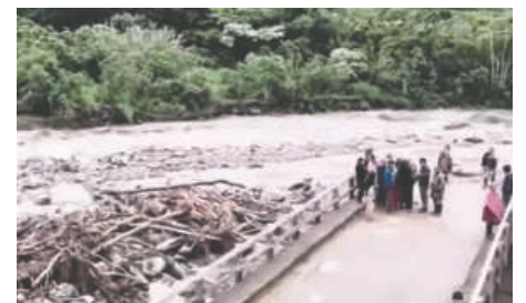
Puente de Pojo se cayó por el causal del río

Los pobladores hacen un llamado urgente a las autoridades para que inicien las labores de rehabilitación, ya que la temporada de cosecha está en riesgo por la falta de una vía de transporte funcional.