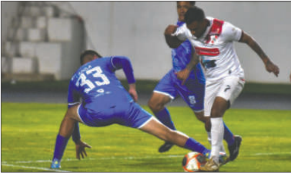
La derrota ante Nacional Potosí afectó el objetivo de GV San José

En pasados días surgieron en las redes sociales algunas voces de que