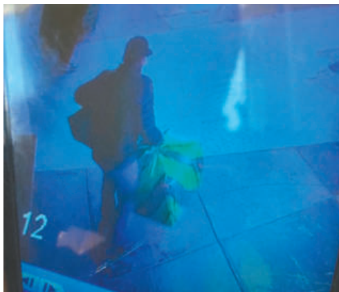
Las cámaras de seguridad delataron su accionar