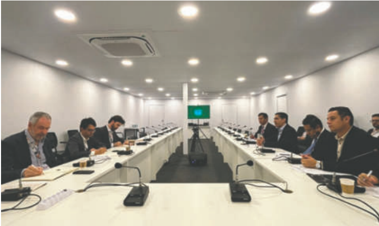
La reunión fue en la ciudad de Belém do Pará