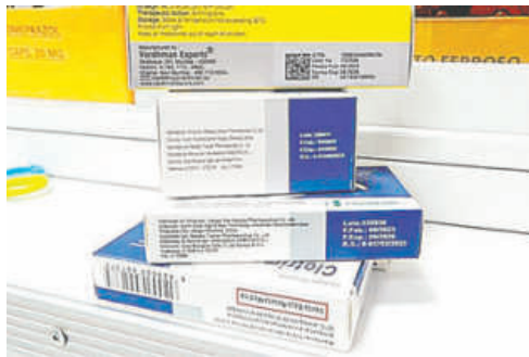
La inestabilidad del dólar afectó la adquisición de medicamentos

Por otro lado, señaló que si bien no existe un desabastecimiento total, admitió que existe escasez de algunos medicamentos,