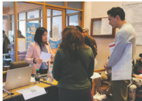
Los ciudadanos validaron situaciones de viaje y salud en la mayoría de los casos

El documento se otorgó a quienes justificaron su ausencia por enfermedad, embarazo, fuerza mayor o caso fortuito. Para ello, cada solicitante presentó su cédula de identidad, además de un certifica-