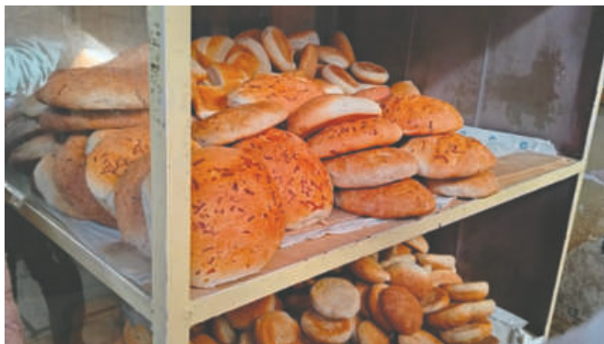
Panificadores independientes comercializarán en 10 puntos el pan

Mientras tanto, la Federación Departamental de Panificadores