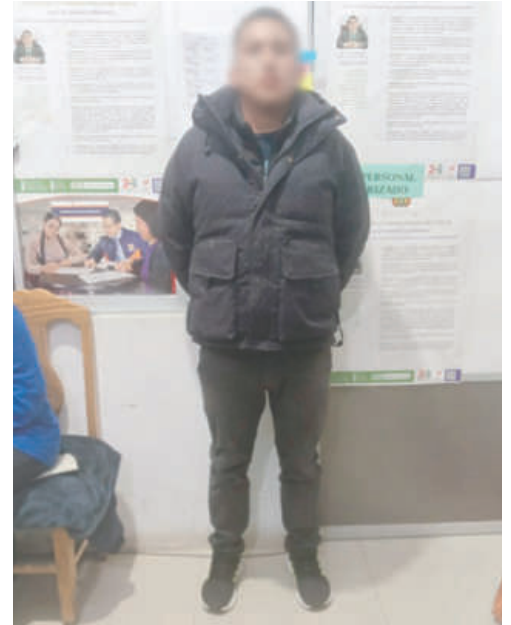
El teniente de las Fuerzas Armadas es investigado por violencia de género

“Estamos a la espera de la audiencia de medidas cautelares y de esta manera el juez que conocerá la causa va a establecer la situación legal de esta persona”, finalizó.