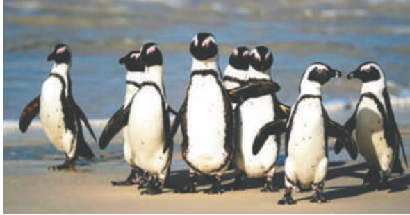
Pesca intensiva y escasez de peces: la creciente amenaza que empuja al pingüino africano al borde del colapso.

La presión pesquera modifica la dinámica habitual de estas aves marinas, que dependen de la disponibilidad inmediata de peces. Cuando la biomasa disminuye, los pingüinos deben avanzar mar adentro, perdiendo tiempo valioso para