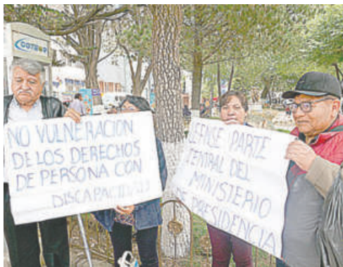
Personas con discapacidad alertan que el nuevo decreto afecta programas productivos y de vivienda

Su argumento es que muchos programas para