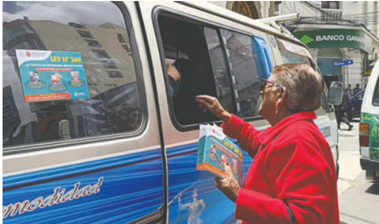
Socializan descuentos y servicios gratuitos establecidos por ley para los adultos /DIO