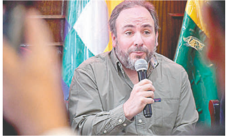
El representante de Cosco Shipping destacó el avance logrado /GADOR

“Es muy grato llegar a Oruro y ver contenedores entrando y saliendo del Puerto Seco. Esto será muy importante para que el departamento se consolide como un referente logístico y se materialice por fin un puerto seco plenamente operativo en Bolivia”, concluyó.