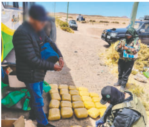
El implicado fue encontrado con 52 kilos de droga