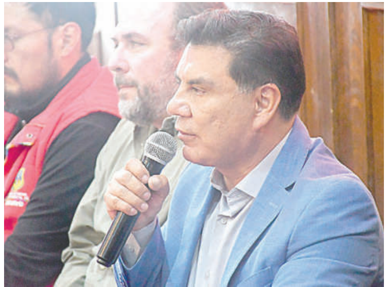
El gobernador de Oruro