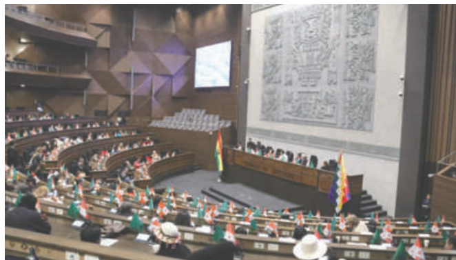
Pleno de la Cámara de Diputados

El legislador enfatizó la rapidez del proceso: "En 10 minutos hemos