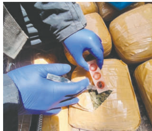
Agentes antinarcoóticos confirmaron que la sustancia que traficaba era marihuana