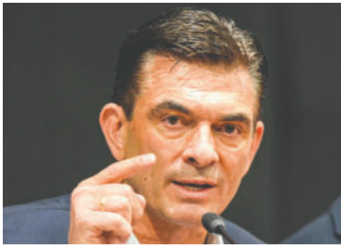
El Presidente Rodrigo Paz

La medida, establecida el 16 de noviembre, centraliza responsabilidades, especialmente en el eje productivo, y busca responder a la situación financiera "precaria" heredada, según un balance presentado por el propio Presidente Paz.