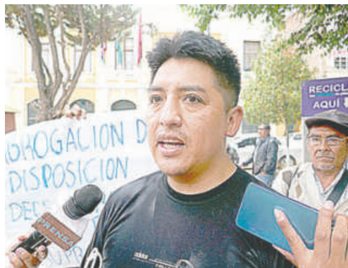
Federación de Personas con Discapacidad de Oruro pide abrogar decreto que transfiere programas al Ministerio de Salud /LA PATRIA

Mamani explicó que, bajo la estructura anterior, la Unidad Ejecutora