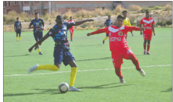
Deportivo Shalon sufrió, pero se llevó el triunfo ante Rosario Central

La fecha se completó con dos encuentros adicionales. Deportivo Shalon consiguió una victoria ajustada (1-0) frente a Rosario Central, que se plantó con orden y estuvo a punto de llevarse unidades. El único gol llegó a los