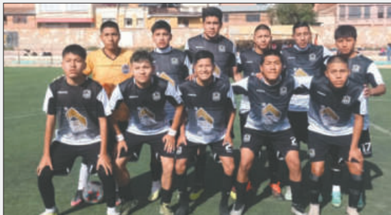
Morales Moralitos en busca de salvar la categoría /AFO

Morales Moralitos no tuvo un buen comienzo de campeonato y por varias fechas estuvo relegado al último puesto; sin embargo, en la segunda rueda fue mejorando su andamiaje y comenzó