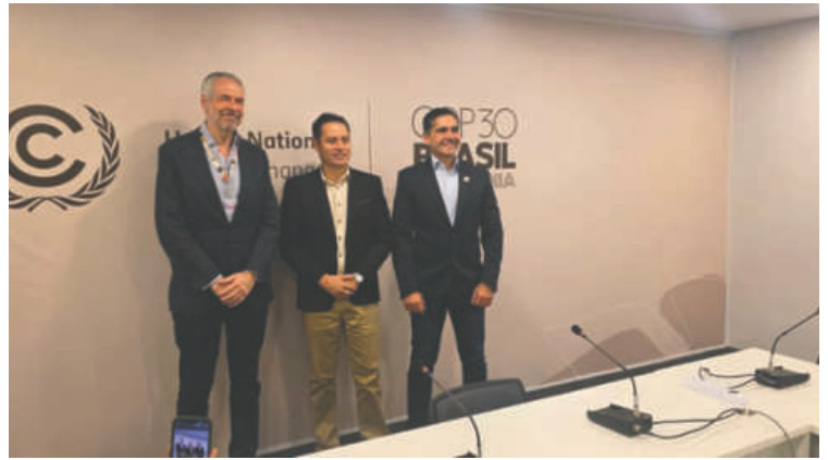
El vicepresidente del Estado, Edmand Lara Montaña, y el presidente designado de la COP30, Andrés Corrêa do Lago

LA PATRIA El Vicepresidente del Estado, Edmand Lara Montaña, sostuvo una reunión de trabajo con el presidente designado de la COP30, Andrés Corrêa do Lago, en la ciudad de Belém do Pará, Brasil. El encuentro formó parte de la agenda regional orientada al desarrollo sostenible y la acción frente al cambio climático.