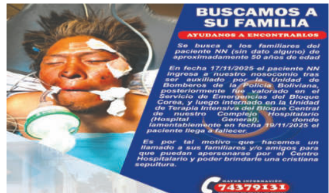
El occiso no fue identificado. Buscan dar con sus parientes

Se hace un llamado a los familiares y/o amigos para que puedan apersonarse por el Centro Hospitalario. Para más información, se pueden contactar al servicio de trabajo social al 743-79131.