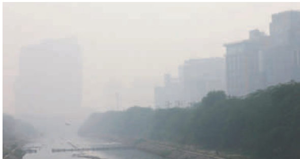
Nueva Delhi /EFE

Si los niveles superan los 450 puntos, las autoridades indias autorizan la puesta en funcionamiento