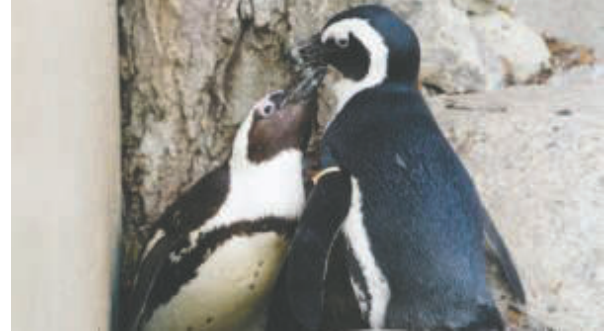
Estudios muestran los problemas que tienen los pingüinos.

Los adultos deben optimizar cada salida al mar para no descuidar a los polluelos, que dependen del retorno constante. Cualquier desplazamiento extra reduce las posibilidades de supervivencia de las crías. La creciente competencia generó reclamos para revisar las