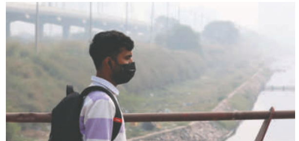
Los niveles de contaminación en Nueva Delhi han alcanzado un alarmante Índice de Calidad del Aire

Según la plataforma suiza IQAir, que mide los niveles de contaminación en vivo en todo el mundo con una escala diferente a la india, Nueva Delhi es este miércoles la ciudad más contaminada