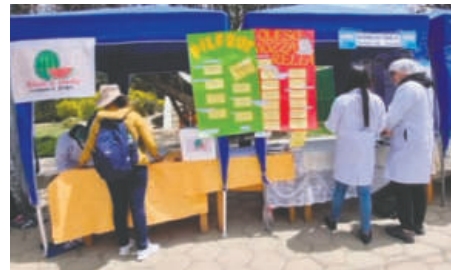
Varias innovaciones fueron presentadas en la feria