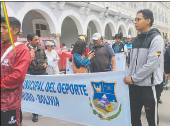
Dirigentes de la AMDO durante la marcha de protesta

Cabe recordar que desde el año pasado se impulsan esfuerzos para la creación de una ley departamental del deporte. No obstante, esta propuesta no contempla una asamblea del deporte, lo que genera resistencia entre sus dirigentes. La exclusión responde a los lineamientos de la Ley Nacional del Deporte, que no reconoce ninguna asamblea del deporte como parte de la estructura oficial del sistema deportivo boliviano.