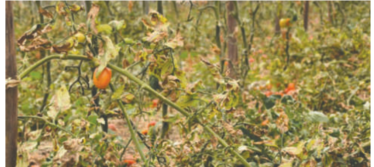
Los cultivos en mal estado por la pertinaz sequía de la Axarquía, la comarca más oriental de la provincia de Málaga

Tampoco hace falta irse lejos: las últimas sequías en el Mediterráneo mermaron