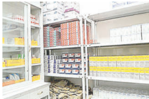
No existe desabastecimiento total de medicamentos, según Secretaría de Salud

Arce explicó que el problema principal no radica en la gestión municipal, sino en la negativa de empresas proveedoras a participar de las licitaciones