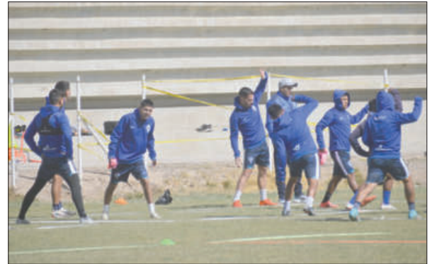
El equipo orureño con poco tiempo de preparación recibirá a Aurora

GV San José habría hecho jugar a un futbolista con sanción de doping y que por ello vendría una serie de sanciones. Sin embargo, la dirigencia del cuadro orureño dijo tener la tranquilidad necesaria ya que hasta la fecha no se recibió ninguna notificación sobre alguna sanción a uno de sus futbolistas.