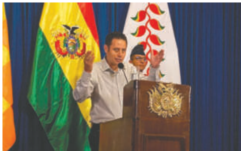
El vicepresidente del Estado, Edmand Lara, en contacto con los medios de comunicación

“Es un segundo vicepresidente que va a coor-