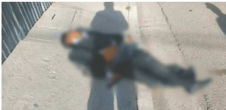
El joven fue hallado sin signos vitales en la vía pública; buscan identificar al conductor

Manifestó que el ahora occiso era chofer de un vehículo de servicio público en la ciudad de Oruro.