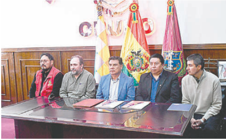
Autoridades aseguran que con este nuevo contrato se consolida el Puerto Seco