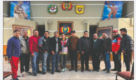
Dirigentes de ambas entidades tras el acuerdo logrado

En paralelo, el directorio transitorio de la Federación Boliviana de Automovilismo Deportivo (FEDAD) anunció reuniones entre el 25 y 27 de noviembre en La Paz para analizar modificaciones a su estatuto. En ese mismo encuentro se espera definir la fecha del congreso ordinario, donde se elegirá a la nueva directiva para el período 2026-2027.