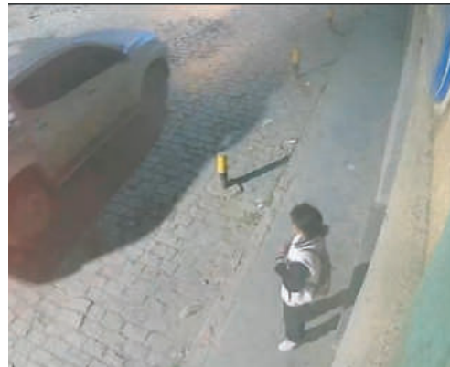
El momento que la adolescente está junto a la camioneta

De acuerdo con imágenes de cámaras de seguridad revisadas durante la investigación, la menor salió de su domicilio y posteriormente abordó