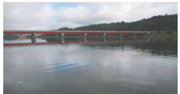
Encuentran contaminación por microplásticos en estuarios de Lengua y Tubul-Raqui en Biobío

"Aunque los niveles son menores, existe un riesgo creciente si no se implementan medidas de mitigación locales", advirtió Lardies. Estas partículas pueden