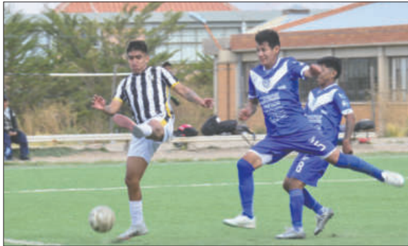
San José vendió cara su derrota ante Oruro Royal

Parecía una jornada tranquila para los albinegros, pero en el com-