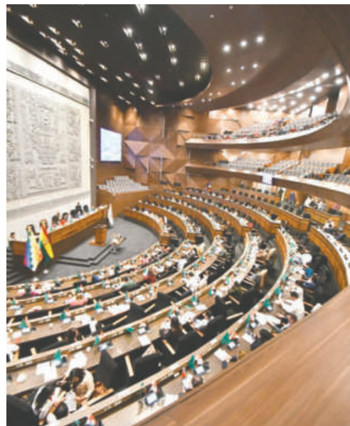
La sesión continuaba durante la madrugada de hoy, hasta el cierre de la presente edición

El pasado 18 de noviembre, el presidente de la Cámara Baja, Roberto Castro, determinó declarar en cuarto intermedio la sesión al no tener acuerdos para que esta siga adelante en el debate, por ello es que la norma tuvo que ser tratada, inicialmente, en la Comisión de Constitución.