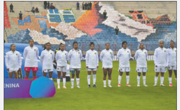
La selección boliviana recibirá a Colombia con la obligación de ganar

El trabajo del seleccionado verde continuará estos días, sin pausa, con las chicas concentrándose en un hotel de la zona de San Jorge. La carga física y futbolística comenzará a subir en estos días, en procura de sumar los primeros puntos en este torneo sudamericano, que otorga dos boletos directos a la Copa Mundial Brasil 2027 y dos indirectos.