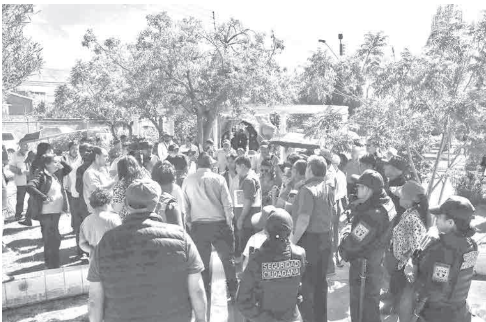
La recuperación del “Parque Temático de los Dinosaurios” en Villa Rosario. HERNÁN ANDÍA

“Es una pena, los niños venían con sus papás y solo podían mirar los dinosaurios