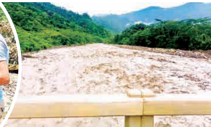
Varias zonas están en medio del agua. RKC

tores piscícolas y agrícolas mediante alimento balanceado, fertilizantes y trabajos de dragado en sectores críticos. Afirmó que la prioridad es resguardar a la población, contar con evaluaciones precisas y recuperar gradualmente los caminos y zonas productivas.