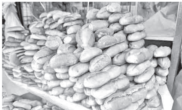
Un puesto de venta de pan de batalla en Cochabamba.

Reunión. Los dirigentes de los panificadores lamentaron no haber logrado acordar nuevo precio del pan con las autoridades.