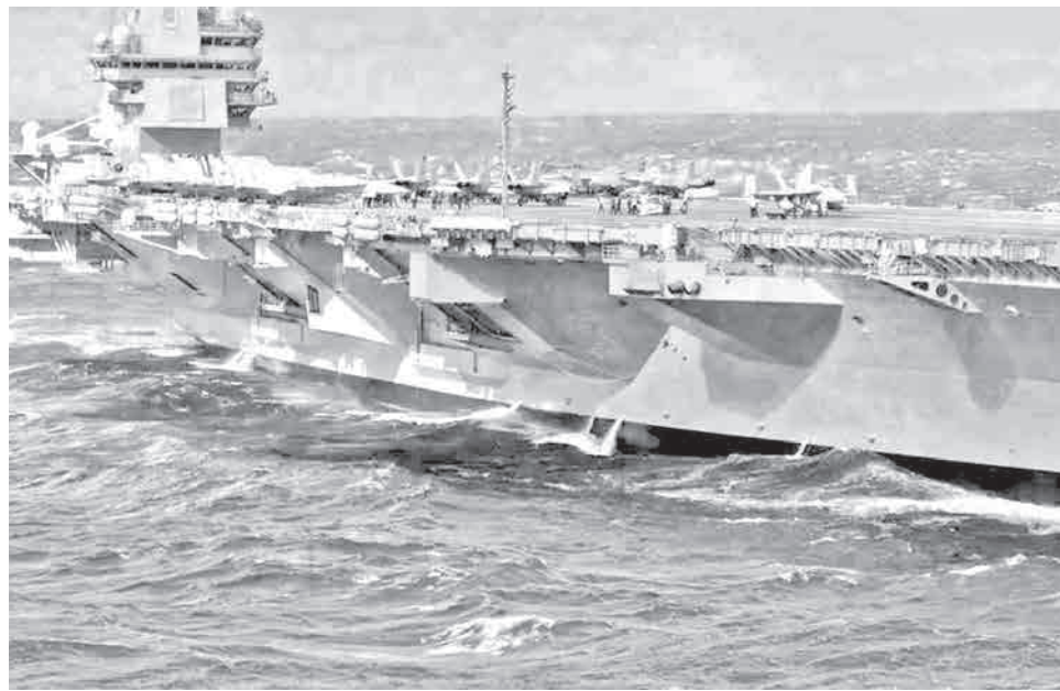
El portaaviones USS Gerald R. Ford puede llegar a pesar hasta 100 mil toneladas. U.S.

Trump ya había autorizado el mes pasado acciones sobre el terreno de estas agencias en Venezuela.