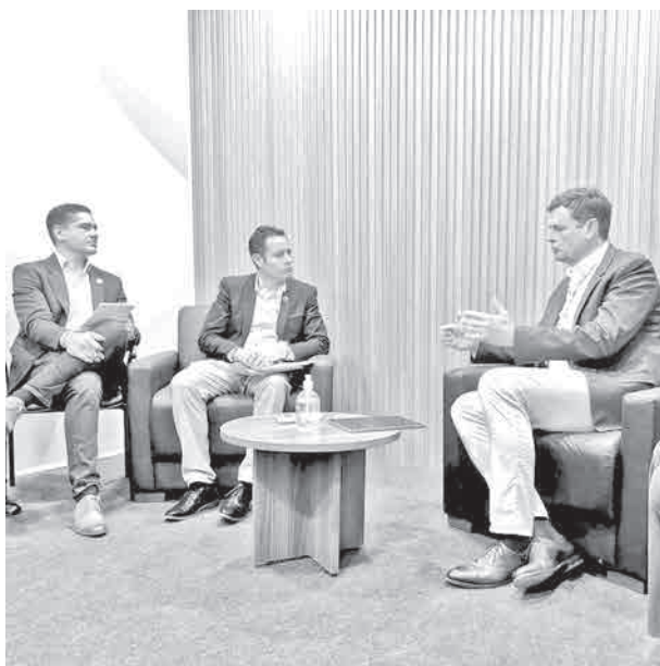
Autoridades bolivianas y alemanas reunidas en Brasil.

Según el reporte oficial, de la reunión participaron el vicepresidente Edmand La-