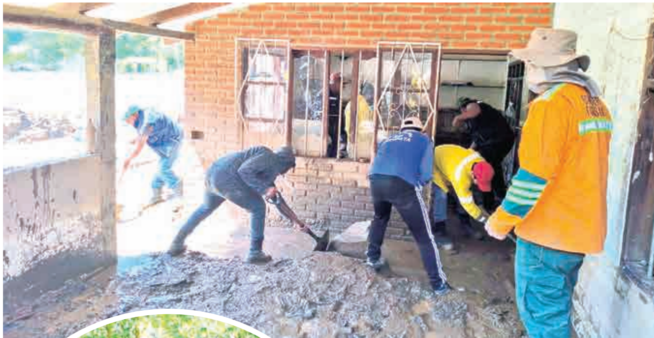
Limpian el lodo viviendas afectadas en Achira. GAMSC