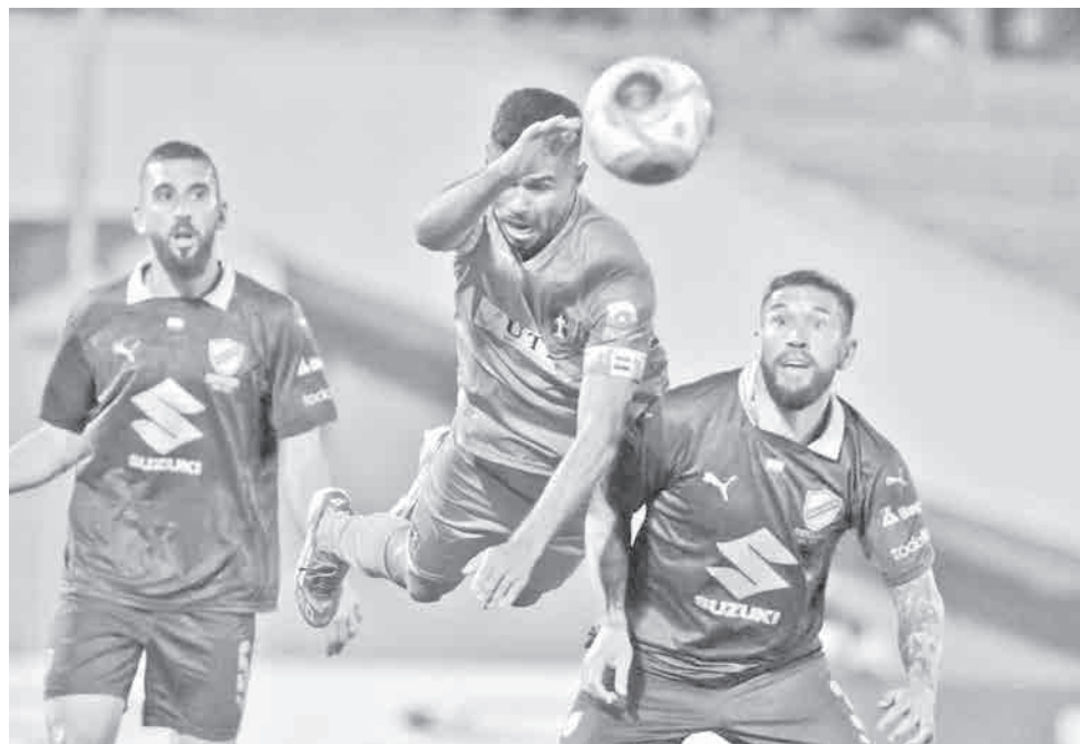
Incidencias del partido entre San Antonio y Bolívar. ROCHA

Pero, fue San Antonio el que intentó generar peligro sobre el marco de Diego Méndez, quien lució seguro cuando fue requerido.