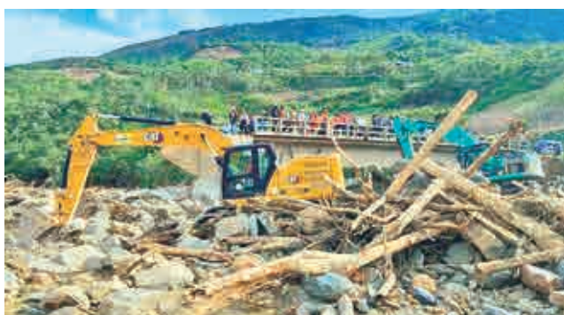
La afectación en el municipio de Pojo. GADC

nidades aisladas y generando pérdidas significativas en cultivos, animales y vías de acceso. Productores y autoridades locales piden ayuda urgente para restablecer el paso y evitar que la cosecha de durazno se pierda.