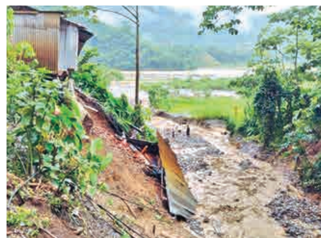
Riada en La Asunta daña viviendas. LA ASUNTA

brigadas de rescate y personal de emergencia se mueven entre lodo y rocas, intentando restablecer un mínimo de normalidad.