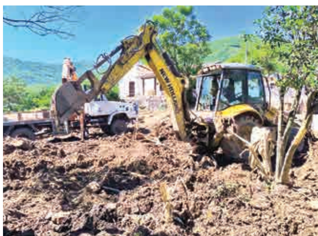
Usan retroescavadora para el retiro del lodo. GAMSC

Ayuda. Los pobladores afectados se encuentran incomunicados por el daño en los caminos y puentes. La ayuda recaudada por voluntarios y cívicos no pudo llegar a las familias afectadas