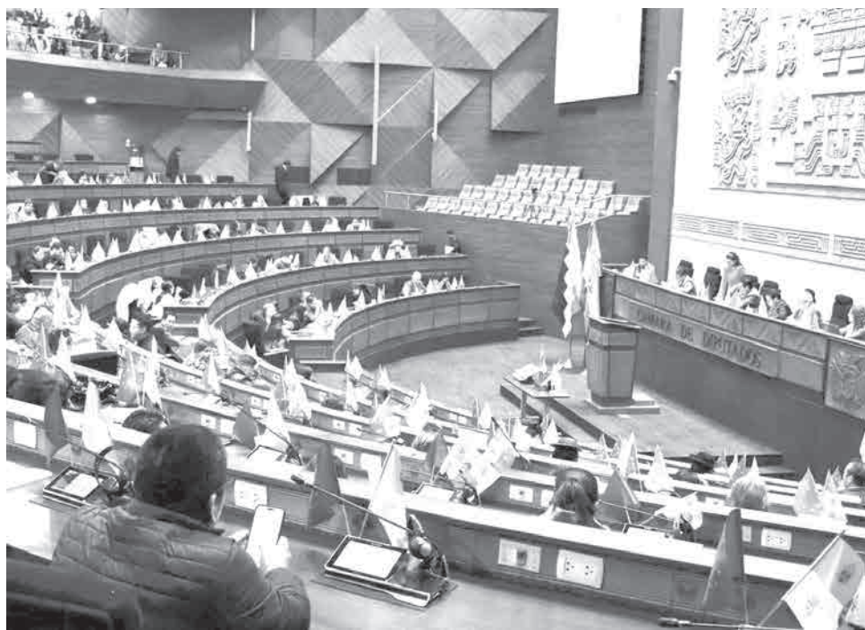
El pleno de la Cámara de Diputados. CDEPB

El Tribunal Supremo Electoral (TSE) insistió en que la ley debe ser aprobada lo antes posible debido a que los plazos para la convocatoria, el calendario electoral y la posesión de autoridades ya se encuentran al límite. La demora se produjo porque legisladores de Libre plantearon introducir cambios que permitan la participación de organizaciones políticas que aún están en trámite obtener su personería jurídica, pese a la restricción actual que exige