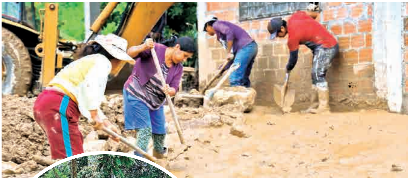
Los daños en el trópico de Cochabamba. GADC

Intervención. Las autoridades intensifican las labores de asistencia y recuperación frente a los daños estructurales, las pérdidas agrícolas y las familias afectadas en diversos municipios de Cochabamba