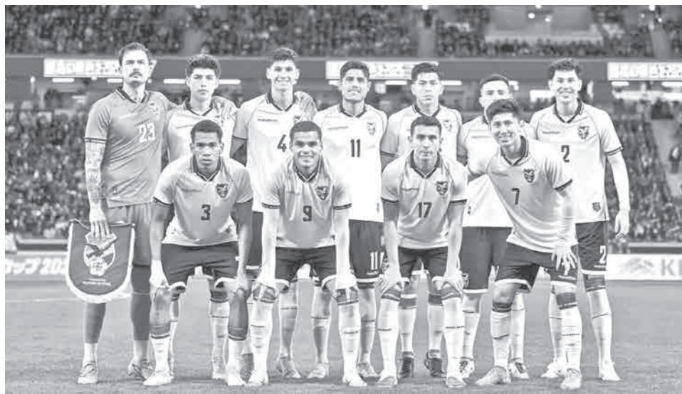
La Selección Nacional se prepara para el repechaje.

Las cuatro selecciones con menor ranking, son: Nueva Caledonia (149), Surinam (123), Bolivia (76) y Jamaica (70). Mientras las de mejor ranking: Irak (58) y Congo (56). Las finales determinarán a los dos conjuntos que completarán el cuadro de