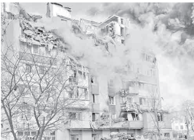
Un edificio dañado por el ataque ruso.

Rusia contra Ucrania durante la noche, en el que, de acuerdo con la Fuerza Aérea de Ucrania, se dispararon 476 drones de ataque y señuelo, junto con 48 misiles de distintos tipos que impactaron en varias regiones. La mayor parte de los misiles y drones fueron interceptados por las defensas antiaéreas, que contaron con el apoyo de aviones F-16 y Mirage-2000 de fabricación occidental, aunque seis misiles lograron atravesar la defensa y provocar graves daños en áreas residenciales e infraestructu-