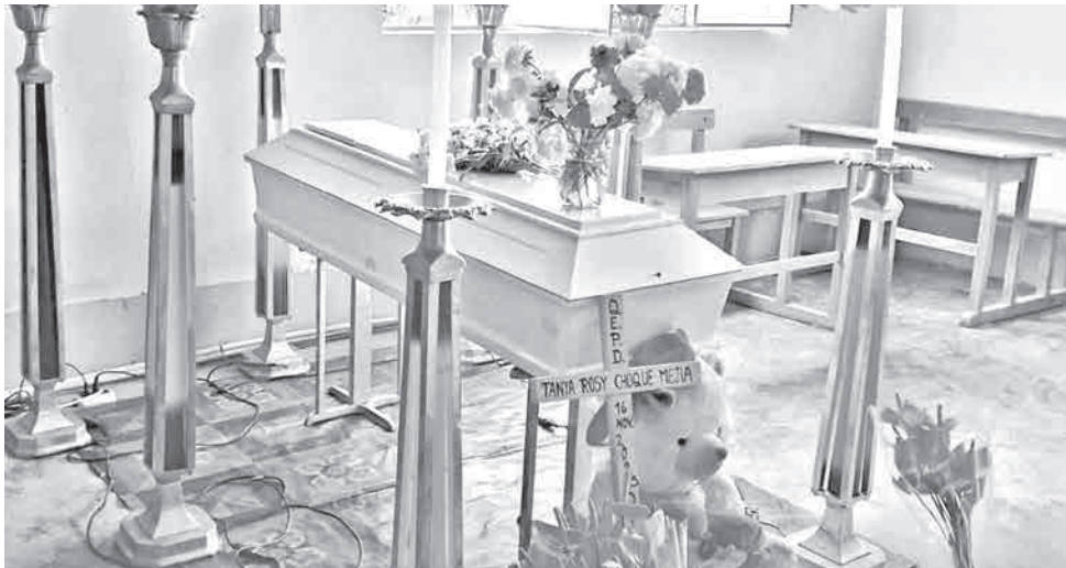
Familiares y amigos en el velorio de la adolescente en la localidad de Chulumani.

La población de Chulumani veló el cuerpo de la adolescente en medio de pedidos de mayor seguridad y reclamos por una investigación exhaustiva. Algunos vecinos piden que se indague si hubo apoyo de terceras personas debido al lugar en el que fue abandonado el cuerpo. El autor confeso, Brayan P., enfrenta investigación por feminicidio, delito que tiene pena máxima de 30 años de prisión sin derecho a indulto en Bolivia. La Fiscalía anticipó que continuará profundizando las indagaciones para esclarecer el crimen.