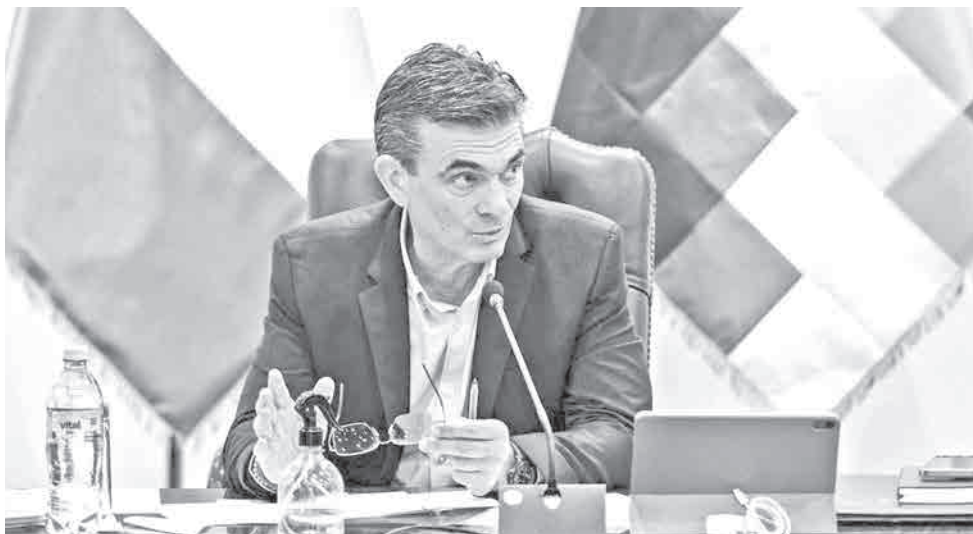
El presidente del Estado, Rodrigo Paz, durante un acto público.

Desde el Legislativo surgen pedidos de actuaciones para encontrar a los responsables de desfalcos. Las bancadas de APB-Súmate y Libre formalizaron una solicitud para la conformación de una Comisión Especial Legislativa, de carácter extraordinario, destinada a investigar estas denuncias. El presidente Rodrigo Paz denunció el pasado domingo un robo de $us 15 mil millones durante la gestión del MAS y afirmó que continuará la “autopsia” del Estado, pero no se refirió a responsables ni a procesos.