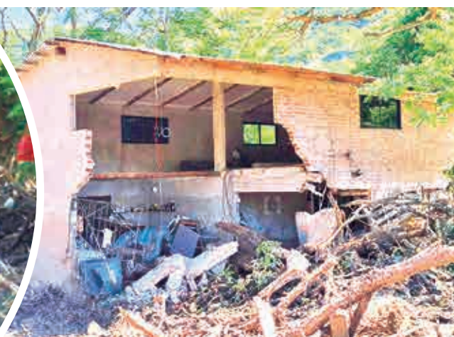
Vivienda queda destruida por la riada, ayer. GAMSC