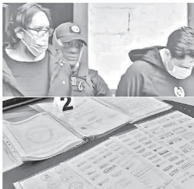
Los falsificadores detenidos en la ciudad de Oruro.

“También se ha encontrado en el otro domicilio documentación en blanco de Derechos