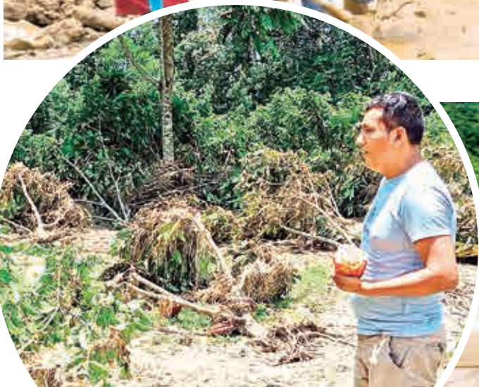
El desastre en Villa Tunari por los desbordes. RKC