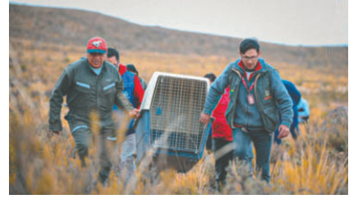
Tras el rescate del animal silvestre, se coordinó su liberación

“Es un zorro andino que ha sido liberado. Para nosotros es muy satisfactorio, porque en redes sociales circulan muchos comentarios, pero el procedimiento ha sido responsable y técnico. El animal se fue caminando