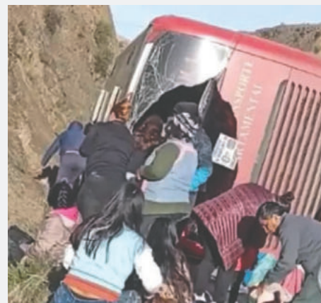
Los heridos fueron evacuados de inmediato