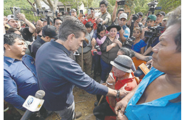
La gente solicitó ayuda al Primer Mandatario

La llegada de los 380.000 dólares del Fonplata, destinados exclusivamente a la ayuda humanitaria, no solo proporciona recursos cruciales, sino que también sella un compromiso de trabajo coordinado entre el Gobierno Central y la Gobernación de Santa Cruz, uniendo esfuerzos para la mitigación y el auxilio de las familias que perdieron sus hogares.