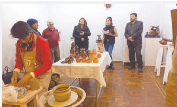
La muestra de cerámica se efectúa por 3 días

Roque destacó la versatilidad demostrada por los estudiantes del IFA y el impacto positivo que tuvo la experiencia en los participantes, quienes pudieron explorar el modelado, el tratamiento de arcillas y distintas técnicas de cocción. Añadió que la interacción directa con el material permitió generar un espacio de inclusión y creación colectiva, ya que también estuvieron involucrados estudiantes de unidades educativas que tienen autismo y