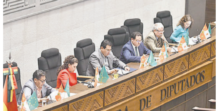
La sesión se declaró en cuarto intermedio

El proyecto de ley tiene el objeto de "establecer un régimen excepcional y transitorio para la realización de las Elecciones Subnacionales