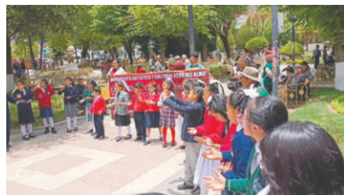
El homenaje se hizo al mediodía

Rojas destacó la participación coral de los niños y adolescentes, quienes integran el movimiento cultu-