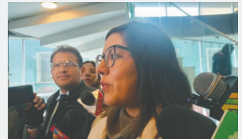
La diputada Lissa Claros