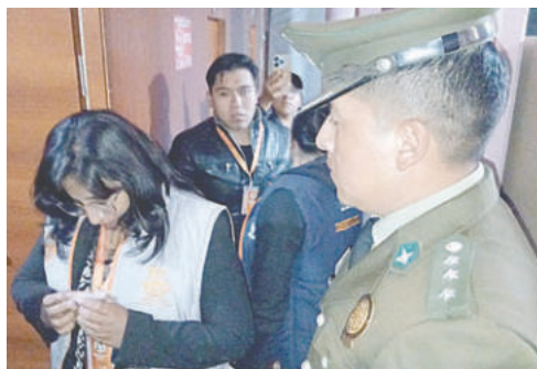
Operativo terminó en la clausura del cine video