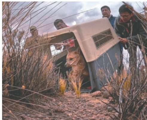
Tras recibir atención en el Bioparque, el zorro fue liberado

“El personal de Pofoma está realizando, junto al GAMO y la Gobernación, la liberación del zorro, precautelando siempre su integridad física. Sabemos que es un animal silvestre y lo estamos retornando a su hábitat”, indicó.