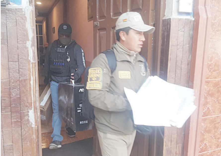
Secuestran evidencia tras allanamiento en el primer domicilio