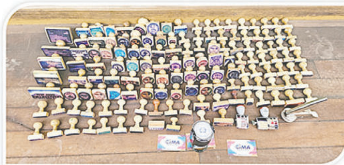
Secuestraron 140 sellos tras el operativo