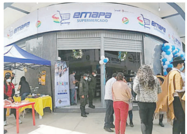
Uno de los supermercados de Emapa

La presunta red de corrupción “está ya plenamente identificada”, aunque la auditoría forense continúa. Se sospecha que el subsidio a la panificación no es el único circuito irregular detectado dentro de la empresa estatal.