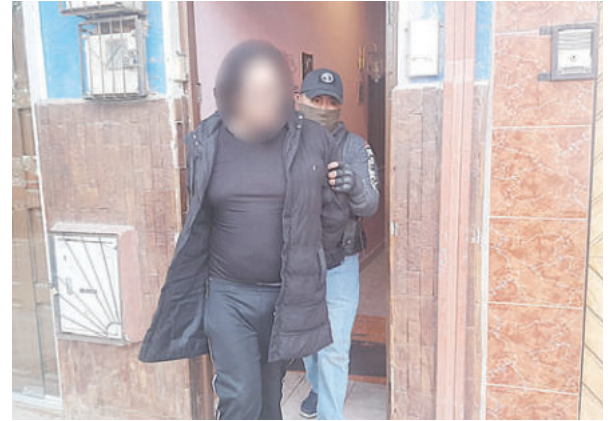
El primer allanamiento terminó con la aprehensión de un sujeto y el arresto de su hermano