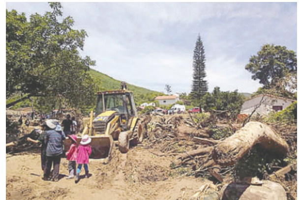
La tragedia sacudió a Samaipata