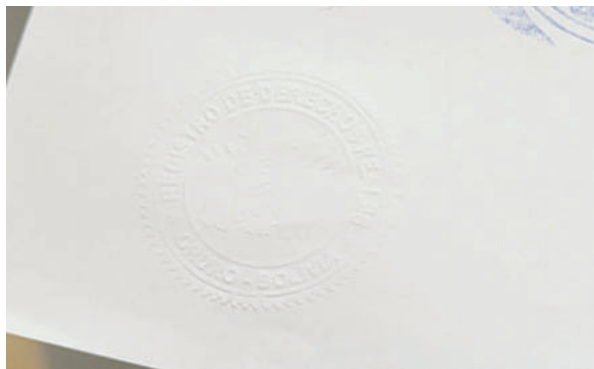
Hallaron sello seco falso de Derechos Reales /LA PATRIA

ción falsa y hace cuánto. Se estima que hoy se desarrolle la audiencia cautelar y definan la situación jurídica de los tres aprehendidos.