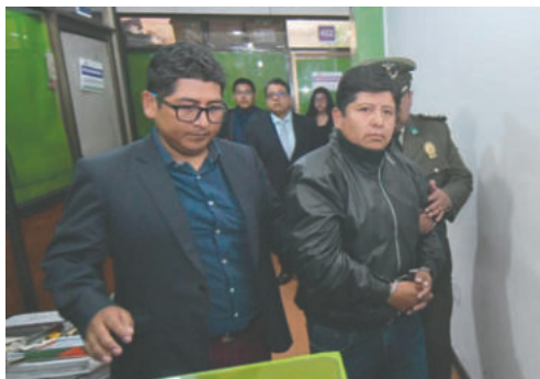
La justicia ordena prisión de seis meses para el exdirigente de la COB, investigado por enriquecimiento ilícito y otros delitos

La imputación formal presentada por la Fiscalía se centra en los presuntos delitos de enriquecimiento