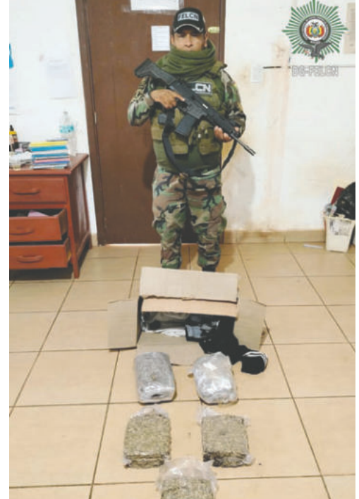
Investigan al remitente y al destinatario de la narcoencomienda /FELCN

La requisa se llevó a cabo en diferentes empresas de transporte. Tras realizar la prueba de campo, se confirmó que la sustancia era marihuana, lo que llevó al secuestro