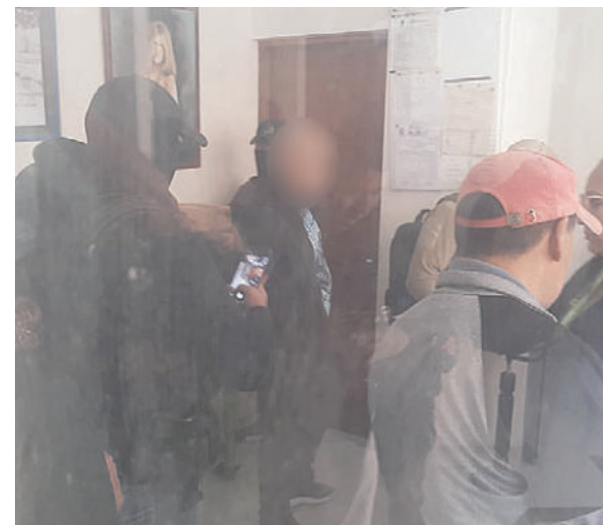
En un operativo frente al Colegio Bethania se logró la aprehensión de un tercer ciudadano