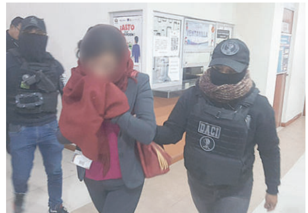
La funcionaria judicial de la DAF fue aprehendida en su fuente laboral