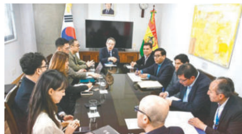
Gobernación y la Embajada de Corea del Sur tuvieron una reunión fructífera

"El compromiso de la Embajada de Corea es agilizar los trámites administrativos y garantizar que los proyectos se eje-