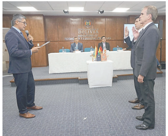
El ministro de Economía y Finanzas, José Gabriel Espinoza, posesionó a nuevas autoridades

A su turno, el ministro de Economía, José Gabriel Espinoza, indicó que las nuevas autoridades cumplen con los estándares de calidad y meritocracia para el trabajo que desarrollarán durante la gestión en la visión de carácter social que realizarán.