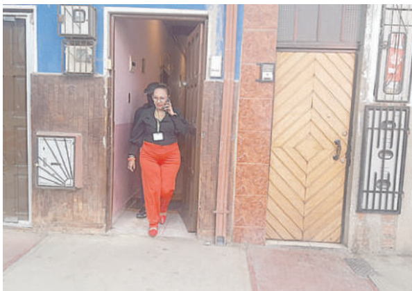
La fiscal Patricia Araoz lideró el operativo