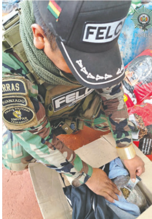
Prueba de campo confirmó que la sustancia se trata de marihuana