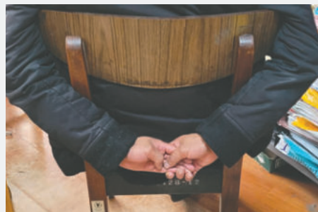
Humberto deberá cumplir su condena en el penal de San Pedro