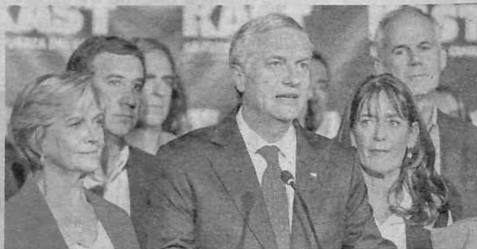
El candidato republicano José Antonio Kast.

El pacto Cambio por Chile que lideran los republicanos -junto a los libertarios de Kaiser y el Partido Social