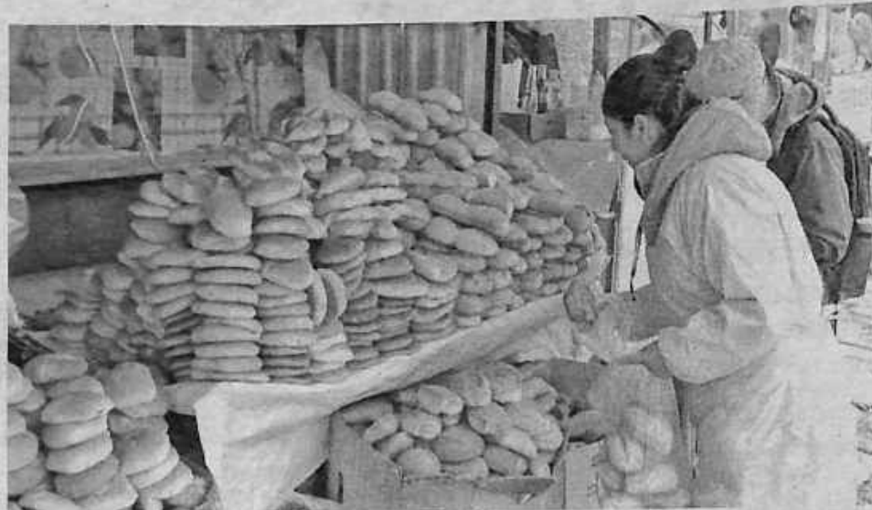
Un puesto de venta de pan de batalla en la ciudad de Cochabamba.