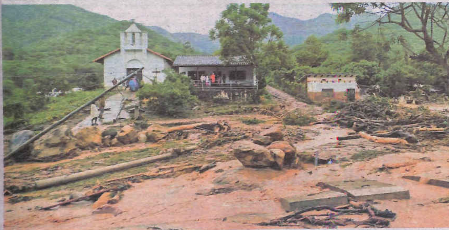
La inundación en Samaipata, en Santa Cruz, donde la población vivió ayer momentos de zozobra por la crecida de los ríos.

Desastre. Más de mil familias están afectadas y ocurrieron deslizamientos en los caminos al oriente. Los cultivos de banano están bajo el agua en el Chapare. Págs. 6-7