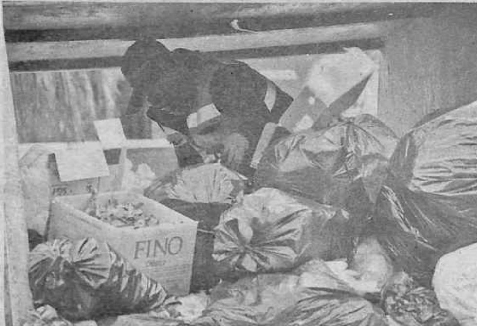
El manejo de la basura en los contenedores en la ciudad de Cochabamba.