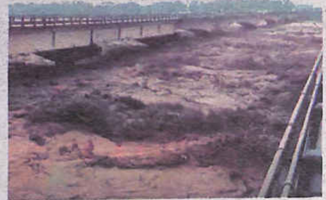
La crecida del río Sacta, en el trópico. SOBERANÍA