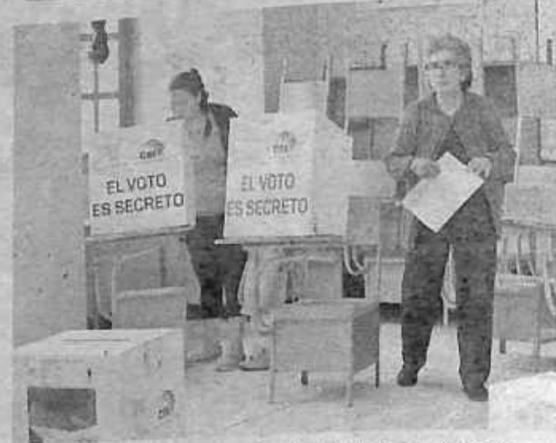
Dos personas votan en el referéndum, en Ecuador.

por Chile, en tanto, que integra el Partido Socialista, el Frente Amplio y el Partido Comunista, entre otras fuerzas políticas de centroizquierda y de izquierda, ha bajado de 72 a 61 diputados, perdiendo 11 escaños. Los verdes, regionalistas y humanistas -que aunque eran parte del oficialismo decidieron competir en solitario, lo que Boric castigó sacándolos del Gabinete-, consiguieron tres diputados. Los dos pactos de izquierda, por lo tanto, llegan a 64 escaños de los 155. Están lejos de una mayoría. Tanto ellos como la derecha deberán en la Cámara Baja negociar con Parisi.