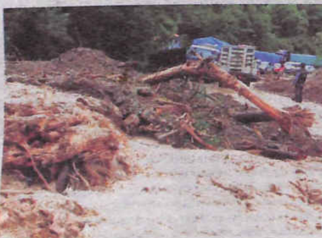
Vía completamente anegada por la riada.

Incomunicados. Los equipos de rescate y vecinos trabajan entre lodo y escombros tras la devastadora crecida en Samaipata; el municipio está incomunicado por tierra y el clima impide la ayuda por aire.