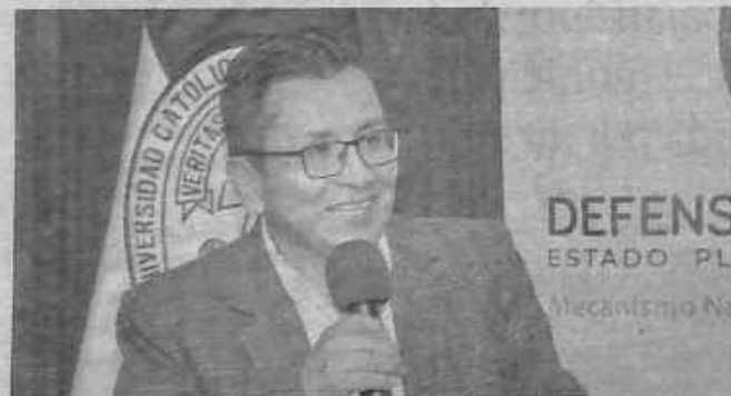
El Defensor del Pueblo, Pedro Callisaya Aro.

Sugerencia. La Defensoría del Pueblo plantea que la reforma judicial en Bolivia debe asumirse de forma estructural.