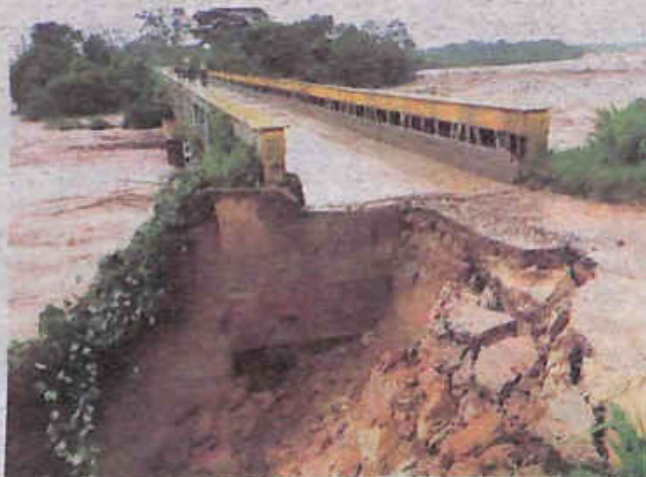
Crecida del río Pirai supera los 6 metros de altura.

"Hemos estado coordinando con Samaipata, con el director del hospital, y están evacuando a los cuatro pacientes que están en estado grave a Mairana. También ya se declaró la alerta roja en estos municipios y se está trayendo tanto al cirujano, al anestesiólogo, tanto de Vallegrande como de Comarapa", expresó la autoridad.