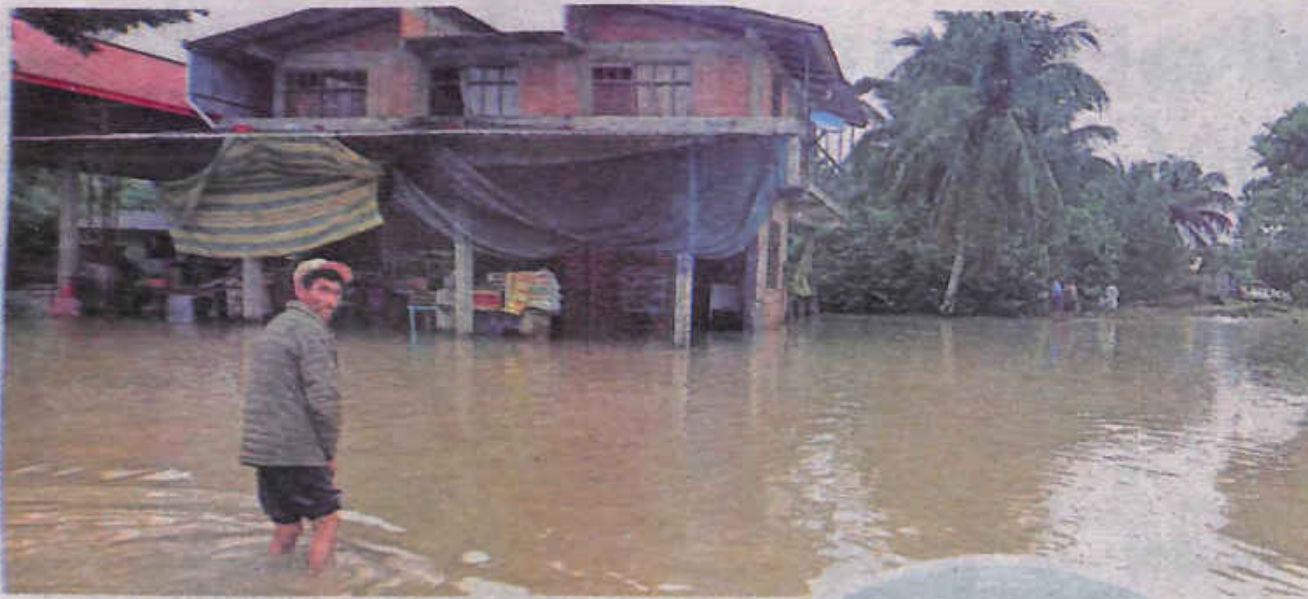
Las casas en medio del agua en Villa Tunari. SOBERANÍA