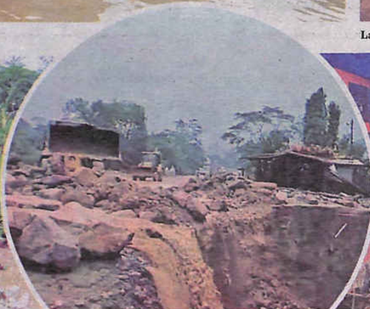
Maquinaria en el deslizamiento de 7 Curvas. SOBERANÍA