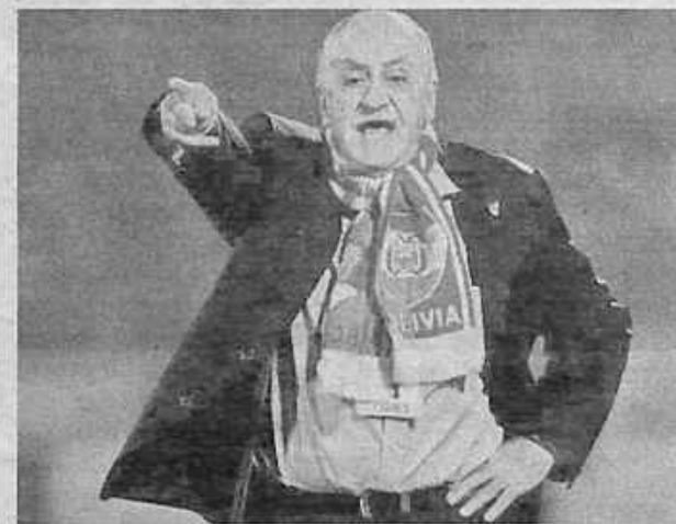
El DT Xabier Azkargorta. CLUB BOLIVAR

El DT falleció el 14 de noviembre y fue enterrado el domingo en Santa Cruz.