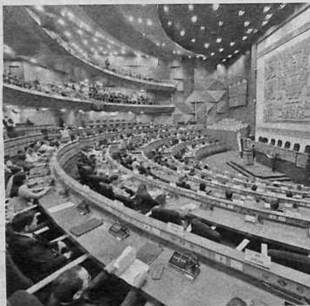
El pleno de la Cámara de Diputados. ABI

El plan inicial del TSE era convocar a elecciones para el 15 de marzo, pero la demora legislativa hizo imposible mantener ese cronograma. “El 22 de marzo sería la fecha límite, to-