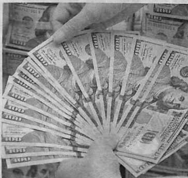
Los créditos internacionales vienen a Bolivia en dólares.

Díaz-Granados explicó que este préstamo de liquidez que CAF pone a disposición de Bolivia en el corto plazo, consolida la institución como el primer