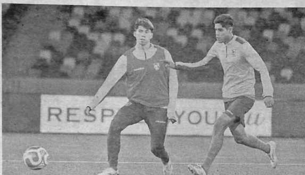
La Selección Nacional se prepara para enfrentar a Japón.