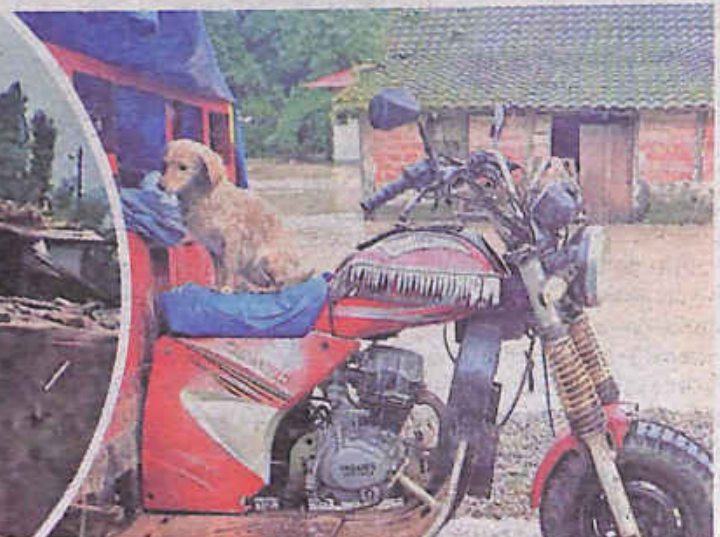
Una mascota busca refugio por la inundación. SOBERANÍA