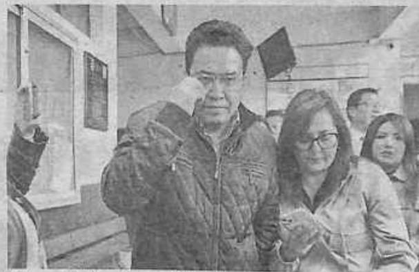
El exministro de Justicia, César Siles.

Las sugerencias para los cambios en la legislación están contenidos en su propuesta "Una reforma judicial con enfoque de Derechos Humanos", la institución sostiene que cualquier proceso de cambio debe centrarse en garantizar los derechos fundamentales y en superar la crisis estructural que afecta a la justicia boliviana. La Defensoría propone también una revisión profunda de la Ley de Deslinde Jurisdiccional, así como nuevas normas para la justicia agroambiental.