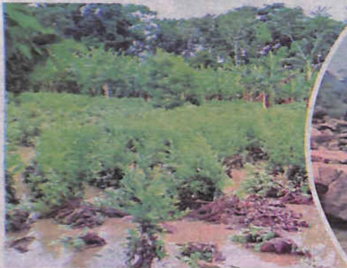
Las plantaciones anegadas en el trópico. EL DEBER