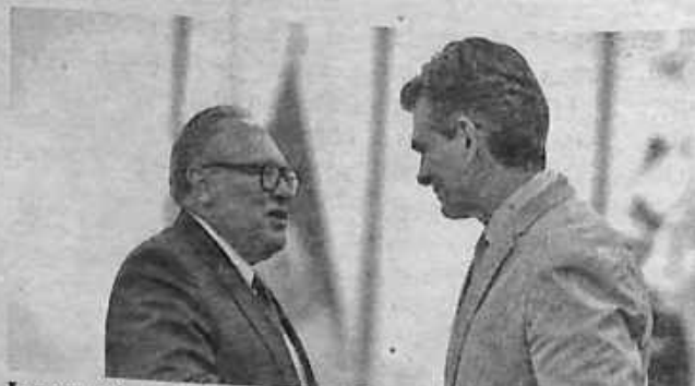
La posesión del ministro Marco A. Calderón de la Barca, ayer. MMB

El presidente Paz insistió en la necesidad de eliminar el "Estado tranca" e impulsar en su lugar un "Estado ágil, flexible, rápido e inteligente" que "pueda colaborar a todos estos sectores para que aporten a la patria, y nosotros ayudar en la construcción y desarrollo del sector".