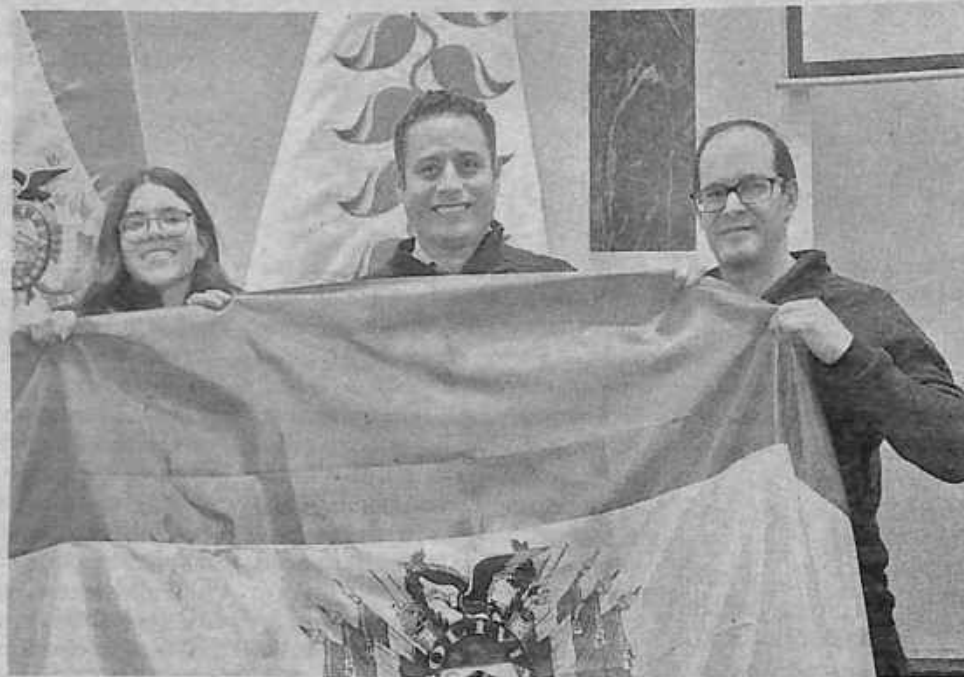
La entrega de la tricolor nacional a los deportistas que irán a los Bolivarianos.