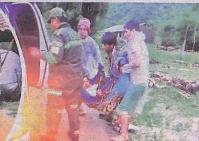
Evacúan pacientes a Mairana, ayer.