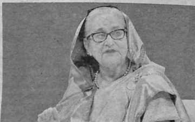
La exprimera ministra de Bangladesh, Sheikh Hasina.

Hasina, quien comenzó su carrera política como ícono del movimiento prodemocrático, fue declarada culpable en ausencia por ordenar el uso de fuerza letal contra los manifestantes durante las protestas que terminaron en su destitución y en las que murieron 1.400 personas, la