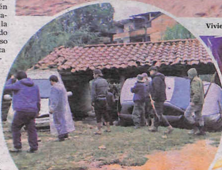
Auto volteado por la fuerza del agua.