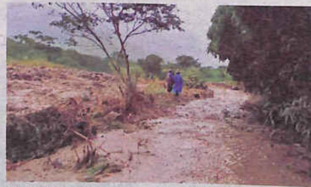
El agua ingresa con fuerza a los caminos. DEFENSA CIVIL

Las intensas lluvias también generaron deslizamientos que obligaron al cierre total de varios tramos de la carretera nueva Cochabamba-Santa Cruz. Los puntos