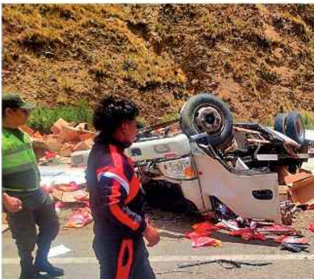
ACCIDENTE. Un policía y una persona observan los destrozos.