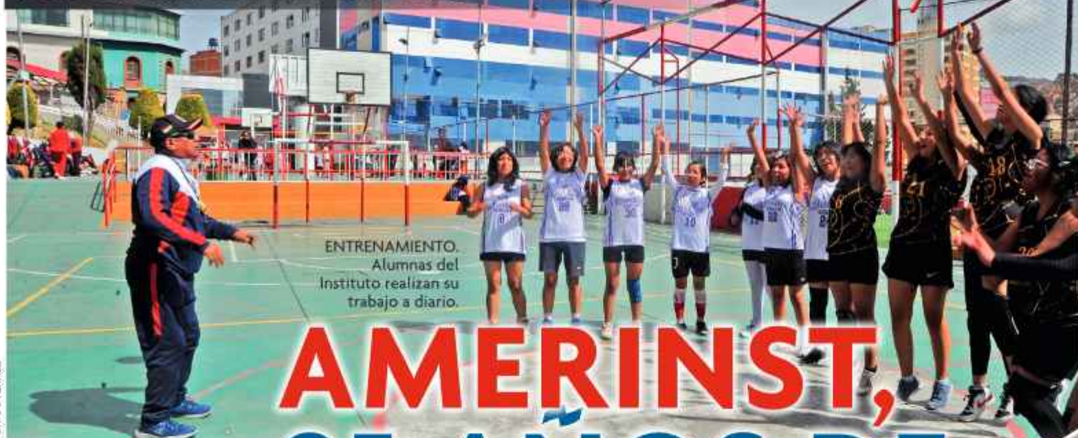
ENTRENAMIENTO. Alumnas del Instituto realizan su trabajo a diario.