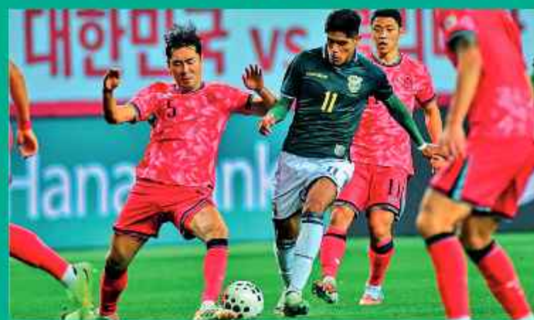
PARTIDO. Los jugadores de la Verde en el partido contra Corea del Sur.