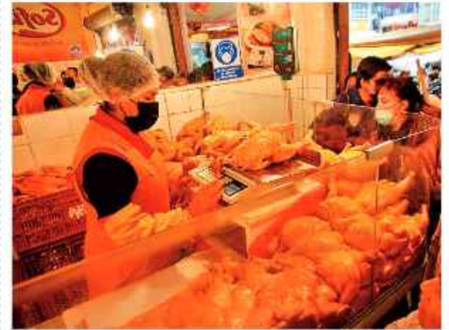
VENTA. Varias personas aguardan comprar carne de pollo.

La Paz volvió a quedarse sin su principal patrimonio alimenticio, la marraqueta. El problema ya se había presentado mucho antes del cambio de gobierno, cuando la gestión saliente dejó de entregar el principal insumo a precio subvencionado, la harina, a los panificadores. La falta de este producto obligó a los panaderos a reducir su producción hasta que en pasados días decidieron suspender su elaboración y optar por reemplazar por las denominadas sarnitas a un precio de 0,50 bolivianos, pero con un tamaño reducido.