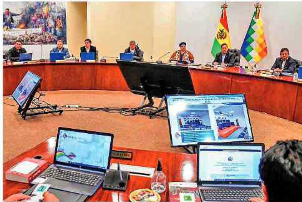
GABINETE. La última reunión del Gabinete que promulgó la Ley de Diferimiento de Créditos.

Entre las razones de este Decreto se establece que el artículo 62 de la Constitución "determina que el Estado reconoce y protege a las fa-