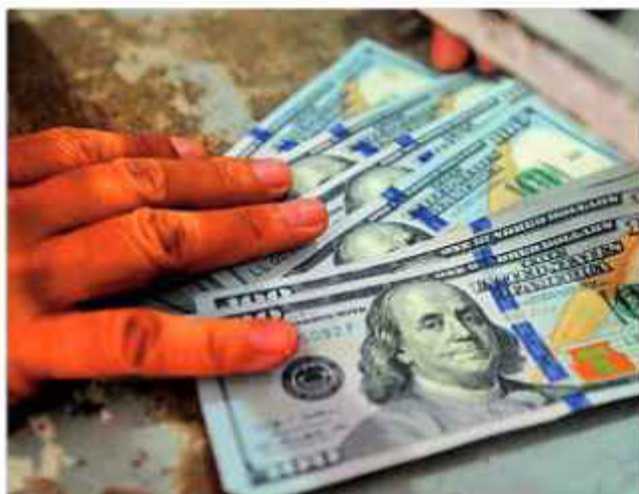
BILLETES. Una persona entrega billetes en una institución.

A las razones expuestas por esta autoridad se suman los anuncios del presidente electo Rodrigo Paz, quien recientemente llegó de Estados Unidos, donde los organismos financieros comprometieron su apoyo material para que Bolivia enfrente el proceso de reformas que sobrevendrán, luego de casi 20 años del plan económico del Movimiento Al Socialismo (MAS). La autoridad electa confirmó que el Banco de Desarrollo de América Latina (CAF), comprometió un crédito de 3.100 millones de dólares, de los cuales al menos un 15 por ciento se pondrá a disposición en el corto plazo.