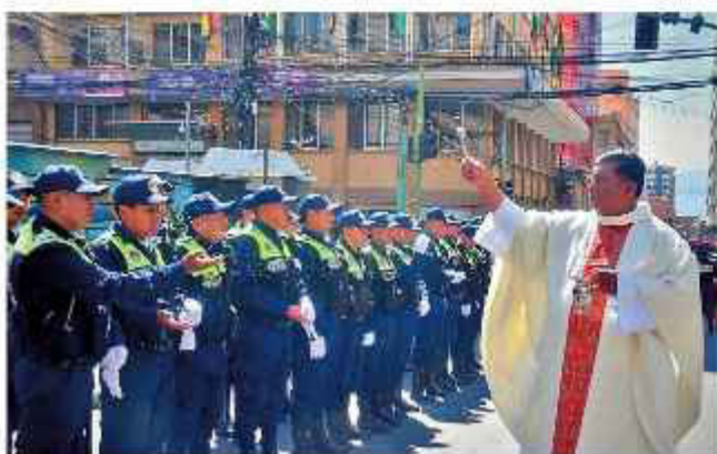
DESFILE. Los efectivos ediles estuvieron en la celebración.