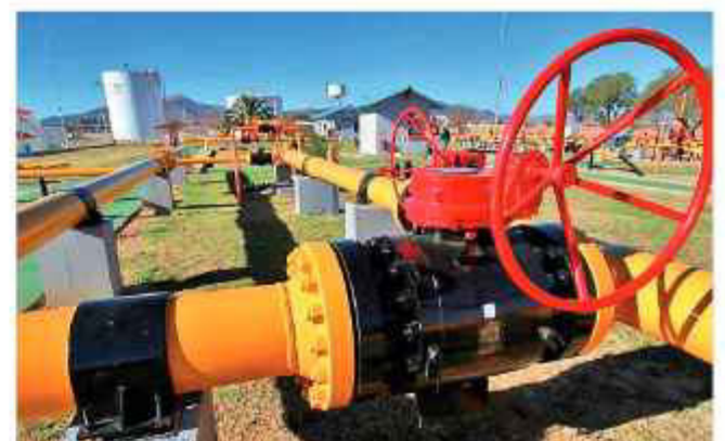
DUCTO. Parte del gasoducto que va de Bolivia a Argentina.

En el caso de las ventas a Brasil se observa una menor demanda del energético boliviano debido a que ahora es Argentina el país que provee este producto al gigante sudamericano.