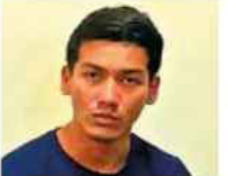
VIOLENCIA. El autor confesó el crimen.