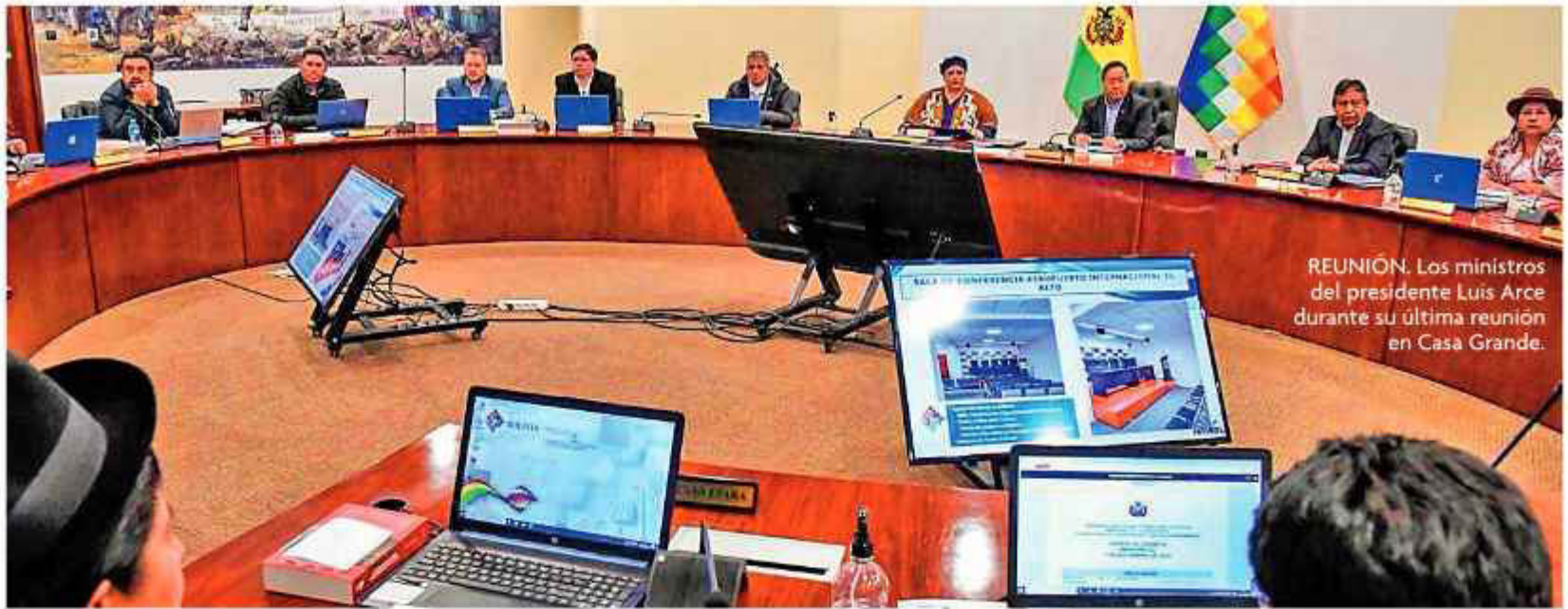
REUNIÓN. Los ministros del presidente Luis Arce durante su última reunión en Casa Grande.