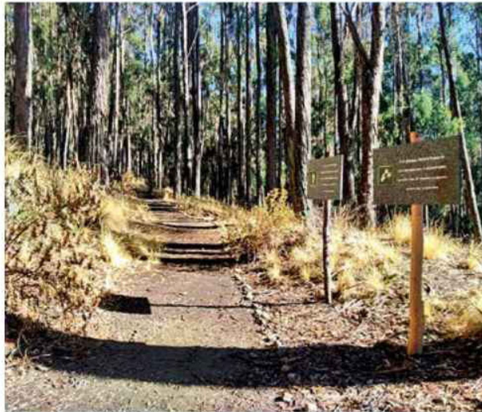
ESCENARIO. El cuerpo de la mujer quedó en este bosquecillo.

"Los testigos vieron que la víctima estaba durmiendo mucho tiempo y cuando intentaron hacerla reaccionar se percataron que estaba sin vida", dijo el Fiscal.