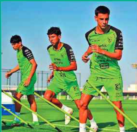
EN CATAR. Los jugadores de la Verdecita trabajan en el Complejo Al-Thumama.

"Vamos a hacer un partido muy inteligente, conocemos las fortalezas del rival, confiamos en plantear un buen cotejo, a fin de contrarrestar a Italia", dijo.