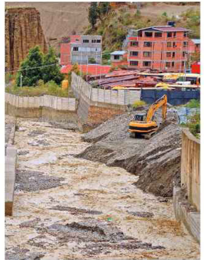
DIÉSEL. Maquinaria pesada trabaja en un río de la zona Sur.