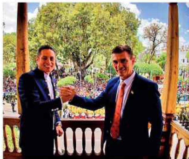
DETALLE. Paz y Lara agradecieron a Bolivia en un video.