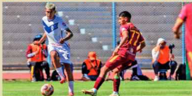
PARTIDO. Incidencia del partido jugado ayer en el estadio Bermúdez.

Gualberto Villarreal-San José y Totora Real Oruro ayer empataron a un gol (1-1) en el estadio Jesús Bermúdez, de Oruro, escenario en el que pocos espectadores observaron el cotejo válido para la vigésimo cuarta fecha del torneo de todos contra todos.