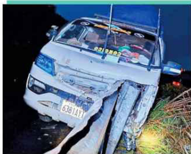
TRAGEDIA. El minibus quedó incrustado en la baranda.