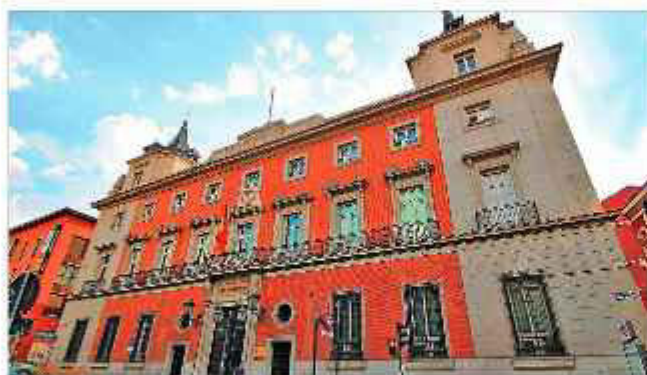
IMAGEN. Fachada del Ministerio de Justicia en La Paz.