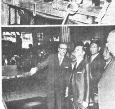
VISITA A FABRICA: Las fotografías corresponden a dos sesiones de las visitas que el Presidente Banzer realizó ayer en la fábrica de la Fábrica de Vidrios, de la que se departió con los trabajadores y empresarios, que le informaron sobre el proceso de fabricación que allí se realiza.

El Ministro del Interior advirtió que a la necesidad de "no justificar ningún hecho criminal que nos sitúe en el nivel del barbarismo".