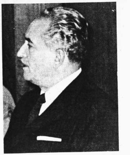
CANCILLER MARIO GUTIERREZ: Ante la Asamblea de las Naciones Unidas expuso ayer la posición de Bolivia respecto a importantes problemas mundiales.