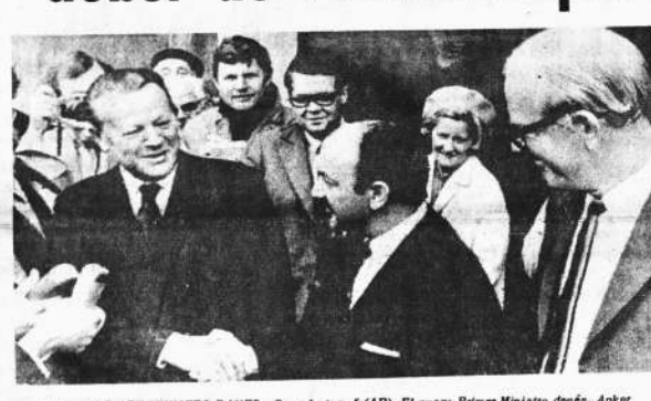
NUEVO PRIMER MINISTRO DANES.-Copenhague, 5 (AP). El nuevo Primer Ministro danés, Anker Jørgensen, centro, estrecha la mano de su predecesor, Jens Otto Krag, izquiera, en Copenhague. A la derecha del Canciller K.B. Andersen.