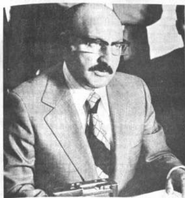
CONFERENCIA: Cnl. Mario Adelt Zamora, Ministro del Interior, quien afirmó que el gobierno que preside el Cnl. Hugo Banzer está en la línea de ningún extremismo, hizo conocer las pautas bolivianas en la Conferencia de Ministros de Justicia, para combatir, mediante leyes multinationales, la elaboración y tráfico de drogas y el terrorismo en todas sus formas.