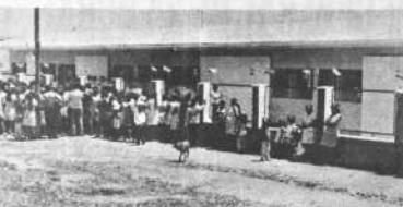
Esta es una vista parcial del Colegio Guillermo Añez, recientemente entregado al servicio de la niñez, en la localidad cruzada de San Javier.