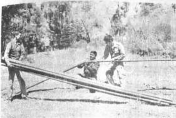
INSTALACION.- Los cadetes del Liceo Militar cooperaron en la instalación de la cisterna Plasmarm que fue renovado el sistema de agua en este instituto.