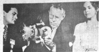
UN PRESENTE. Phoenix, Arizona, 4 (AP).- El presidente de México, Luis Echeverría fue abducido con una muñeca kachina durante las ceremonias en la Plaza Cívica de esta ciudad. El representante de Echeverría, recibió el presente a nombre del jefe del Estado mexicano. En la foto Jack Williams y la señora Julie Nixon Eisenhower.