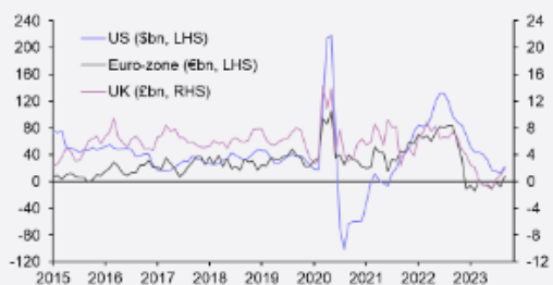
Gráfico 1: Préstamo bancario neto al sector privado (3MMA)