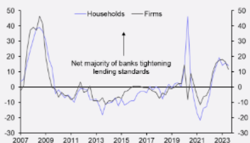
Gráfico 3: Porcentaje neto de bancos que, en promedio, informan criterios más estrictos para los préstamos en el G4