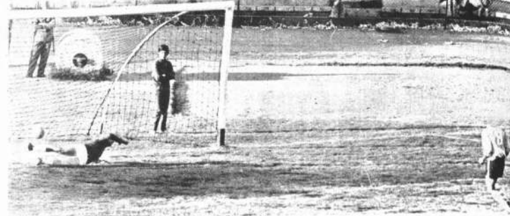
EL EMPATE. Para concreta en gol el penal sancionado por el árbitro Riveros, derrota al arquero Escobar y estableciendo el empate de 1 a 1 entre 31 de Octubre y Bolívar. Los celestes no avanzan más.

de sus dos punteros titulares. 31 de Octubre tiene un error repetido: quiere conservar una magna ventaja con un ritmo demasiado lento y sin mantener la continuidad. Su gente se queda demasiado y se confía exageradamente. La labor de Riveros fue buena.