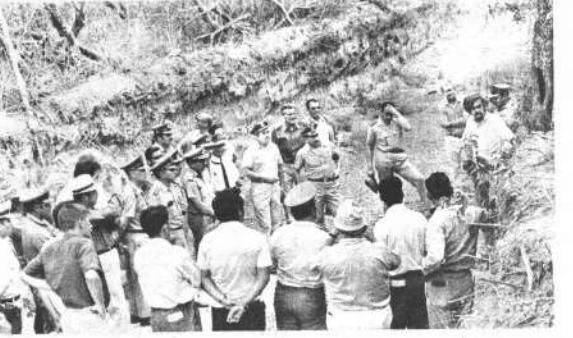
MUESTRA DE SUELOS. Las tierras que han sido escogidas por el proyecto Abapó-Izoq han sido investigadas en todos sus detalles, se ha comprobado que son las más aptas para la agricultura y de primera calidad. En la escena fotográfica, las autoridades militares reciben una información del técnico en suelos que realiza experimentos en esa especialidad.