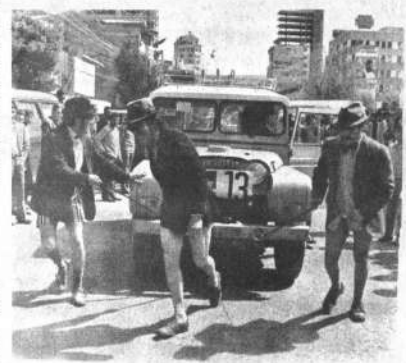
MINI-RALLY. Tres tripulantes de un jeep que participó en el Mini-Rally, tienen que "jalar" su coche por disposiciones de la reglamentación especial y con trajes muy "originales".

En Cochabamba: Ayacucho y Aurora empataron 1-1, mientras Wilsterman y Litoral igualaron también en 2 goles. En Oruro: Ros venció a Litoral 3-1 y San José a Oruro Royal por 5-1.