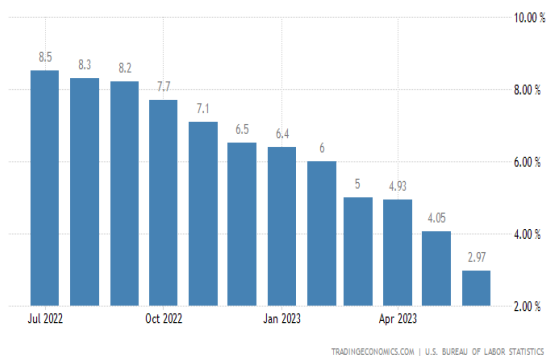
IPC EE.UU.: últimos 12 meses (en % YoY)