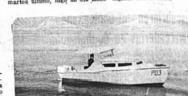
Contrabando en el Lago Titicaca

Los propietarios de la Joyería "Hotel La Paz", ubicada en la Av. Camacho esquina Colón, estaban comprometidos en contrabando de divisas, al igual que otros comerciantes que fueron descubiertos por organismos del Ministerio de Finanzas.