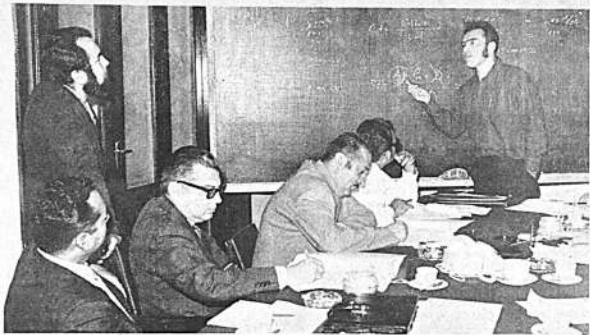
Aumento de regalías en favor de Santa Cruz

Santa Cruz, 14 (PRESENCIA).—El Comité de Obras Públicas de Santa Cruz percibirá un notable incremento en las regalías petroleras que sobrepasarán los 300 mil dólares anuales según se informó oficialmente a PRESENCIA.