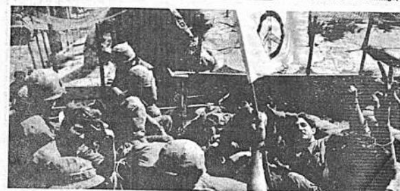
BANDERA DE LA PAZ. Vietnam del Sur, 14 (AP).- Soldados norteamericanos izan la bandera de la paz y hacen la señal "V" mientras esperan salir de una prisión de alta Heráclida sur de la zona desmilitarizada en Vietnam del Sur. (Radiofo to AP especial para PRESENCIA).