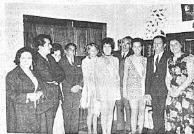
Un aspecto de la fiesta que, tradicionalmente ofrece la Alianza Francesa de La Paz, en ocasión de celebrar la Fiesta Nacional de Francia.