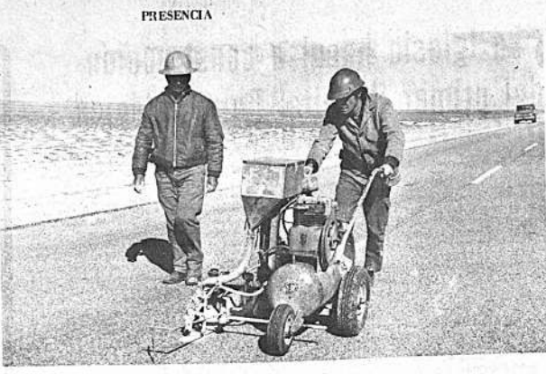
INAUGURACION. El próximo sábado se inaugurará oficialmente la carretera entre La Paz y Oruro. En la fotografía se observa a empleados de la empresa Barrios dando los toques finales a la obra. La importante vía de comunicación tiene una longitud de 216 kilómetros. Está construida para que los vehículos desarrollen una velocidad directa de 100 kilómetros por hora. A la ceremonia de inauguración asistirá especialmente invitado el Presidente de la República, Juan José Torres, miembros del Gabinete invitados de varias representaciones diplomáticas acreditadas en Bolivia.

La Dirección Nacional de Altabetización y Educación de Adultos informó ayer que se otorgarán diplomas de bachiller por madurez y suficiencia de los posgraduados.