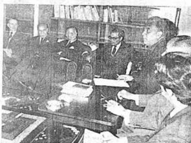
Una escena de la fundación del Instituto Boliviano Venezolano de Cultura, realizada ayer.