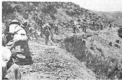
TARIJA. - Construcción de camino carretero San Lorenzo Pílaya. Beneficiará a campesinos productores agrícolas de las 2 comunidades. Intervinieron 290 trabajadores voluntarios. Institución cooperadora: Caritas Boliviana con a linentos.