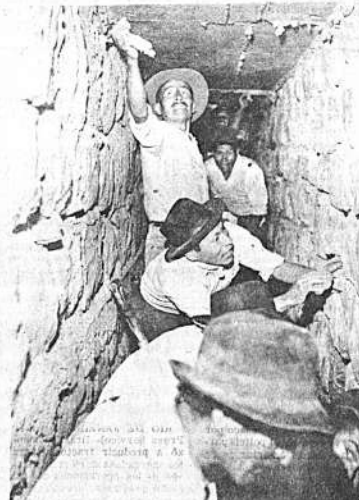
Vista interior de la galería filtrante. Tiene un alto de 1.70 m. por 0.80 de ancho. Está construida de piedra y cemento armado, a una profundidad de 20 m. debajo del río Choco. Intervinieron 600 trabajadores voluntarios. Instituciones que cooperaron: Caritas Boliviana y Prefectura de Cochabamba.

NOSOTROS PREGUNTAMOS: ¿Este servicio tiene algo de ALIENANTE?