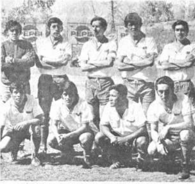
DIAMANTES. Plin del Diamante que actuó en el torneo de Primer B. En la última fecha superó a Olympic con todo el club y completó las posiciones de vanguardia.

am, contará con la presencia de la primera autoridad departamental, autoridades deportivas y la prensa especializada para lo que se está cursando las invitaciones correspondientes. Habrá una concentración y desfile de las delegaciones participantes. La Prefectura del Departamento, como organizadora de estos eventos, está facilitando la ayuda económica correspondiente para la efectivización y el éxito de estas jornadas deportivas.