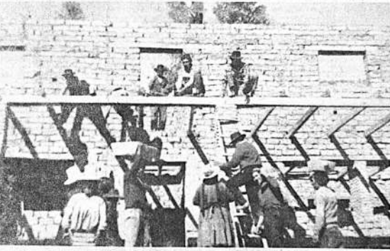
POCOATA, Arani (Cochabamba). - Construcción del Colegio Laboral de la comunidad. Dos plantas, 3 aulas y patio. Intervinieron 180 trabajadores voluntarios entre hombres y mujeres. La obra empezó en agosto de 1969 y fue concluida a fines de 1970. Caritas Boliviana cooperó con alimentos y transporte.