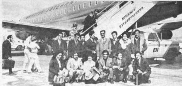
Una delegación compuesta por estudiantes del último curso de la Facultad de Economía de la UNSA...