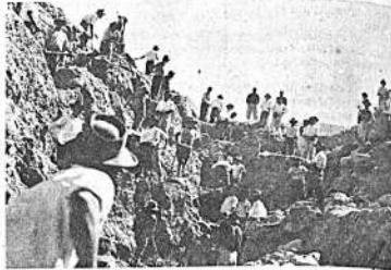
Trabajadores voluntarios construyendo una galería filtrante para riegos. Extensión: 380 metros. Localidad: Sipe-Sipe (Cochabamba). Obra terminada en 1970 después de 4 años de trabajos en épocas de sequía. Beneficia a 21 comunidades de campesinos agricultores.