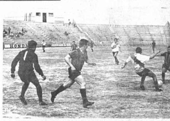
ATAQUE DE MAESTRANZA. Un cargo de Unión Maestranza frente a la valla de Paz, departamento de Always Ready. Ganaron los provincianos por 2 a 1 en equilibrio encuentro.