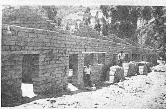
ARANI, (Cochabamba). - Construcción de una escuela mixta en Pocoata central. Capacidad: 7 aulas en una planta. Obra terminada y que fue entregada en marzo de 1970. Instituciones cooperadoras: Caritas Boliviana con alimentos y transporte y Prefectura de Cochabamba con material.