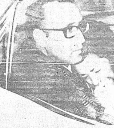
DEUDOS DE PEREZ ZALDIVAR.- Santiago de Chile, 9 (AP). - La viuda del asesinado ex-ministro del interior chileno Edmundo Pérez Zaldívar llora en las horas fúnebres de su hijo al sol del Hospital Militar de Santiago donde expiró su marido después del ataque.

Advirtió que "tenemos, y ojala nos equivocamos, que por el camino del odio y de los asesinatos, en lugar de una patria más justa y más acogedora para todos, nos encaminamos a la destrucción de los valores más nobles de Chile". Dijo que "los chilenos tenemos que escoger nuevamente nuestro camino" y que la iglesia católica "levanta su voz para que todos los ciudadanos se unan en la búsqueda de la convergencia nacional."