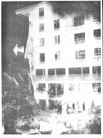
EXPLOSION.- Auch, Francia, 4 (AP).- Murieron hoy temprano 16 personas cuando una explosión destruyó un edificio moderno de hormigón y un caso pequeño al otro lado de la calle. Se cree que la explosión se debió a una fuga de gas combustible. De los víctimas tal vez 11 son niños. Diez personas sufrieron heridas pero no de gravedad. Entre los muertos hay miembros de tres familias. En la fotografía la flecha señala cómo quedó la pared del edificio de oficinas de apartamentos.