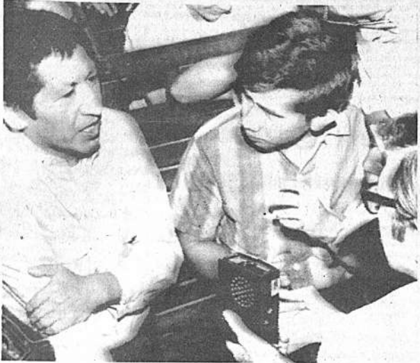
MENDOZA CON PERIODISTAS.- Manila, enero 4 (AP).- El pintor boliviano Benjamín Mendoza Amor, izquierda, acusado de haber intentado asesinar al Papa Paulo Sexto en el aeropuerto de Manila el 17 de noviembre pasado, habla con periodistas hoy durante un pausa en el juicio. Después de declarar un testigo que el Papa recibió dos golpes en el pecho se aplazó el juicio hasta el día 13.

SANTIAGO DE CHILE, 4. - (AP). El establecimiento de relaciones diplomáticas con Perú será anunciado mañana, según pudo saberse en fuentes gubernamentales dignas de crédito. Sin embargo, no pudo conseguirse confirmación oficial, a parte del anuncio de la cancelaría que al mediodía de ayer se difundió un "comunicado muy importante". Al mismo tiempo, se citó a los periodistas a una conferencia de prensa con el Ministro de Relaciones Exteriores, Ciodomiro Almeyda, para las 16.00 horas (1600 est), la entrega del comunicado será a las 19.00 est. El Presidente Salvador Allende había dicho la semana pasada que en 5 de enero haría un anuncio de importancia al hablar al país desde el vecino puerto de Valparaíso, a donde trasladará las oficinas presidenciales por un mes a partir de mañana. Si como se espera se anuncia mañana el reconocimiento de China Comunista, sería la segunda nación comunista con la que Allende establecería relaciones diplomáticas desde que asumió el mando hace dos meses y medio el noviembre pasado lo hizo con Cuba.