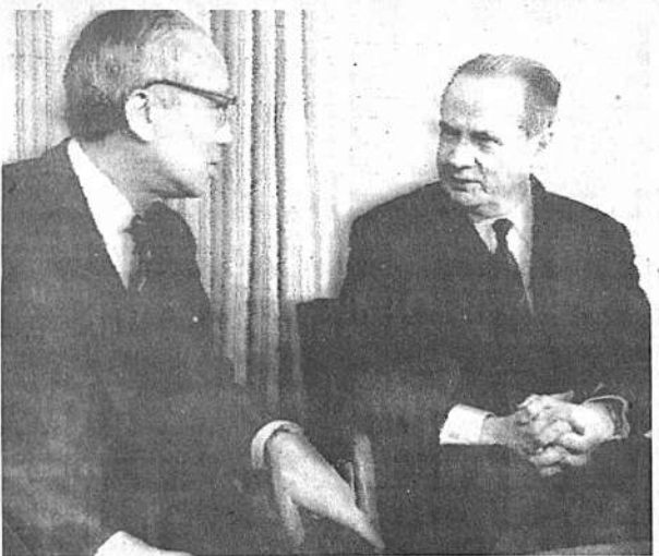
MEDIADOR.- Naciones Unidas, 4 enero 4 (AP).- El mediador de las Naciones Unidas en el conflicto de Palesina, Gunnar Jarra, derecho, habló hoy con el Secretario General U Thant en el despacho de éste.

M. Simbólicamente. Se le preguntó si se arrepentía de haber agredido al Pápa y contestó: "Pues, creo que no, porque lo hice con todos mis sentidos, y creo que necesitamos alguna clase de cambio, necesitamos un verdadero cambio. Tengo los más grandes proyectos... y tirar los a la religión en general". ¿¿¿ de los proyectos que tienen construir puentes transoceánicos y averiguar a que se deben los huracanes.