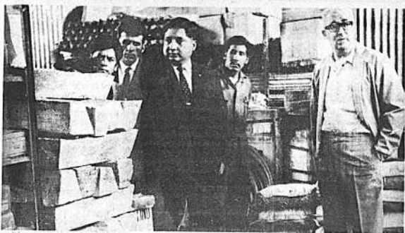
El Prefecto de Cochabamba, Abel Martínez Méndez, asistió a la entrega de materiales de construcción a dirigentes campesinos de diversas provincias, que hizo el coronel Mario Candia, Coordinador Campesino de Cochabamba, a nombre del Ministro de Asuntos Campesinos y Agricultura, coronel Hugo Céspedes. El Prefecto dijo que se entregaron más de 650 sacos de calamina y 140 bolsas de cemento, con destino a construcciones de escuelas y otros obras en las áreas rurales de Cochabamba.