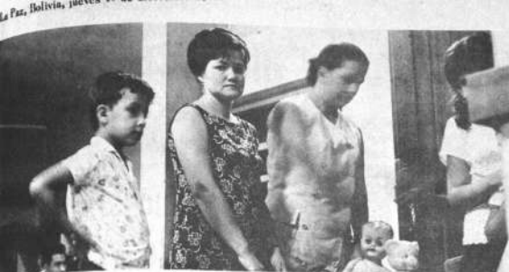
CAMPAÑA EN FAVOR DE NIÑOS POBRES. Un camión de donos de Comir desarralla un intenso campaña en favor de los niños pobres de esa localidad. La campaña consistió en organizar reuniones con el fin de recaudar fondos y juguetes que puedan ser entregados para la Navidad. Arriba, algunos donos recolectan juguetes.