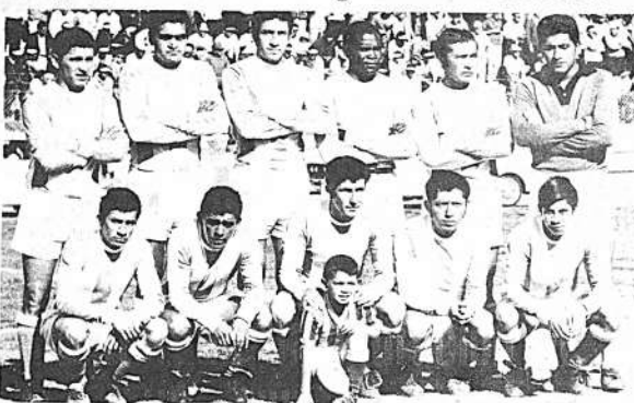
SUB-CAMPEÓN. Chaco Petrolero se clasificó sub-campeón del torneo oficial 1970, venciendo ayer a The Strongest por 2 a 1. Meritorio y esforzada campaña que tuvo como premio merecido el segundo puesto.