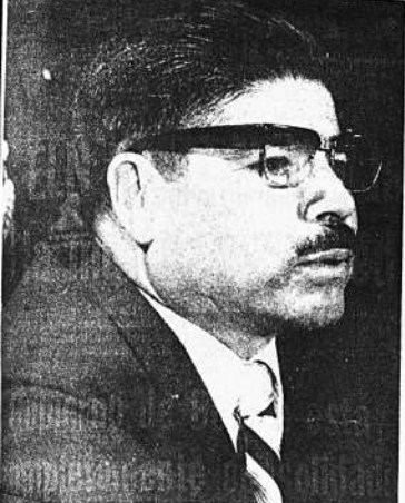
ESTABILIDAD ECONOMICA. Gral. Juan José Torres, en su primera conferencia de prensa, expresó optimismo ante el futuro económico de la nación. Se mantendrá la estabilidad económica y el tipo de cambio monetario no sufrirá cambios; se dictó la Ley de Inversiones y nacionalización de los monopolios económicos extranjeros. Toles. fueron sus anuncios.

Torres: monopolios económicos extranjeros serán nacionalizados