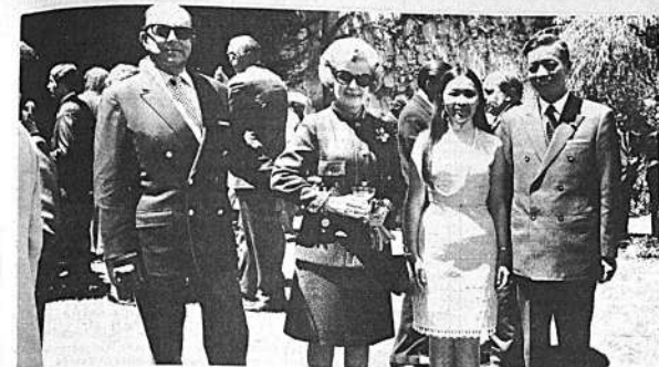
El Embajador de la República de China y la señora de Tsen, con el Embajador de España y la señora de Sánchez Mesa, durante la recepción que ofreció el Embajador de China con motivo de la Fiesta Nacional de su país.