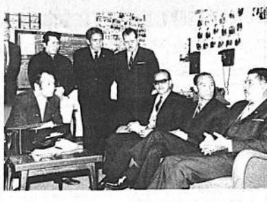
Dirigentes de la Federación Nacional y del Sindicato de Trabajadores de la Prensa de La Paz y del Comité Sindical de "El Diario", se entrevistaron ayer, en el Palacio de Gobierno, para buscar solución al problema surgido en esa institución, a raíz del abandono que hicieron sus propietarios y sus instalaciones quedaron en poder de los trabajadores de "El Diario". El Ministro Lupo adelantó que existe buena disposición gubernamental para solucionar el problema.

3.- Establecer medidas de defensa social, que permitan ser objeto de estudio y análisis de las empresas, de parte de fuerzas ilegales.