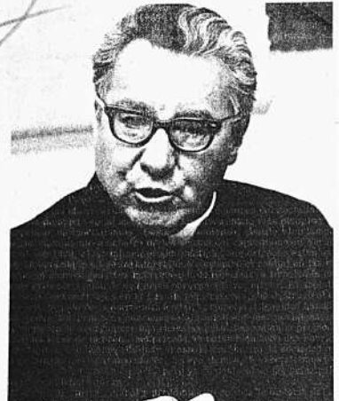
IGLESIA Y SOCIALISMO. Mons. Jorge Manrique, Arzobispo de La Paz, emitió ayer una importante exhortación pastoral en la cual hace conocer sus puntos de vista respecto socialismo.

Al señalar el Presidente, a través de las respuestas leídas, que buscará la mayor participación popular en su gobierno, expresó que adoptará medidas integrales en el orden económico en base a una estrategia del desarrollo. Al indicar que no existe peligro para una alteración del tipo de cambio monetario, dijo que entre las medidas inmediatas se incluyen el mantenimiento de la estabilidad económica y monetaria, la aprobación de la Ley de Inversiones para fomentar la actividad privada, otra ley que dispondrá la nacionalización de los monopolios económicos extranjeros.