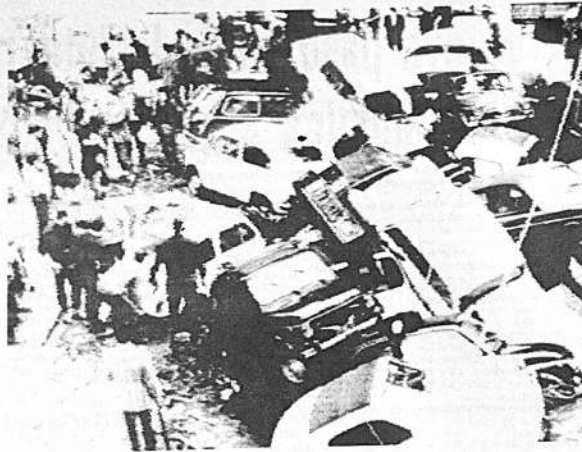
DESPUES DE LA INUNDACION.- GÉNOVA, 10 (AP).- Centenares de autos apilados después de la inundación de Génova. La inundación causó la muerte de por lo menos cinco personas (RADIOFOTO, EXCLUSIVIDAD PARA PRESENCIA, BOLIVIA).