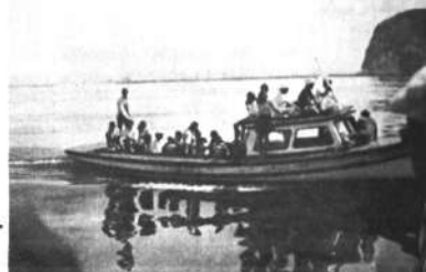
4.- Nuestros turistas, paseando por la Bahía de Azapa en la excursión de Carnavales.

EL SITIO IDEAL ES ARICA CON SU CLIMA DE ETERNA PRIMAVERA Y SU BELLA PLAYA.