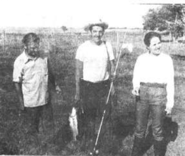
5.- En nuestro último Safari a Santa Rosa de Yacuma, nuestros turistas gozaron de la abundante pesca.