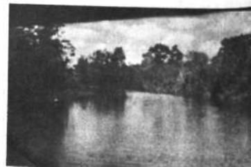
8.- Vista panorámica del bellísimo río Alto Beni.

LA NAVEGACION POR EL RIO ALTO BENI ES UNO DE LOS ESPECTACULOS MAS INTERESANTES E INOLVIDABLES. CONOCER LAS TRIBUS DE MOCETENES CON SU IDIOMA GUTURAL. FASCINANTE.