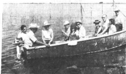
6.- Los turistas de nuestro último Safari al Beni paseando y pescando en el Lago de Santa Rosa.

NO ES EXAGERADO AFIRMAR QUE UN 95% DE LOS PACENOS, POR EJEMPLO, NO CONOCEN EL BENI. LA MAJESTUOSIDAD DE SUS RÍOS Y LA BELLEZA DE SUS BOSQUES Y LLANURAS DEBEN SER ADMIRADOS POR BOLIVIANOS Y EXTRANJEROS.