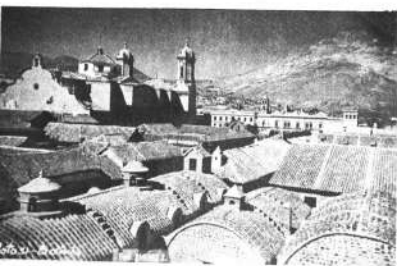
1.- En Potosí una Iglesia es más bella que la otra, pero lo inolvidable es la Casa de la Moneda.

Además en POTOSÍ visitamos el proverbial Cerro de Potosí. Las Iglesias de San Lorenzo, San Francisco, San Bernardo.