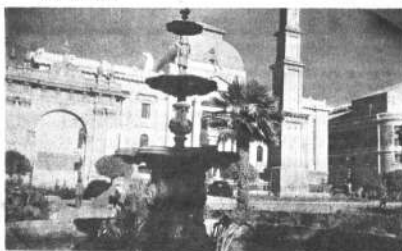
2.- Sucre está lleno de los monumentos más bellos de la Colonia, que todo boliviano debe conocer.

UN GUÍA LE ENSEÑARÁ LA JOYA DE AMÉRICA "EL ESCORIAL DE AMÉRICA" COMO LLAMAN A LA CASA DE LA MONEDA