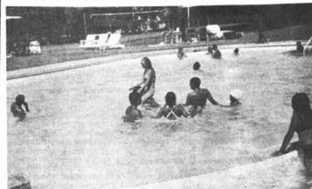
No. 3 Turistas de nuestra última excursión de Carnavales disfrutando de la bella piscina del Motel Azapa.

DISFRUTE DEL BUEN VINO CHILEÑO Y DE EXQUISITOS MARISCOS Y PESCADOS, PUEDE USTED TAMBIÉN DISTRAERSE EN EL CASINO.