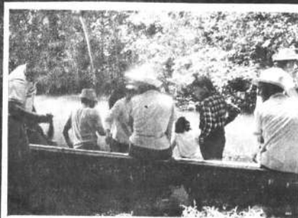
7.- Las orillas del río Alto Beni son de una belleza incomparable, como lo pudieron apreciar los turistas de nuestro anterior paseo.

Itinerario: Salimos de La Paz en Bus el miércoles 5 para almorzar en Coroico y dormir en Caranavi. El jueves 6 después de pasear Caranavi salimos rumbo a Puerto Lineres donde nos embarcamos en lanchas hasta nuestros cabanos en los márgenes del hermoso río Alto Beni. Una exquisita parillada nos espera para después hacer pequeños paseos por el río y los alrededores.