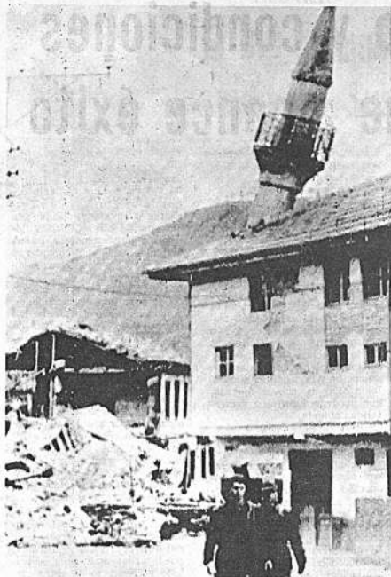
MEZQUITA DE 600 AÑOS DAÑADA.- En la fotografía se observa el Minarete caído en una mezquita de 600 años de antigüedad en Gediz, Turquía, que se apoyó en otro edificio. El daño fue ocasionado por el terremoto que devastó la localidad y mató a gran cantidad de personas.

Todavía no fue posible establecer si los otros dos sujetos detenidos son policías. En la jefatura de la repartición no se suministró ninguna información a la prensa. El Subjefe de Policía se negó a recibir a los periodistas.