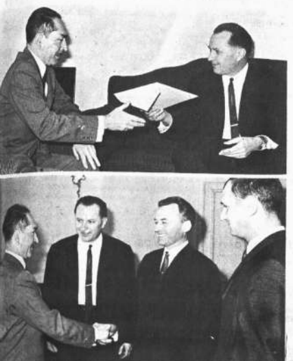
El Canciller César Ruiz recibe las copias de las cartas credenciales del primer embajador soviético en el país, Aleksei Schervacovich Florianovich. Abajo, el embajador ruso presenta al Ministro de Relaciones Exteriores el primer cónsul general de la URSS en La Paz y al primer secretario a la embajada soviética.

Concluyó anunciando oficialmente que el embajador Aleksei Schervacovich Florianovich presentará el próximo miércoles 8 del presente sus cartas credenciales al Presidente de la República.