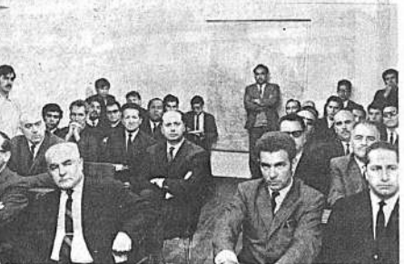
La fotografía muestra parte del personal de trabajadores del servicio de telecomunicaciones que asiste, desde ayer, al Instituto Nacional de Telecomunicaciones, para recibir enseñanza sobre problemas electrónicos.