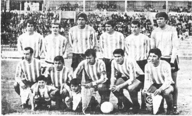
MARISCAL SANTA CRUZ. El conjunto albiceleste tratará de asegurarse el primer puesto del torneo Ganadores de Copa, esta noche, frente a Unión Española, el otro puntero de la competencia.