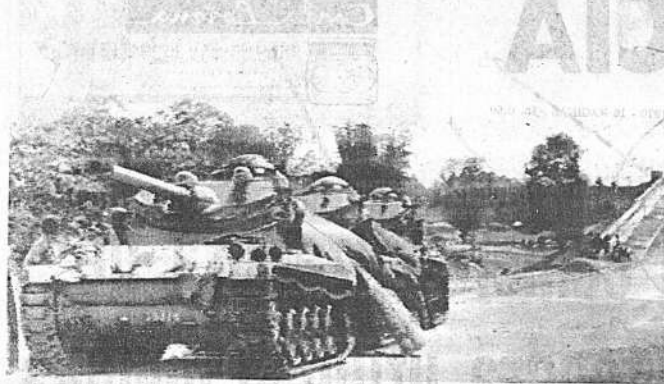
TANQUES EN AFUERAS DE PHNOM PENH. Tres tanques pesados están estacionados cerca del puente sobre el río Mekong-Bassac, en las afueras de la capital de Camboya. Se han establecido puestos militares de control alrededor de la ciudad.