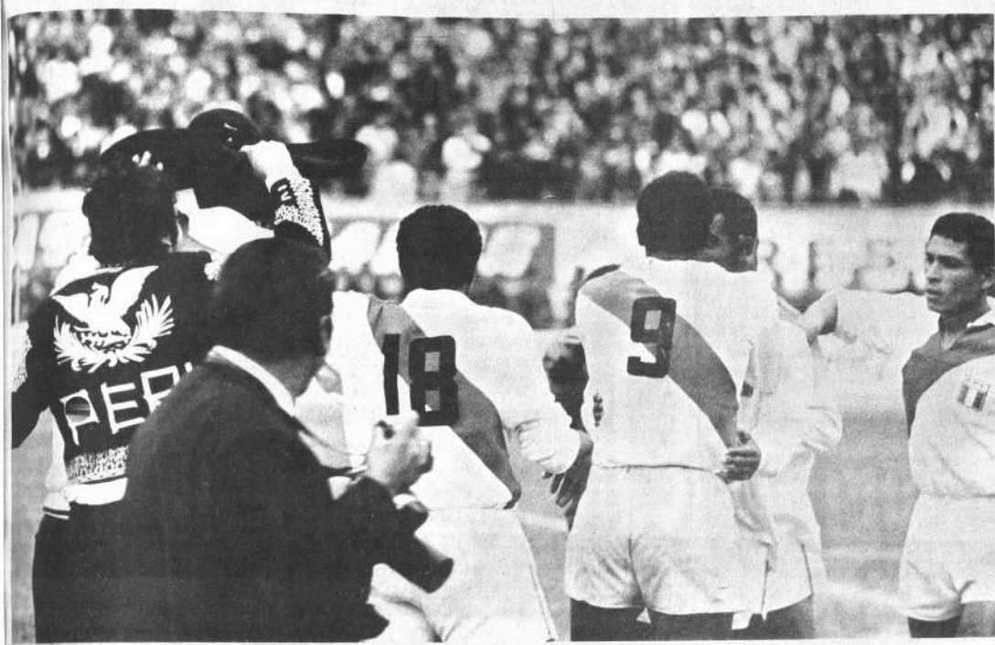
PERU A MEXICO. El charro que aparece en la foto, celebrando el triunfo peruano, simboliza la clasificación peruana para el mundial de México en 1970. El elenco del Rimac fue el mejor equipo del grupo 10 y su clasificación está justificada. Bolivia hizo un gran papel, y Argentina defraudó.