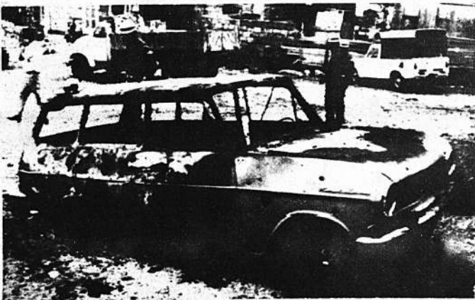
ATENTADO DINAMITERO.—La policía israelí acordonó un estacionamiento que fue objeto de un atentado dinamitero por parte de las fuerzas guerrilleras palestinas, una bomba destruyó el automóvil de primer plano. El atentado ocurrió en Haifa.

Arthur Bottomley, ex-Secretario británico del de la Mancomunidad Británica de Naciones, dijo que mientras por una parte la frontera no entraba en las discusiones para resolver los actuales problemas irlandeses, el Primer Ministro Jack Lynch tiene derecho a insistir en que no es posible una solución a largo plazo mientras la frontera permanece en pie.