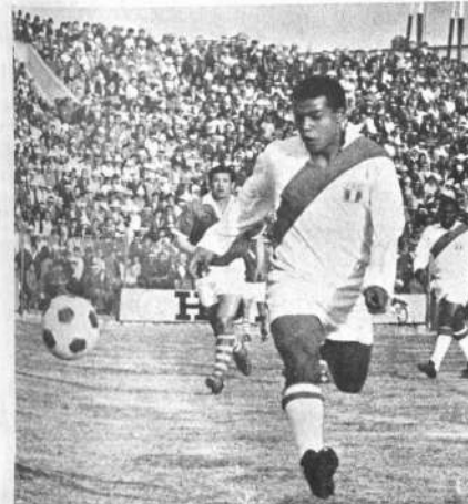
GRAN VALOR. Cubillas, el número 10 de Perú, fue un gran valor de la ofensiva de los albirrojos a través de la campaña en el grupo 10 de la zona sudamericana, que concluyó ayer.

Buenos Aires, 31 (AP).— "Soy uno de los alumnos que vinimos a competir con los maestros y recibimos nuestro certificado de graduación para México", dijo el