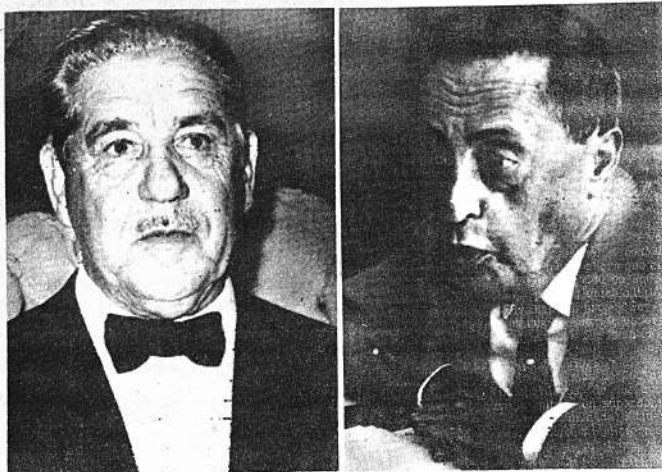
PRESIDENTE Y VICEPRESIDENTE BRASILEÑOS NO ESTAN EN FUNCIONES.—El Presidente del Brasil, Gral. Arturo do Costa e Silva, izquierdo, sufrió una embolia cerebral que lo incapacita para seguir desempeñando sus funciones. A la derecha aparece el Vicepresidente Pedro Aleixo, a quien los jefes militares que constituyeron una Junta Militar, presidida por el Almirante Rademaker, no le tomaron en cuenta para la sucesión presidencial.