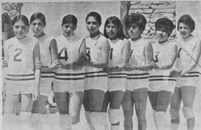
CHACO PETROLERO.- El juvenil equipo de Chaco Petrolero que perdió ayer con Simón Bolívar por 2-1, en una nueva fecha del campeonato de vólibol correspondiente al presente año.