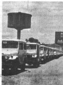
Una vista de los jeep taxis que ingresaron al servicio público en la ciudad de Santa Cruz.

PAPELETA FISCAL. En otra parte de su entrevista con PRESENCIA, manifestó que entrará en vigencia en este departamento la papeleta fiscal, que hasta la fecha era ignorada en las actividades comerciales de aquí. El Ministro dijo que se ha llegado a un acuerdo positivo con los representantes del comercio crucesino para la implantación de las facturas sobre ventas.