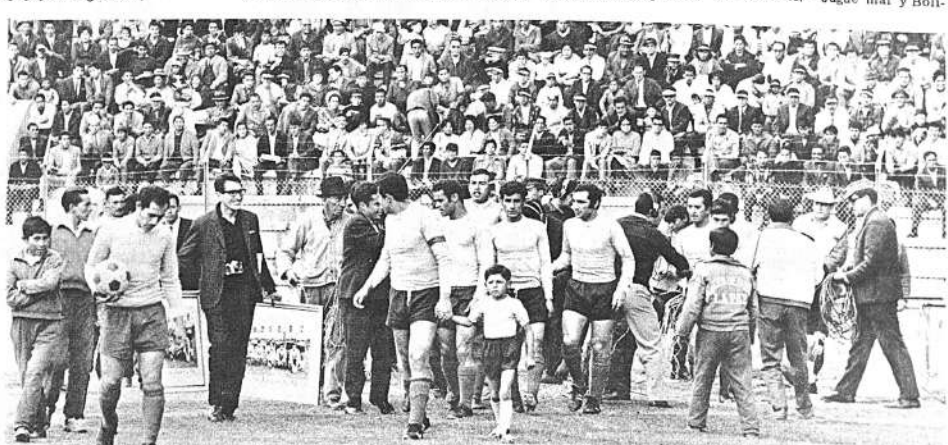
INGRESAN LOS CELESTES.- Entra Bolívar al campo de juego para enfrentar a Litoral por la Copa Libertadores de América, deben mejorar mucho si quieren ofrecer resistencia a los paraguayos que llegan hoy.

LITORAL: Escalera: Tuvo tapadas de mérito. ZAMBRANA: Luchador y expeditivo. SOLIZ: Despejador y energético, buen valor. VARGAS: Tenaz en la marca aunque muy desordenado. BALCAZAR: Trabajó con ritmo parejo adelante y atrás. CASTELLON: No lució por trabajo con regularidad. LLADO: Algunas cosas buenas, pero sin ritmo. ROCHA: Trabajador incansable, factor del dominio de medio campo en el segundo tiempo. REVOLLO: Hábil para la gambeta corta. ARISPE: El otro hombre que gravitó con su trabajo de medio campo. CAMACHO: Le creó problemas a Cayo.