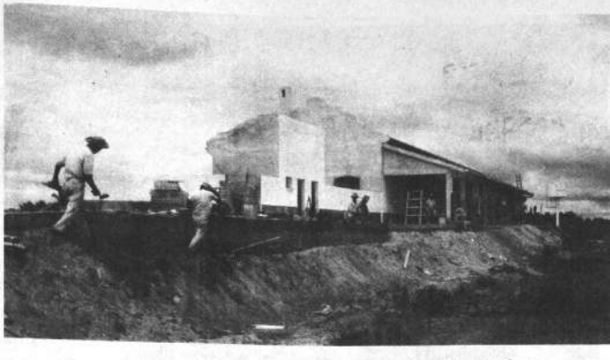
Este es el edificio central de la estación ferroviaria construida en la localidad de Montero. Cuenta con las instalaciones requeridas para este tipo de servicio, y en meses más será puesta a uso público con la inauguración de la ferrocarril Santa Cruz de la Sierra-Montero. El edificio está en viérsper de ser concluido, fáltan solamente detalles.