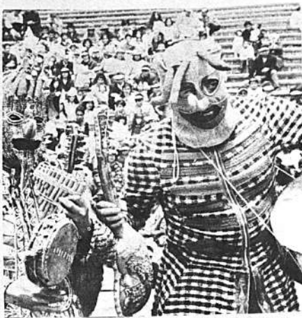
El dúo "Amumamu" resultó ganador del concurso en su categoría, para representar a La Paz en el concurso de Oruro.

Otra demostración de que los propios concursantes desconocen este tipo de competencias es el hecho de que varios de ellos se descalificaron interpretando canciones extranjeras, con letra cambiada. Es el caso de "Los Chasckas".