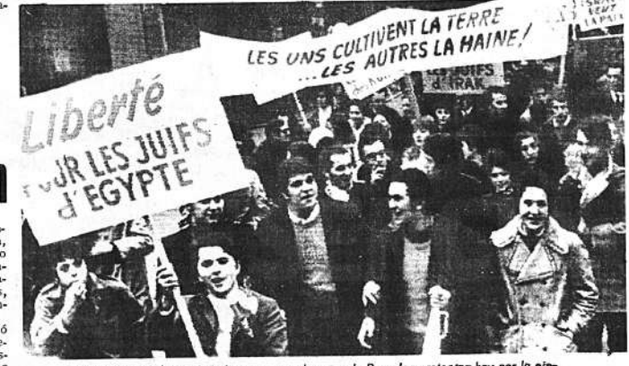
BRUSELAS, 2 (AP).- Manifestantes en el centro de Bruselas protestan hoy por la ejecución de 14 presuntos espías israelíes, incluidos nueve judíos, en Bagdad la semana pasada.