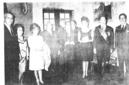
El Embajador del Perú y la señora de Ponce ofrecieron el jueves una recepción con motivo de la condecoración al Ministro de Relaciones Exteriores, señor Victor Hoz de Vial. A la derecha el anfitrión con el agasajado.

Hoy al rendirle tributo de admiración a estos esposos, dado es testimoniarles a nombre de la sociedad cruceña con emoción y cariño, el alborozo que la embarga en tan grande acontecimiento familiar