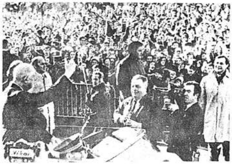
El Presidente Charles de Gaulle saluda al gentío al salir del ayuntamiento de Brest hoy, durante el segundo día de su visita a Bretaña. Se registraron manifestaciones estudiantiles contra el Presidente de Gaulle.

un pequeño telescopio regalo de amigos norteamericanos. Desgraciadamente, tiene la lente rota. Pero Mukuka Nkosole no se amilana por tan poca cosa y sigue entrenando a su futuro cosmonauta, esencialmente haciéndolo rodar por una ladera metida en un bido de petróleo vacío. Un equipo de "tierra" está encargado de recuperar al magullado cosmonauta cuando acaba de despeñarse. Mukuka Nkosole declaró al "Observer": "No queremos ser eternamente esclavos de este planeta.