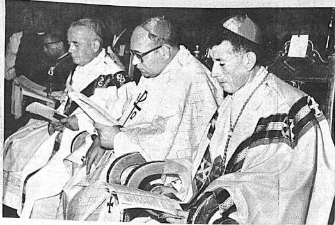
El Obispo de Cochabamba, Mons. Armando Gutiérrez Granier; el Obispo Auxiliar de La Paz, Mons. Genaro Prata; y el nuevo Obispo Auxiliar de Cochabamba, Mons. Abel Castas, que será posesionado en su Diócesis el próximo domingo, fueron condecorados en la misa de ayer en la Catedral.

En fuentes de la Universidad Mayor de San Andrés se informó que las universidades de Potosí y Tarija habrían solicitado la realización de una Conferencia Nacional Extraordinaria de Rectores en la primera quincena de este mes. El objeto de esta conferencia sería el de analizar exhaustivamente el problema económico por el que atraviesan las universidades del país y buscar soluciones adecuadas al momento actual. Dichas fuentes aseguran que la conferencia se llevará a cabo en La Paz, en vista de que los principales organismos del gobierno se encuentran en esta ciudad y de que las universidades del interior tienen pendientes una serie de trámites ante el Ministerio de Hacienda que los impide acudir a la ciudad. Los rectores de las universidades de Potosí y Tarija, en vista de que los principales organismos del gobierno se encuentran en esta ciudad y de que las universidades del interior tienen pendientes una serie de trámites ante el Ministerio de Hacienda que los impide acudir a la ciudad.