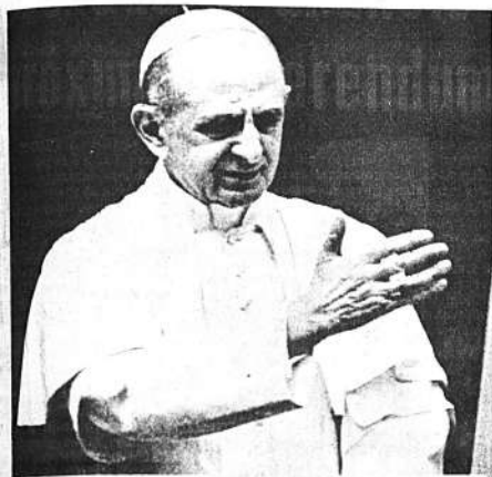
CIUDAD DEL VATICANO, 2 (AP).- El Papa Paulo VI habla a los fieles reunidos en la Plaza de San Pedro pidiéndoles que defiendan la dignidad humana del neopaganismo que sufre la sociedad contemporánea. Su discurso fue pronunciado con motivo de la fiesta de La Candelaria.