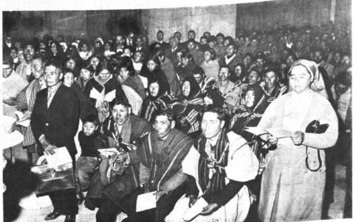
Religiosos, catequistas y nativos del Altiplano siguieron atentamente la ceremonia en la Catedral y vivieron a su cargo las horas contadas en ayamard. Por primera vez los fieles poeños tuvieron oportunidad de asistir a una ceremonia religiosa que, como la de ayer, tuvo como característica la solemnidad y una enorme emoción.

Hasta hace poco los malos ex - dirigentes han jugado con la esperanza de los padres de familia y con el porvenir de los estudiantes. Se han convertido las Universidades y las escuelas en cajas de resonancia para el extremismo rojo y la agitación inmotivada. Este juego pernicioso, disociador, ha culminado durante la desastrosa gestión de 1968, durante la cual en vez de enseñanza tuvimos politiquería en las aulas y desorden en las calles. Esto no se ha de repetir en 1969. Porque mi gobierno está decidido a imponer paz y orden en el país, porque sé que puedo contar con la voluntad mayoritaria de los maestros y maestras de Bolivia, porque los padres de familia me van a colaborar en este empeño constructivo para defender la salud física y moral de sus hijos, y porque los mismos niños, comprendiendo lo que les conviene, no se van a prestar a caer en las antiguas trampas de los agitadores profesionales.