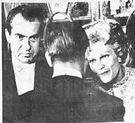
Washington 2 (AP).- Shu-Kai Chow, embajador chino en Estados Unidos saludó al Presidente Nixon y a su esposa al ingresar a la primera recepción social dada en la Casa Blanca por el nuevo Presidente.

Los informantes dijeron que las autoridades occidentales habían calificado la prueba nuclear de diciembre de un completo éxito.