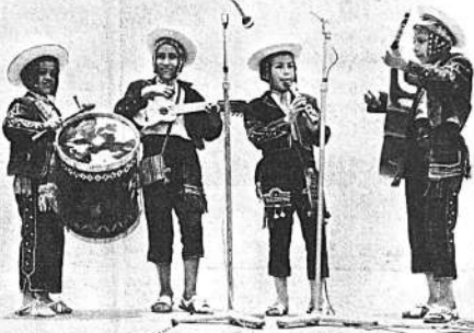
"Los Laikitas", conjunto de niños, se ganó una mención de honor de parte del jurado calificador, el mismo que recomendó el viaje de estos pequeños a Oruro, para actuar extra concurso.