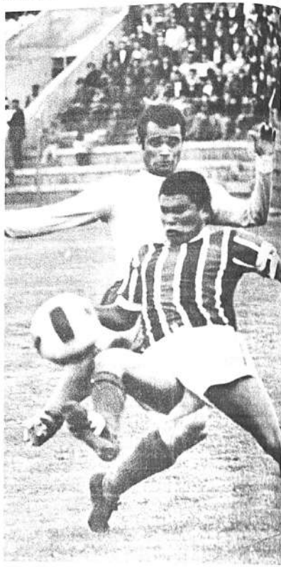
RECHAZA SOLIZ.- El zaguero central de Litoral se sentó pa a Coutinho y rechaza. Fue buena la actuación del marcador central del plantel cochabambino y se constituyó pilar de su defensa.

PROXIMA FECHA: Domingo 9 en La Paz, BOLIVAR VS. CERRO PORTEÑO; en Cochabamba LITORAL VS. OLIMPIA.