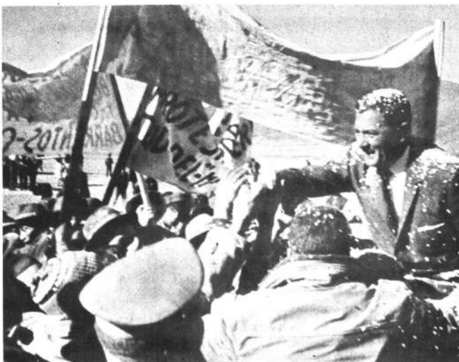
Pobladores y mineros de Siglo XX y Catavi tributaron un cordial recibimiento al Presidente de la República, cuando visitó ese distrito minero para la inauguración de las plantas recuperadoras de colas y desmontes.