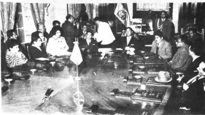
Cerca de cincuenta maestros, dirigentes nacionales, se reunieron anoche a partir de las 22 horas con el Presidente de la República, Gral Barrientos, en su despacho del Palacio de Gobierno. Enseña la fotografía un aspecto de la reunión y en la cual se puede ver al Primer Mandatario, al Ministro de Educación y a algunos dirigentes de los maestros.