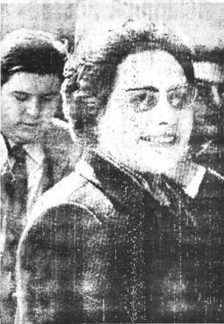
PARIS, 2 (AP).- La señorita Mari Madeleine Dienesch, nueva Secretaria de Estado para Educación Nacional, llega al palacio del Eliseo para asistir a una reunión del nuevo gobierno.