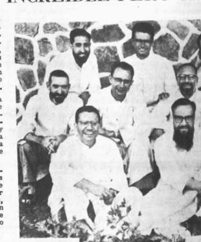
Ocho misioneros para ocho millones de habitantes. Bombay.

Esta foto nos demuestra con la elocuencia la difícil situación religiosa en que se encuentran las regiones de la India: OCHO MISIONEROS PARA OCHO MILLONES DE HABITANTES.