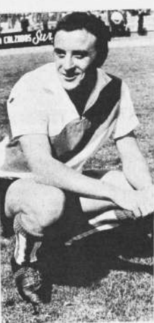
Con deseos de cumplir la actuación el domingo siguiente, ayer finalizó su entrenamiento el conjunto "atigrado" recién de Juan Valenzuela, que pronosticó su próximo triunfo al equipo "celeste" por 2-1.

Juan Valenzuela al plantel la alineación de su equipo, "atigrado" saldrá a enfrentar a Bolívar con el derecho de enfrentarse a la Selección Nacional en una prueba. Durante la plantel "atigrado" no en forma intensa, suponer que los muchachos en un buen partido, clarificar el cotejo de la noche.