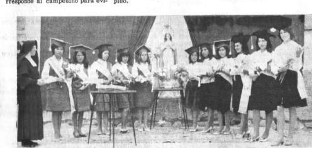
Promoción 1966 de la Escuela Profesional "Nuestra Señora de Lourdes", en Villazón, correspondiente al grupo de egresadas de la Sección Secretario Comercial.

"La vigencia del impuesto predial rústico, para el caso de las tierras afectadas por Reforma Agraria, no es fácilmente aplicable por lo que se señaló", dijo, añadiendo: "Este es un problema de magnitud que está siendo estudiado. Los 'Trabajadores de Desarrollo de Comunidades' (T.D.C.), consiguientemente, deberán constituirse en celosos guardianes de lo que en justicia corresponde al campesino para evitar