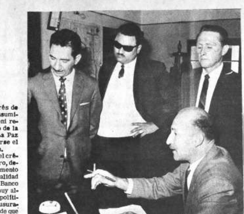
Los delegados ganaderos del Beni, que ayer visitaron a PRESENCIA, son partidarios de limitar las utilidades de los comerciantes intermediarios, como una forma de evitar el alza del precio de la carne.