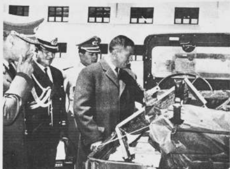
Arriba: Una vista de los jeeps que el Embajador de Estados Unidos entregó ayer a las Fuerzas Armadas de Bolivia. Abajo: El Gral. Alfredo Ovando Candia, Comandante en Jefe de las FF.AA. y el Presidente Barrientos observan uno de esos vehículos, completamente equipado.