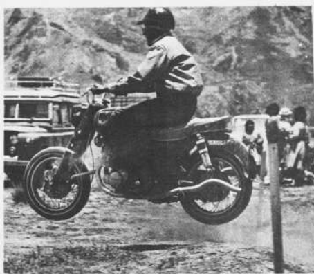
„MOTOCICLISMO. Los patrulleros de la Dirección General de Tránsito realizarán mañana un interesante número de motociclismo acrobático, que es una verdadera atracción.