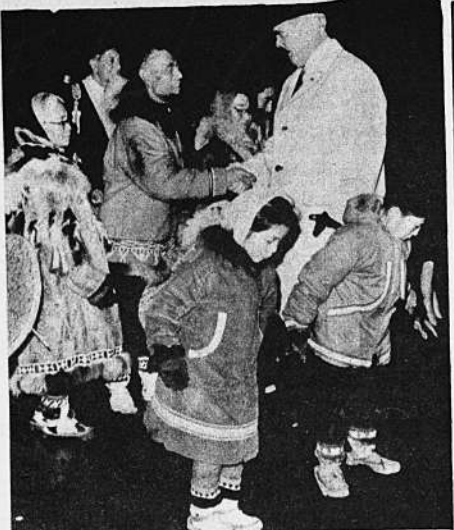
Durante su reciente estado en Anchorage, Alaska, el presidente Johnson es saludado por esquimales. Johnson volvió de una gira de 17 días por Australia y Asia.