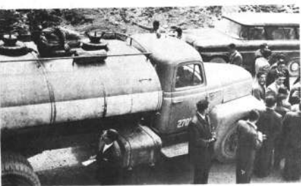
Los contradicciones establecidas por autoridades del DIC, en la investigación del caso Chávez Taborga, hacen más complicados los averiguaciones. La fotografía, muestra la forma en que el profesor agredido fue trasladado hasta esta ciudad, en el camión cisterna, desde el camino a Yungas hasta esta ciudad.