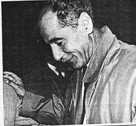
"Si se hace una franca subversión, es un deber dictar el estado de sitio", declaró esta madrugada el Comandante en Jefe de las Fuerzas Armadas. Sin embargo, considera que por el momento, aún no es necesario adoptar esa medida extrema.

La Central Obrera se somete hoy a una prueba de fuego que puede definir su condición de entidad matriz del laborismo boliviano. Jugará sus últimas cartas midiendo hasta qué punto todavía puede dirigir un movimiento obrero contando con su apoyo. La Junta Militar también podrá medir la capacidad de fuerza de la COB. La opinión se generaliza de que hoy será un día decisivo; de los resultados de la manifestación dependerá qué medidas adopte el Gobierno.