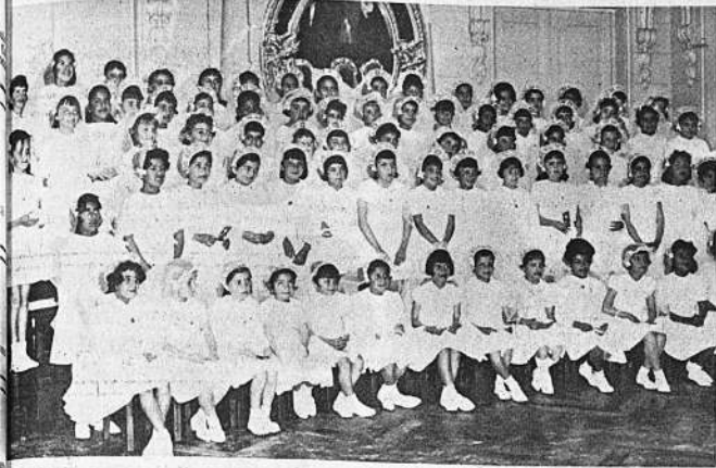
Un grupo de 60 niñas recibió el viernes pasado la Sagrada Eucaristía en el Templo de los Padres Carmelitas. El grupo pertenece al segundo curso del Colegio Loreto atendido por las Reverendas Madres de Saint Louis, Estancias Unidas. En el grabado posan para "PRESENCIA" las alumnas del citado establecimiento.